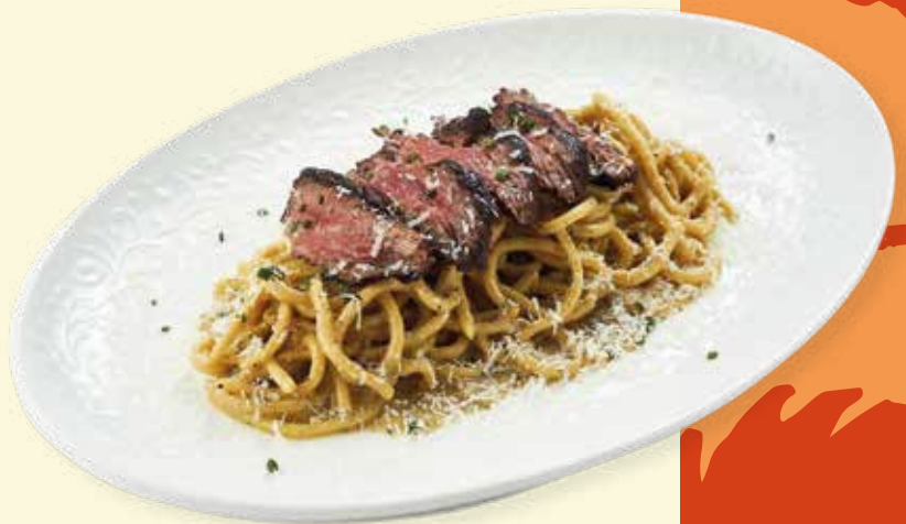
Топпинг к пасте