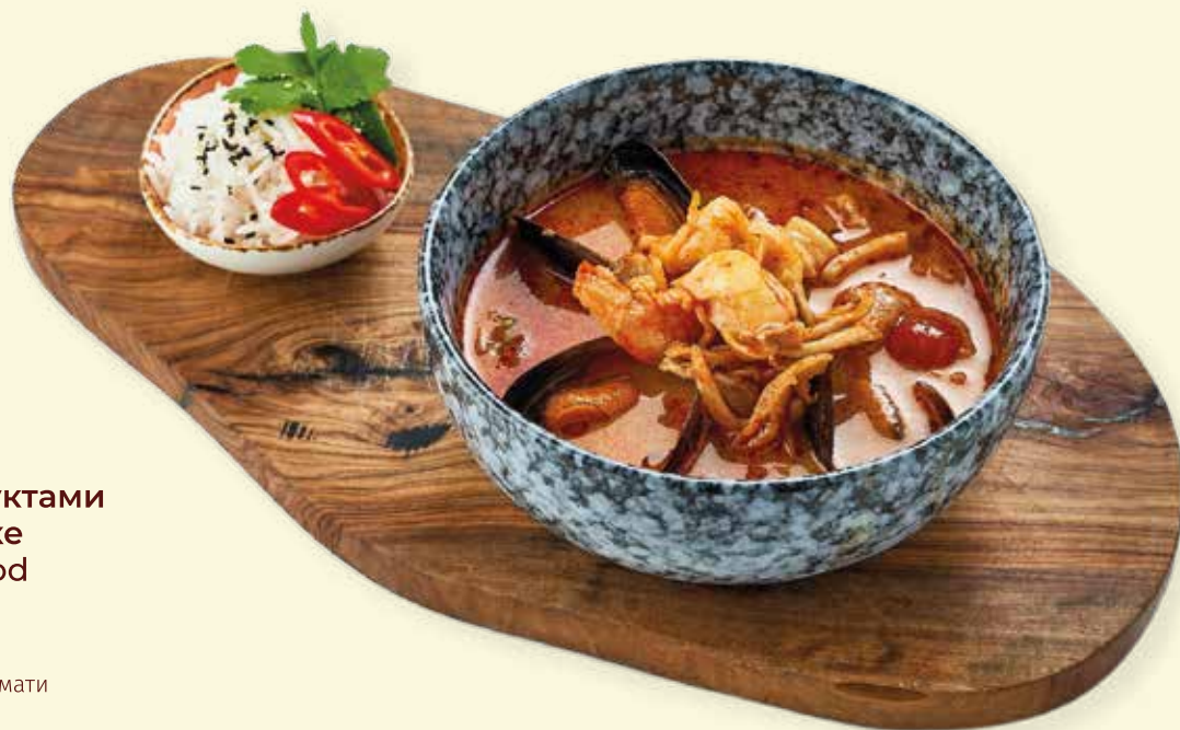
Том ям с морепродуктами на кокосовом молоке Tom Yum with Seafood in Coconut Milk

Креветки, кальмар и мидии, подаётся с отварным рисом басмати