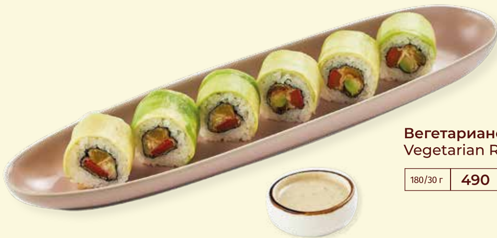
Вегетарианский ролл Vegetarian Roll