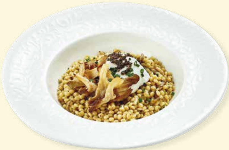
Птитим с вёшенками, трюфельным соусом и яйцом пашот Ptitim with Oyster Mushrooms, Truffle Sauce, and Poached Egg