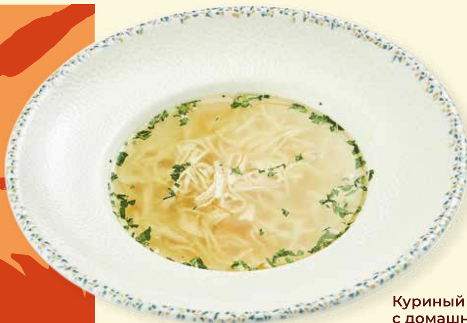
Куриный бульон с домашней лапшой Chicken Broth with Homemade Noodles