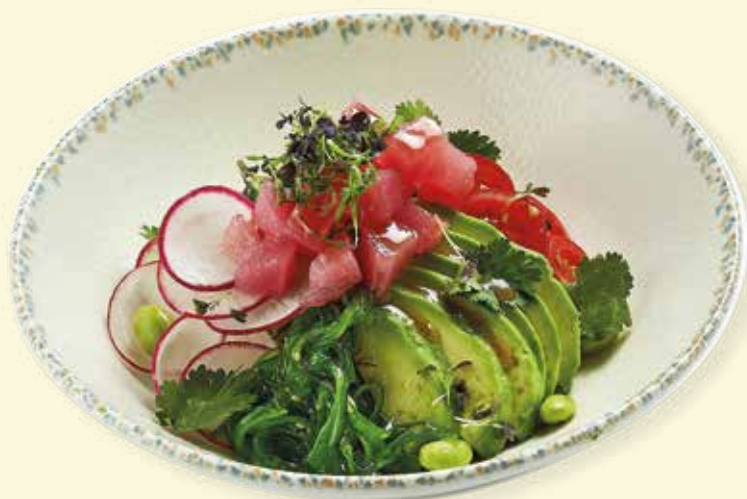
Поке с лососем Salmon Poke