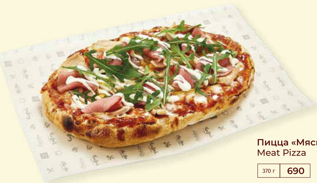
Пицца «Мясная» Meat Pizza