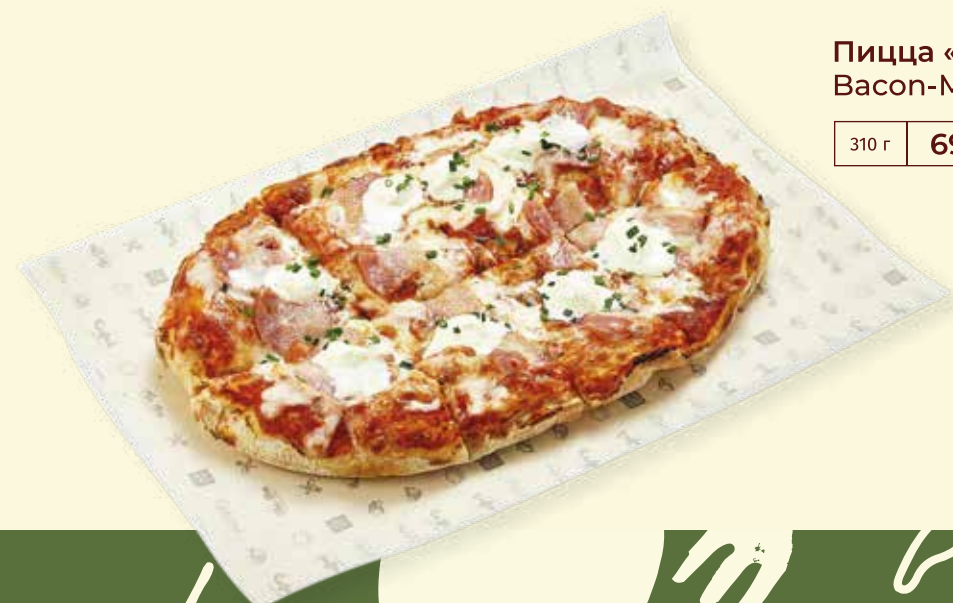
Пицца «Бекон-маскарпоне» Bacon-Mascarpone Pizza