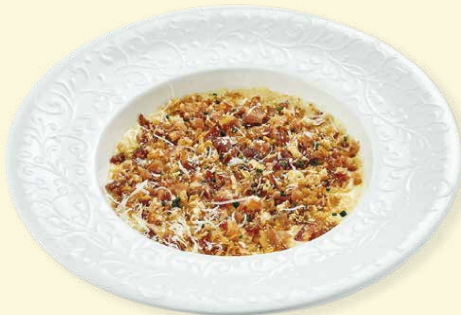
Сырный суп с пшеничной гранолой и беконом Cheese Soup with Granola and Bacon