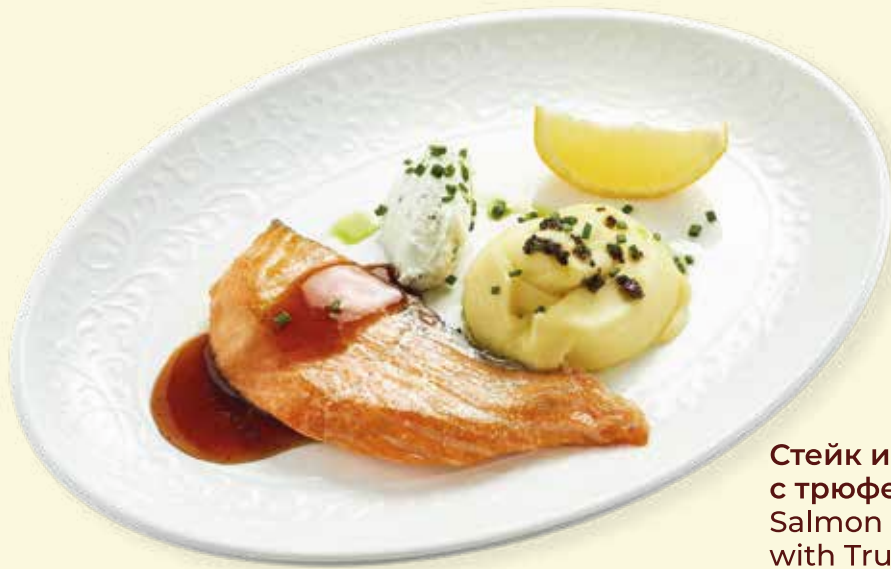
Стейк из лосося с трюфельным пюре Salmon Steak with Truffle Purée