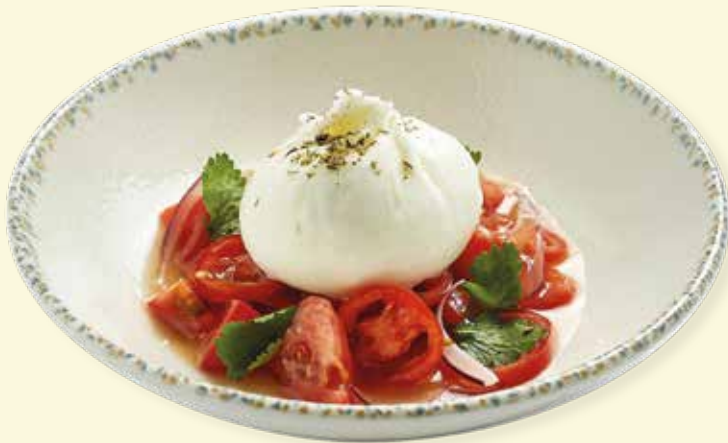
Севиче из томатов с бурратой Tomato Ceviche with Burrata