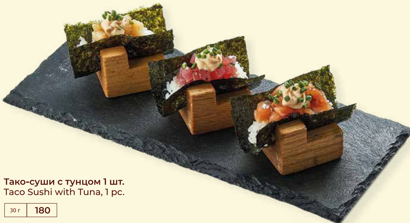
Тако-суши с тунцом 1 шт. Taco Sushi with Tuna, 1 pc.