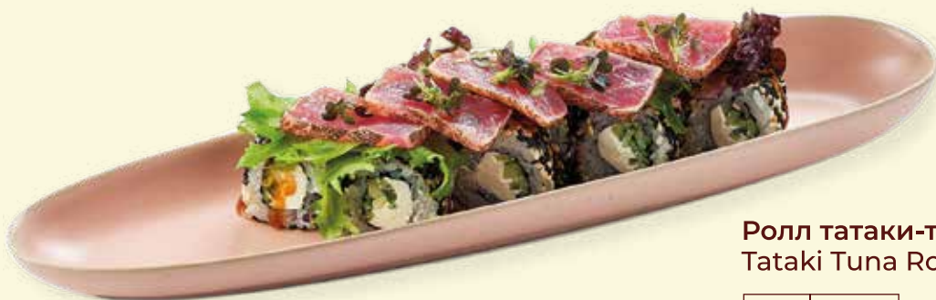
Ролл татаки-тунец Tataki Tuna Roll