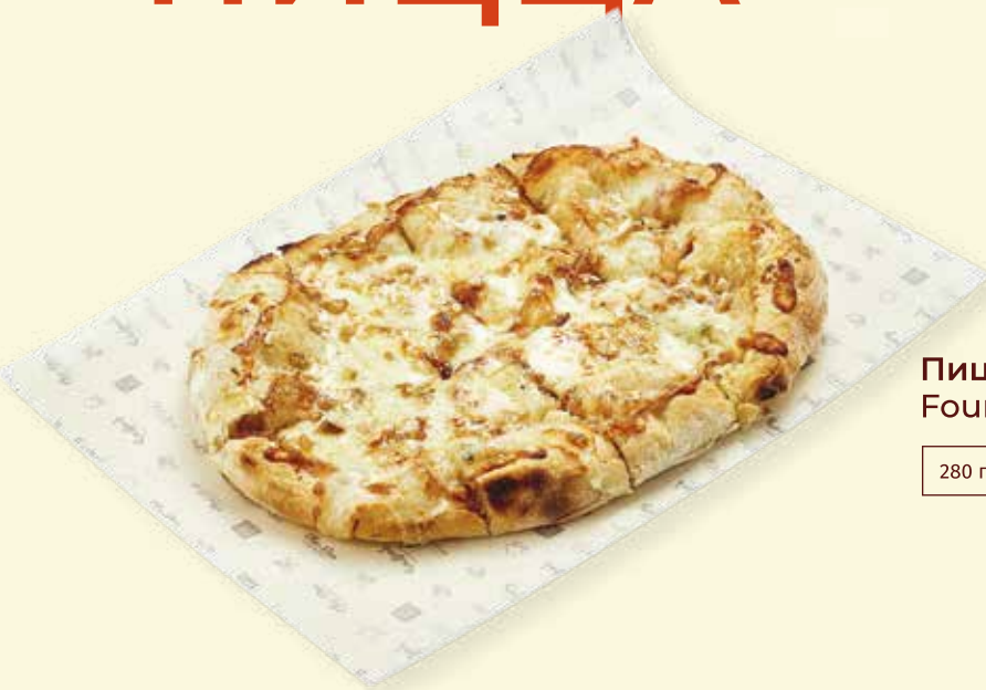
Пицца «Четыре сыра» Four Cheese Pizza