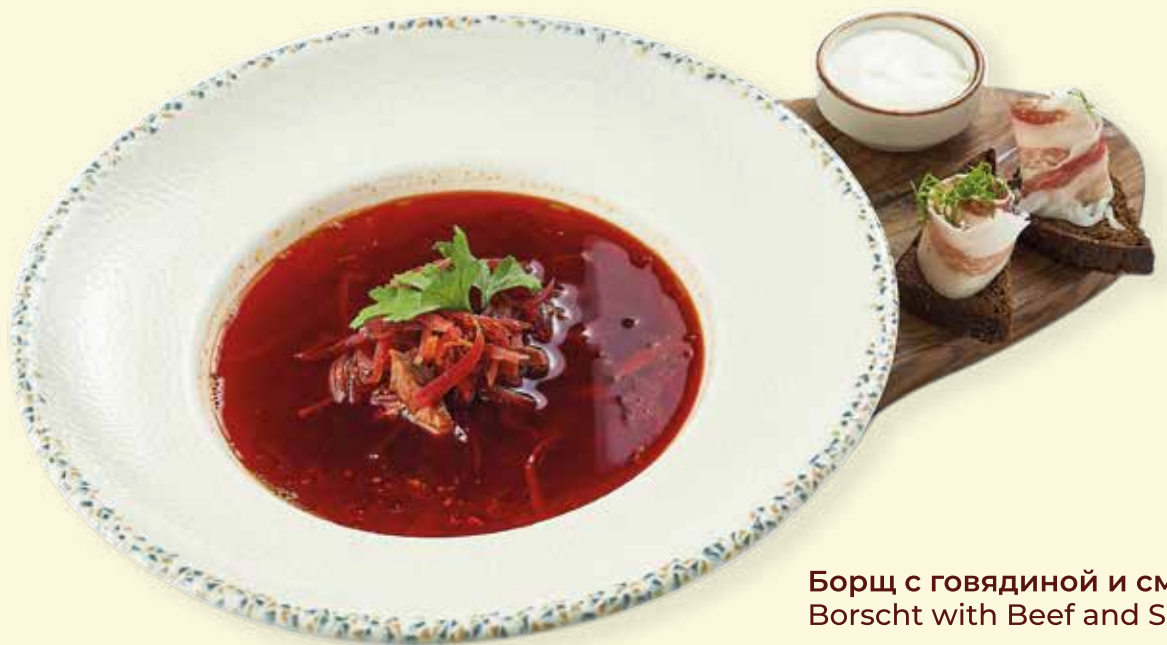
Борщ с говядиной и сметаной Borscht with Beef and Sour Cream