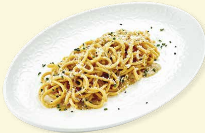
Спагетти качо-э-пепе с мраморной говядиной Cacio e Pepe Spaghetti with Marbled Beef