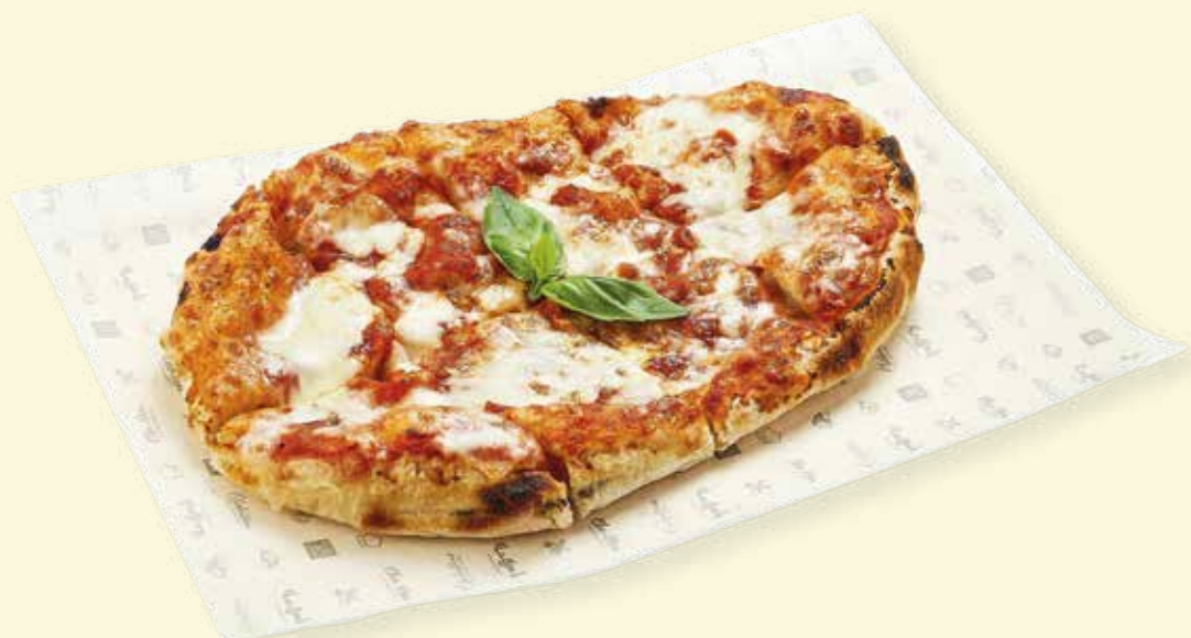
Пицца «Маргарита» Margherita Pizza