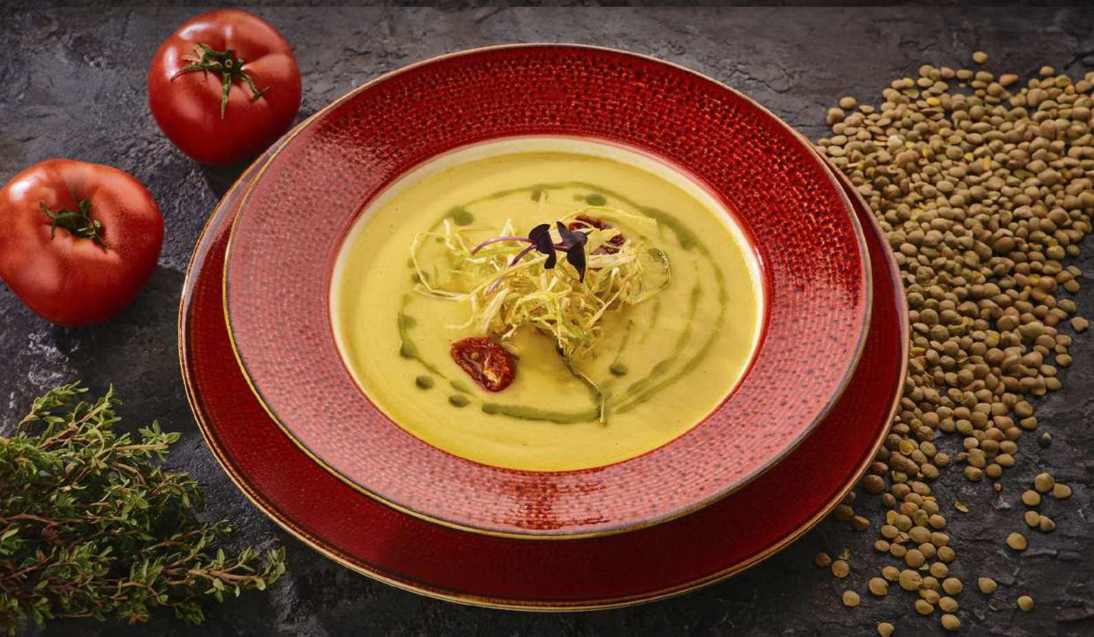
Крем-капучино из молодой кукурузы 350 г / 550руб.