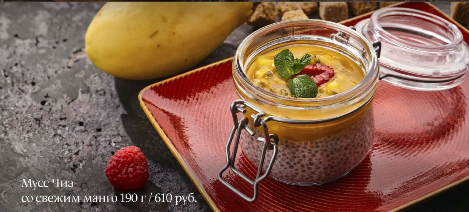
Мусс Chia со свежим манго 190 г / 610 руб.