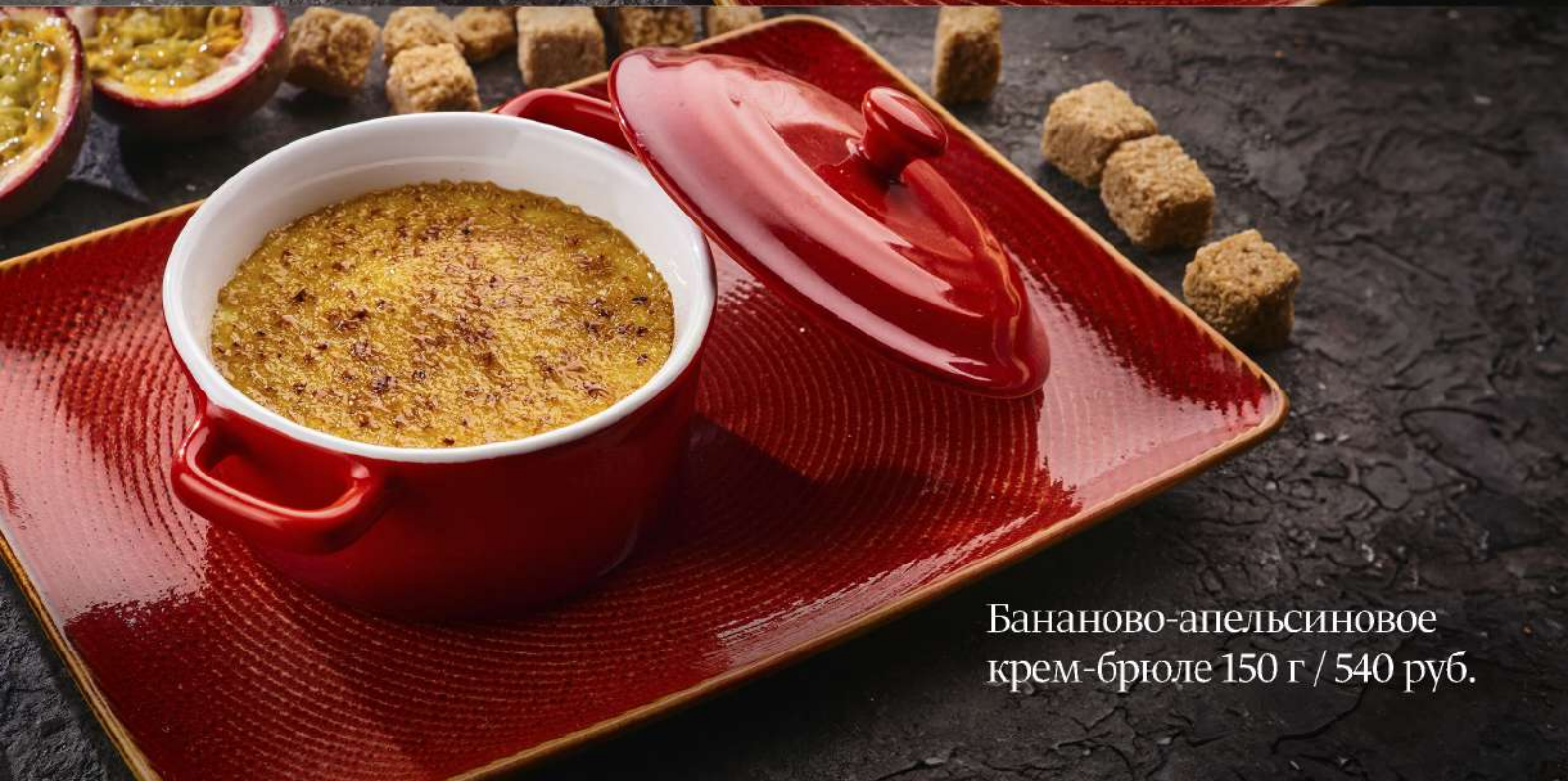
Бананово-апельсиновое крем-брюле 150 г / 540 руб.