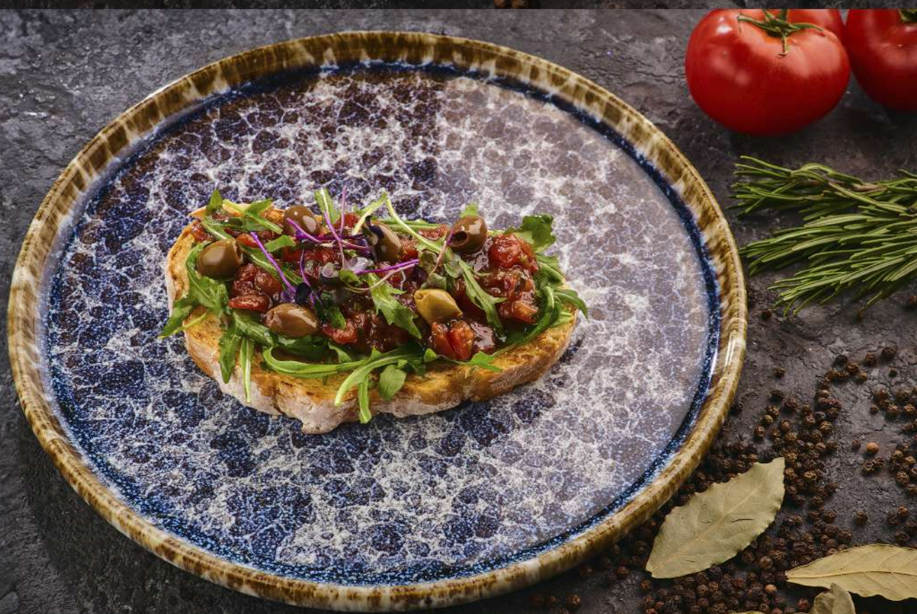
Брускетта с томатами и оливками 190 г / 610 руб.