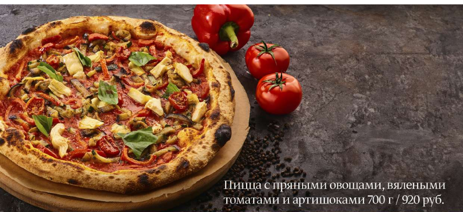
Пицца с пряными овощами, вялеными томатами и артишоками 700 г / 920 руб.