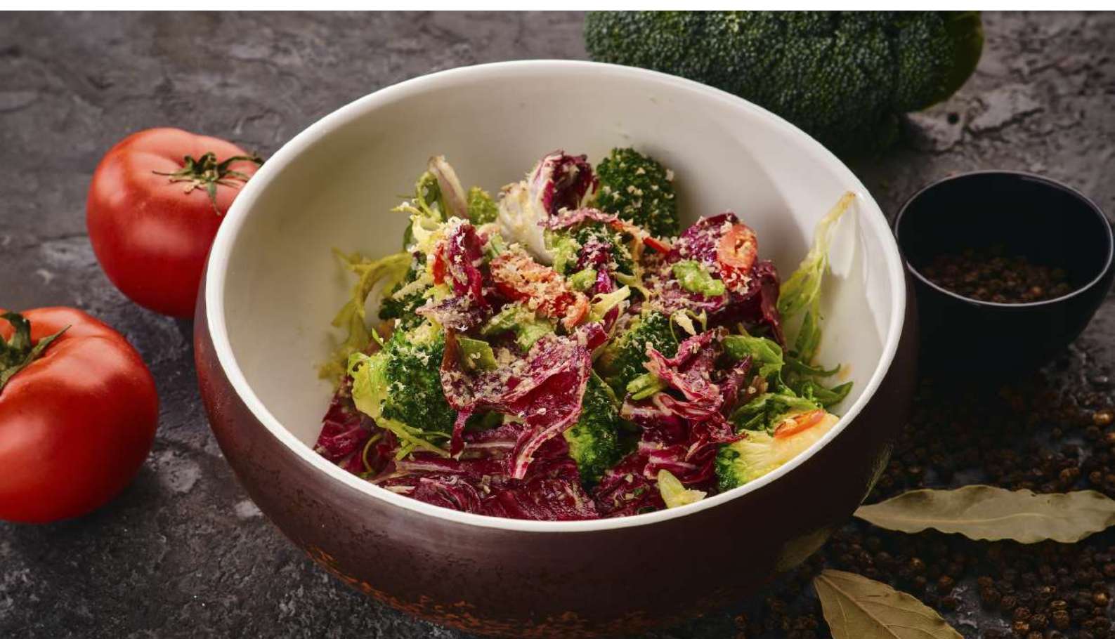
Салат с брокколи, листьями салатов, арахисом, таджасскими оливками и ореховой заправкой 220 г / 610 руб.