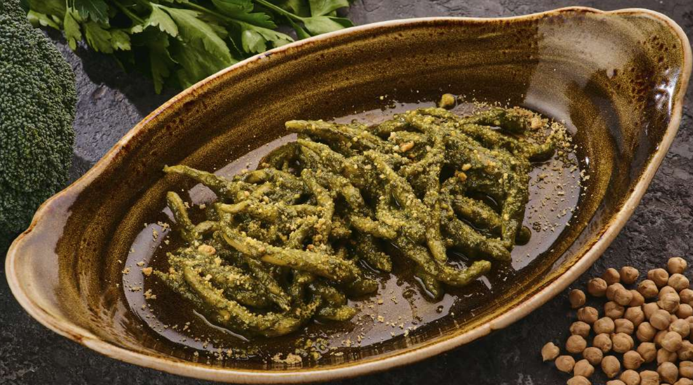
Паста Трофи в соусе Песто 245 г / 610 руб.