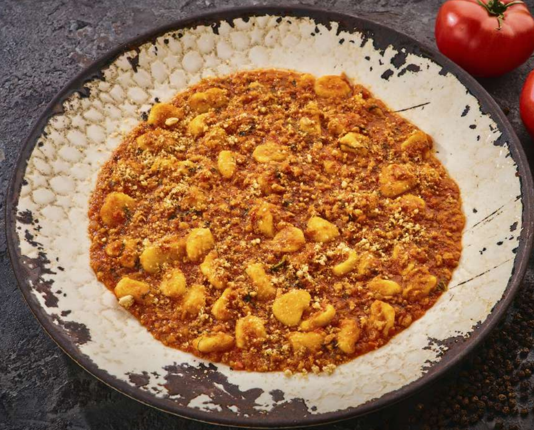
Орикьетти в соусе Веган-Болоньезе 305 г / 640 руб.