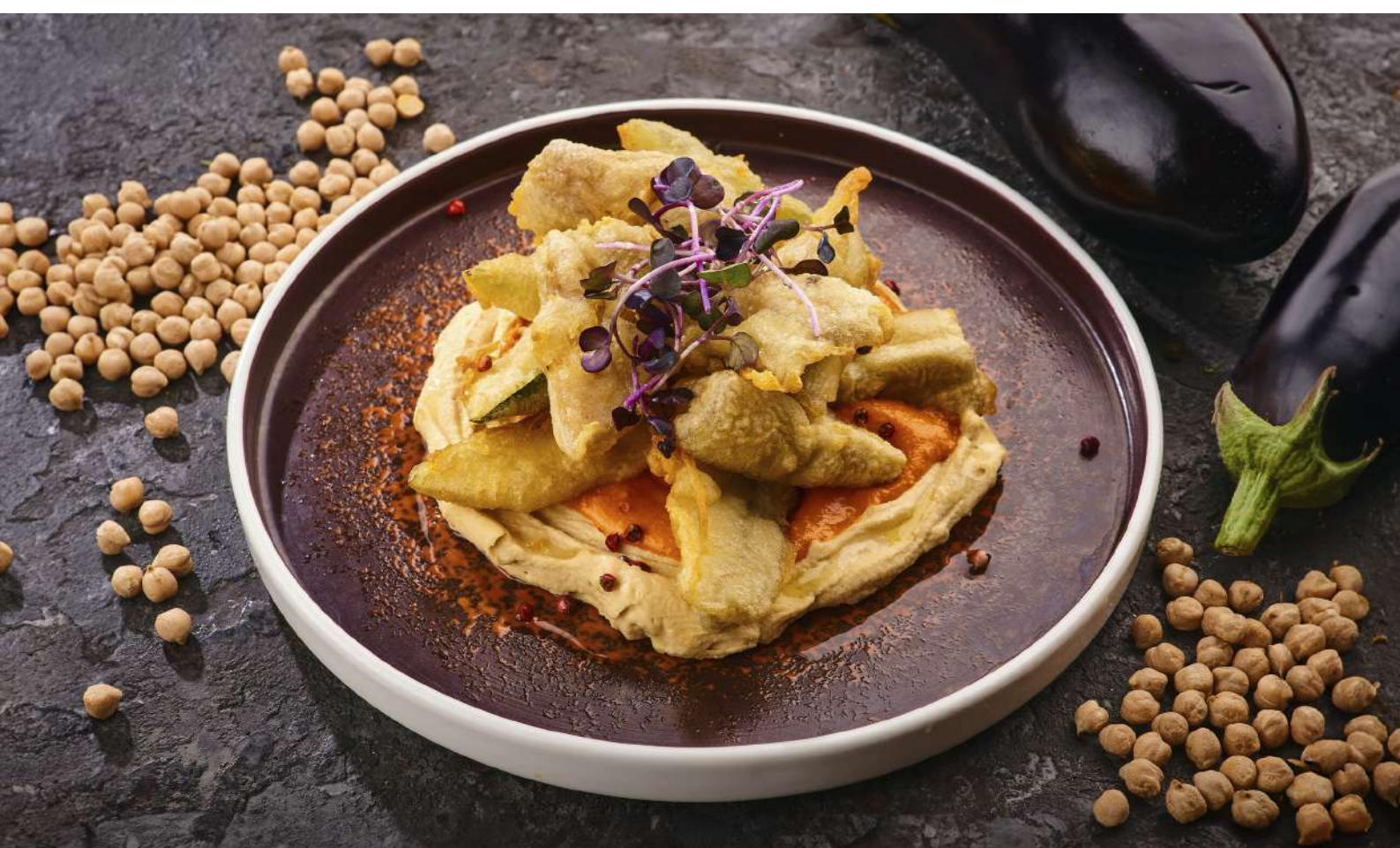
Хумус с фритто мисто и соусом Ромеско 290 г / 560 руб.