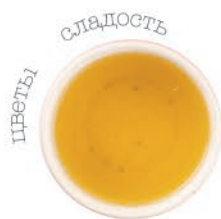
Сенча Сё 370