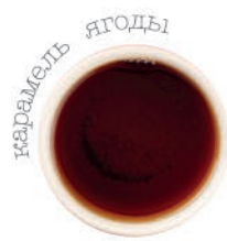
Черная жемчужина из Кагосимы 370