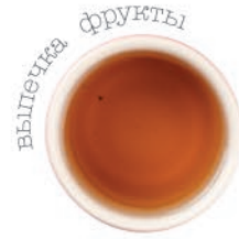
16 Улун 370