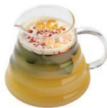
Каламанси- розовый перец

Пюре каламанси, имбирный сироп, кумкват, розовый перец, лист лайма, сахар