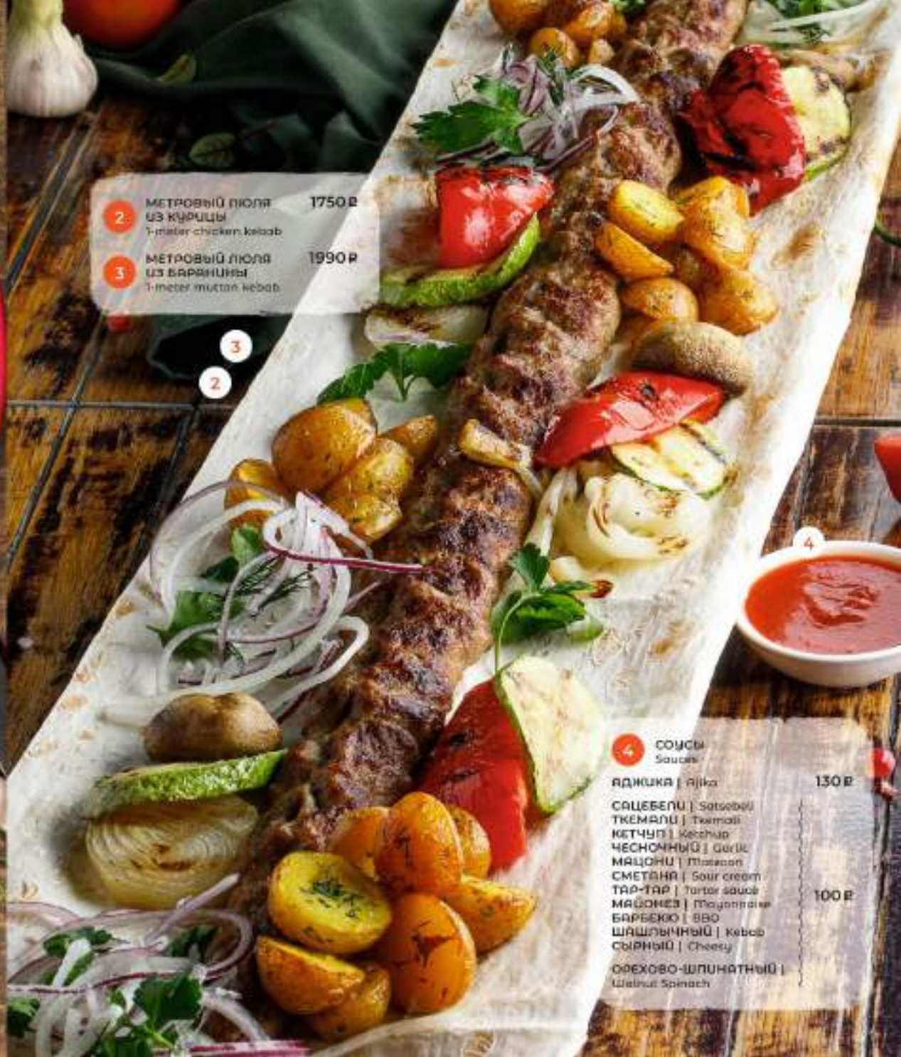
2 МЕТРОВЫЙ ЛЮЛА UZ KURUCI 1-meter chicken kebab 1750 P 3 МЕТРОВЫЙ ЛЮЛА UZ BARMUNY 1-meter mutton kebab 1990 P