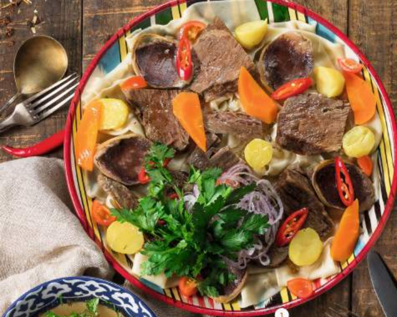
1 БЕШБАРМАК Beshbarmak 1550 P