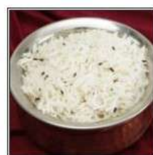
ДЖИРА РАЙС / JEERA RICE