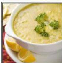
ШОРБА МУЛИГАТВАНИ / MULLIGATAWNY SHORBA