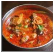
ФИШ КАРРИ / FISH CURRY