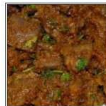
ГОШТ МАСАЛА / GOSHT MASALA