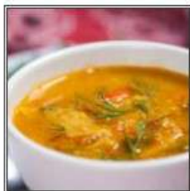
ФИШ ШОРБА / FISH SHORBA