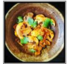
АЧАРИ МАШРУМ САЛАТ / ACHARI MUSHROOM SALAD