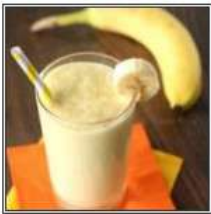
БАНАНА ШЕЙК / BANANA SHAKE