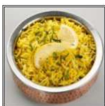
ЛЕМОН РАЙС / LEMON RICE