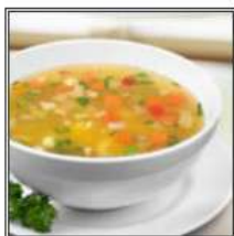
МИКС ВЕДЖ СУП / MIX VEG SOUP