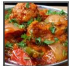
ЧИКЕН ДО ПЬЯЗА / CHICKEN DO PYAZA