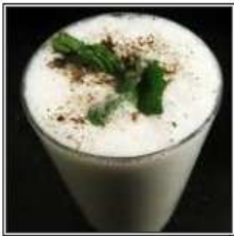
САЛТЕД ЛАССИ / SALTED LASSI