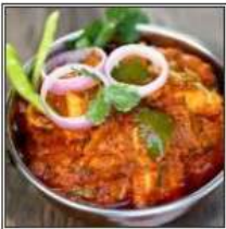
КАРХАИ ПАНИР / KARHAI PANEER