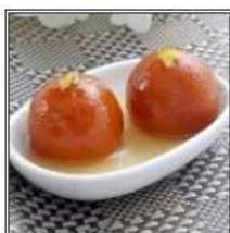
ГУЛАБ ДЖАМУН / GULAB JAMUN