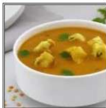
ГАРАМ МАСАЛА ЧИКЕН ШОРБА / GARAM MASALA CHICKEN SHORBA