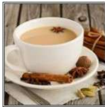
ЧАЙ МАСАЛА / TEA MASALA