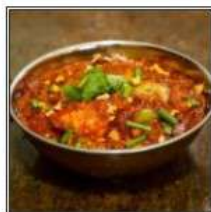
КАРХАИ ЧИКЕН / KARHAI CHICKEN