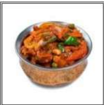
МИКС ВЕДЖ ДЖАЛФРЕЗИ / MIX VEG