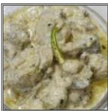
МАТТАН КОРМА / MUTTON KORMA