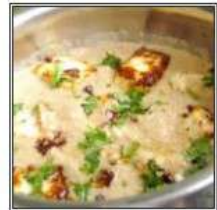
ПАНИР МЕТХИ МАЛАИ / PANEER METHI