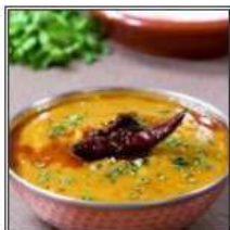
ДАЛ ТАДКА / DAL TADKA