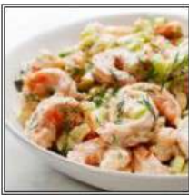
ШРИМП САЛАТ / SHRIMP SALAD