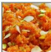
ГАДЖАР КА ХАЛВА / GAJAR KA HALWA