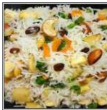
НАВРАТАН ВЕДЖ ПУЛАО / NAVRATAN VEG