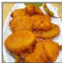
МИКС ВЕДЖ ПАКОРА / MIX VEG PAKORA