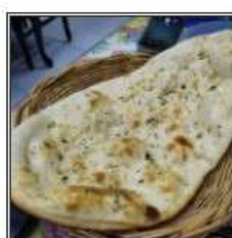
ГАРЛИК НААН / GARLIC NAAN