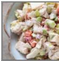
ЧИКЕН САЛАТ / CHICKEN SALAD