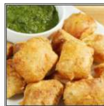
ПАНИР ПАКОРА / PANEER PAKORA