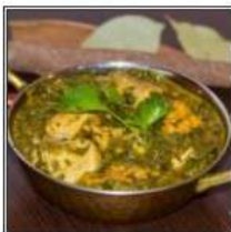
САГВАЛА ЧИКЕН / SAGWALA CHICKEN