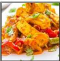
ПАНИР ДЖАЛФРЕЗИ / PANEER JALFREZI