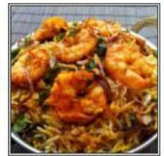
ПРАУН БИРИАНИ / PRAWN BIRYANI