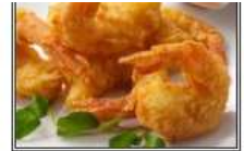
ПРАУН ПАКОРА / PRAWN PAKORA