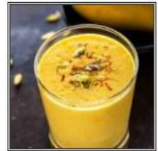
МАНГО ЛАССИ / MANGO LASSI