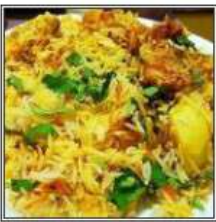
ЧИКЕН БИРИАНИ / CHICKEN BIRYANI