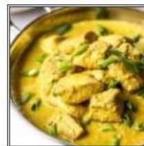
ЧИКЕН МЕТХИ МАЛАЙ / CHICKEN METHI MALAI