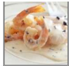
ЛАХСУНИ ПРАУНС / LAHSUNI PRAWNS