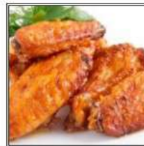
ЧИКЕН ВИНГС / CHICKEN WINGS