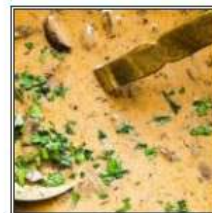
ГРИБНОЙ КРЕМ-СУП / CREAM-SOUP OF MUSHROOM