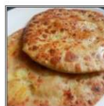
ОНИОН ПАРАТХА / ONION PARATHA