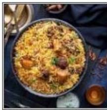
ГОШТ БИРИАНИ / GOSHT BIRYANI