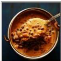
ДАЛ МАКХАНИ / DAL MAKHANI