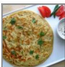
АЛУ ПАРАТХА / ALOO PARATHA