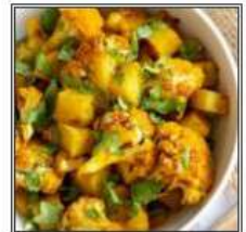
ГОБХИ АЛУ МАСАЛА / GOBHI ALOO MASALA