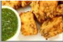
ФИШ ПАКОРА / FISH PAKORA