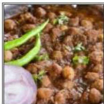
ПАНДЖАБИ ЧХОЛА / PANJABI CHOLE