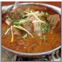
КАШМИР РОГАН ДЖОШ / KASHMIR ROGAN