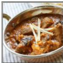
МАТТАН КАРРИ / MUTTON CURRY