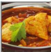
ЧИКЕН КАРРИ / CHICKEN CURRY