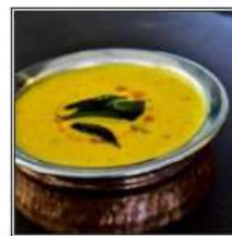
ГОА ФИШ КАРРИ / GOA FISH CURRY