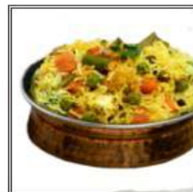
ВЕДЖИТЭБЛ БИРИАНИ / VEGETABLE BIRYANI