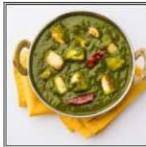
САГ ПАНИР / SAG PANEER