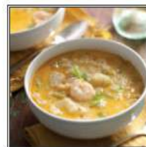
ДЖИНГА СУП / JHEENGA SOUP