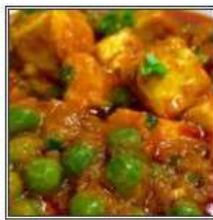
МАТАР ПАНИР / MATAR PANEER