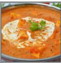
ГАРАМ МАСАЛА ШАХИ ПАНИР / GARAM