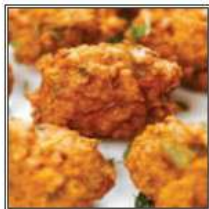
ЧИКЕН ПАКОРА / CHICKEN PAKORA