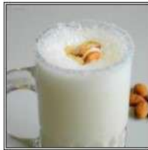
МИТХИ ЛАССИ / MITHI LASSI