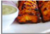
ФИШ ФРАЙ / FISH FRY