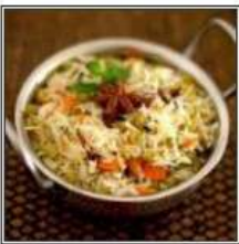
ГАРАМ МАСАЛА ВЕДЖ ПУЛАО / GARAM