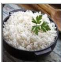
СТИМД РАЙС / STEAMED RICE