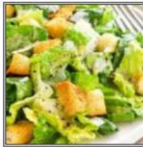
САЛАТ ЦЕЗАРЬ ПО-ИНДИЙСКИ / INDIAN CAESAR SALAD