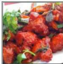
ЧИКЕН 65 / CHICKEN 65