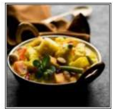
ВЕДЖ КОРМА / VEG KORMA