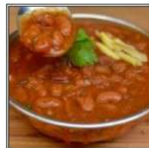
РАДЖМА / RAJMA