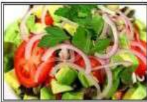
ХАРА БХАРА САЛАТ / HARA BHARA SALAD