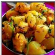
АЛУ ДЖИРА / ALOO JEERA