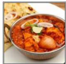
ПАНИР ДО ПЬЯЗА / PANEER DO PYAZA