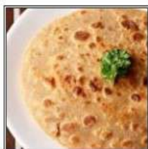
РОТИ ПАРАТХА / ROTI PARATHA