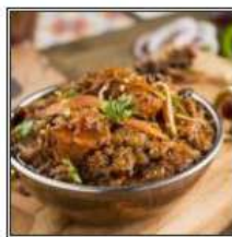
КАРХАИ ГОШТ / KARHAI GOSHT