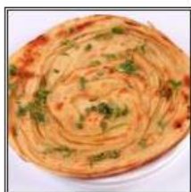
ЛАКЧА ПАРАТХА / ЛАССНА ПАРАТНА