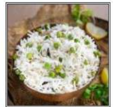
ПЕАС ПУЛАО / PEAS PULAO