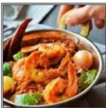
ГАРАМ МАСАЛА ПРАУНС / GARAM MASALA