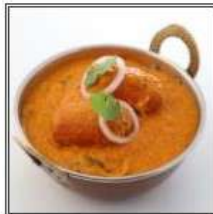
ВЕДЖ МАЛАЙ КОФТА / VEG MALAI KOFTA