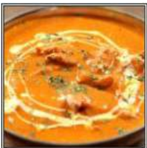
ГАРАМ МАСАЛА БАТТЕР ЧИКЕН / GARAM