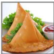
ВЕДЖ САМОСА / VEG SAMOSA