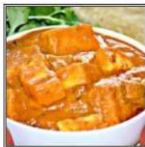
ПАНИР БАТТЕР МАСАЛА / PANEER BUTTER