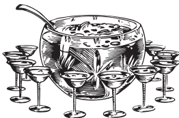
PLANTER'S PUNCH | 2700