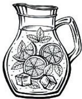
SANGRIA | 1900