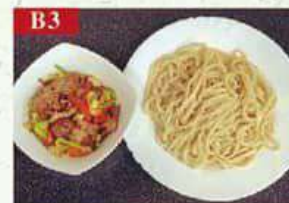
B3 Лапша со слабо-обжаренным мясом баранина, лапша, соевый соус, чеснок Noodles with pure mutton 纯羊肉拌面 300гр 460р