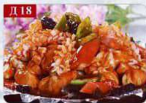
Д 18 Морепродукты на сковороде кальмары, креветки, болгарский перец, лук, морковь, специи Iron plate of seafood 铁板海鲜 300гр 680р