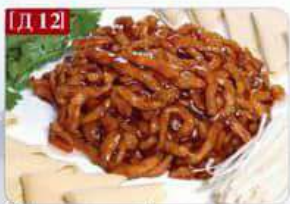
Д 12 Роллы по-китайски свинина, тофу-лист, лук порей Gold heaving 金酱肉丝 300гр 580р