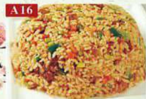
A16 Жареный рис с говядиной рис, говядина, горошек, кукуруза, морковь Fried rice with beef 牛肉炒饭 250гр 350р