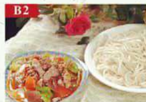
B2 Лагман с свиной и зеленым луком свинина, лапша, соевый соус, зелень Mix with oil 过油面拌面 300гр 380р