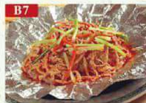
B7 Жареная рисовая лапша с говяжьей говядина, рисовая лапша, проростки, специи Fried beef powder 牛肉炒粉 250гр 360р