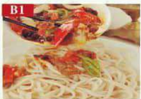
B1 Лагман с бараниной нарезанной ломтиками баранина, лапша, соевый соус, чеснок Black fungus pasta 木耳拌面 300гр 380р