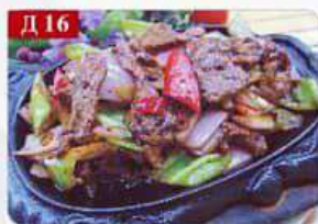
Д 16 Говядина в сковороде говядина, лук, болгарский перец, зелень Beef Steak Served on Sizzling Iron Plate 铁板牛肉 300гр 680р