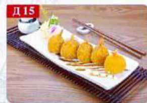
Д 15 Креветки в кляре с кисло-сладким соусом креветки, паниров. сухари, томат, специи Fried shrimp balls 炸虾球 6шт 450р