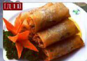
Д 11 Спринг-ролл с курицей курица, морковь, огурцы, соус Spring rolls 春卷 6шт 350р