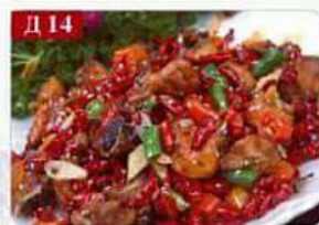
Д 14 Курица с перцем курица, перец чили Sichuan spicy chicken 川味辣子鸡 300гр 480р