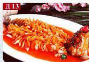
Д 13 Карп в кисло-сладком соусе карп, соус чили Sweet and sour fish 糖醋鱼 1/2 560р 600гр 980р