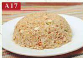
A17 Жареный рис с курицей рис, курица, кукуруза, морковь, горошек Chicken Fried rice 鸡肉炒饭 250гр 350р