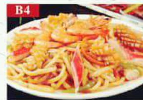
B4 Жареная лапша с морепродуктами морепродукты, лапша, проростки, лук, специи Seafood Fried noodles 海鲜炒面 250гр 360р