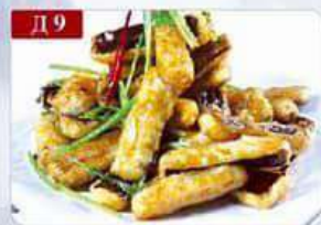
Д 9 Жареные баклажаны в кисло-сладком соусе болгарский перец, баклажаны, кунжут, специи Chicken flavor eggplant 风味茄子 280гр 460р