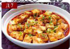
Д 7 Мапо тофу свиной фарш, тофу, специи The bean curd 麻婆豆腐 300гр 390р