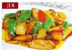
Д 8 Баклажаны жареные с перцем и картофелем болгарский перец, баклажаны, картофель, специи The three fresh 地三鲜 300гр 420р