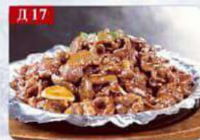
Д 17 Баранина на сковороде баранина, лук, болгарский перец, специи The sizzling mutton 铁板羊肉 300гр 680р