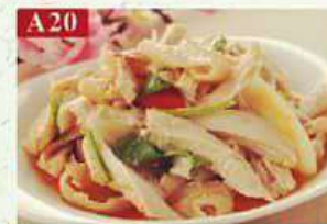
A20 Салат из курицы в пряном соусе куриное мясо, соевый соус, сельдерей, специи Pepper Ma Ji 椒麻鸡 150гр 360р