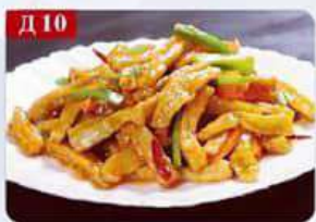
Д 10 Баклажан ю-сян морковь, грибы, болгарский перец, баклажан, зелень Braised in tomato 鱼香茄条 280гр 460р