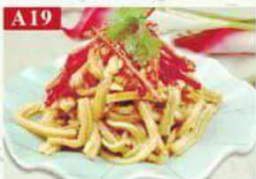
A19 Салат из трюхи со специями трюха, зелень, специи Spicy beef belly silk 香辣牛肚丝 150гр 360р