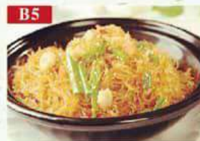
B5 Жареная рисовая лапша с морепродуктами морепродукты, рисовая лапша, проростки, специи Seafood Fried powder 海鲜炒粉 250гр 360р