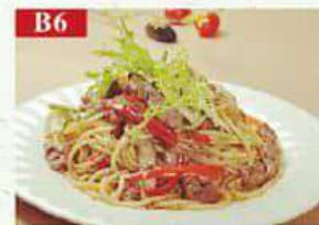
B6 Жареная лапша с говяжьей говядина, лапша, проростки, лук, специи Beef noodles 牛肉炒面 250гр 360р