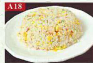
A18 Жареный рис с креветками рис, креветки, кукуруза, горошек, морковь Seafood Fried rice 海鲜炒饭 250гр 350р