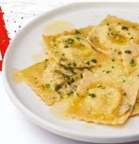
• РАВИОЛИ С КРЕВЕТКОЙ И СТРАЧАТЕЛЛОЙ