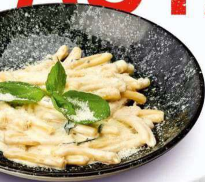
• КАЗАРЧЕ 4 СЫРА 300 г / 420 ₺