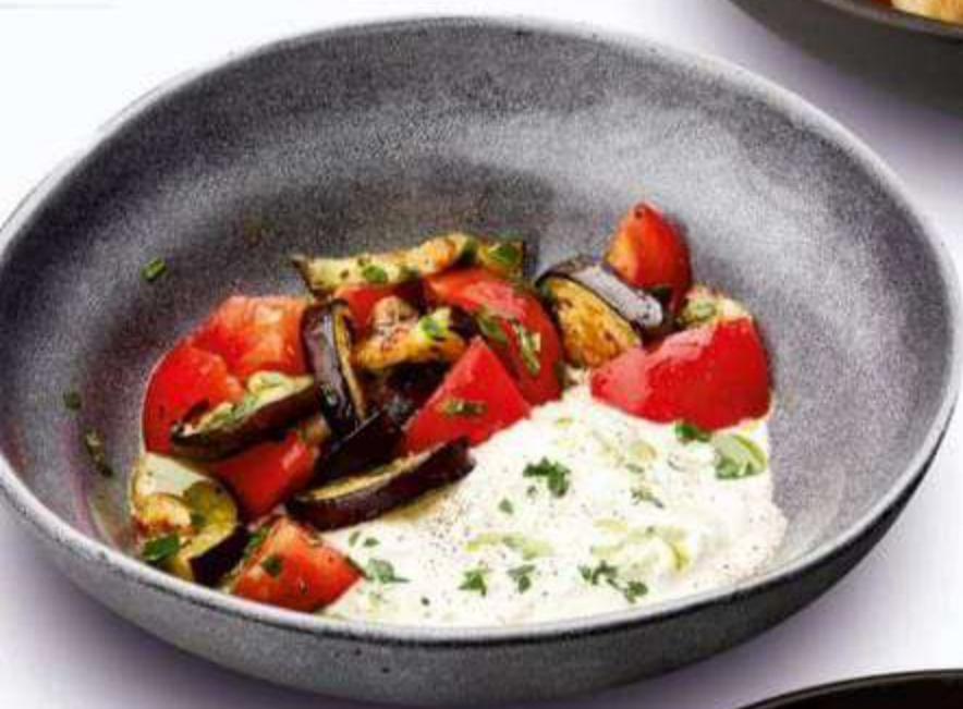
• ТОМАТЫ С БАКЛАЖАНАМИ И СТРАЧАТЕЛЛОЙ 180 г / 520 Р