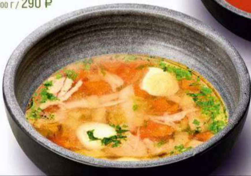
КУРИНЫЙ БУЛЬОН С ОРЗО 300 г / 290 Р