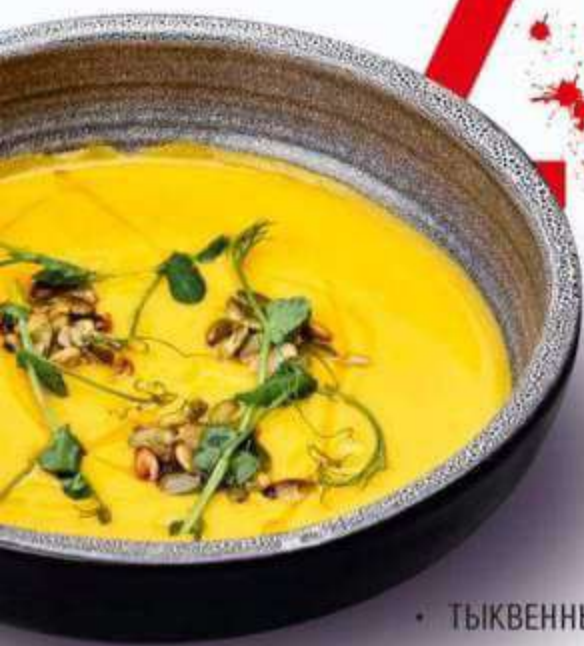
• ТЫКВЕННЫЙ СУП СО СЛИВКАМИ 330 г / 290 Р