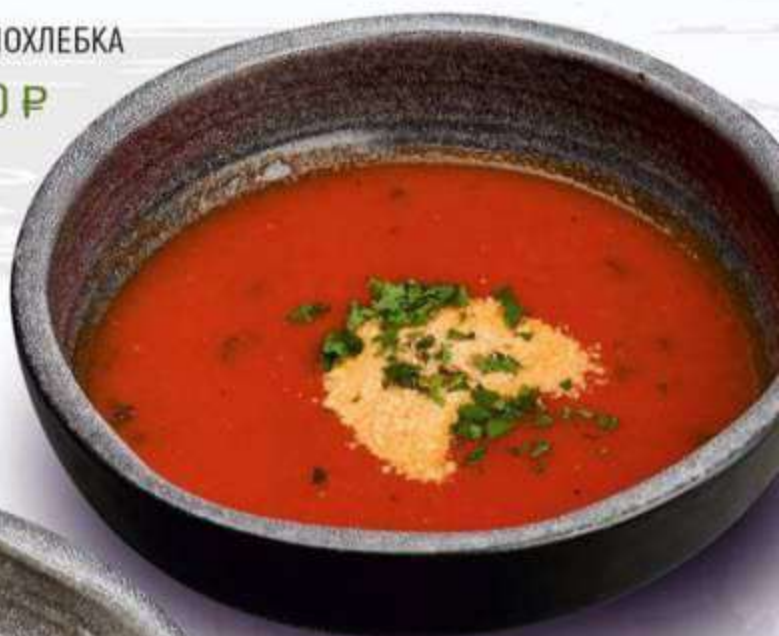
• ТОМАТНЫЙ СУП С ПАРМЕЗАНОМ 270 г / 380 Р