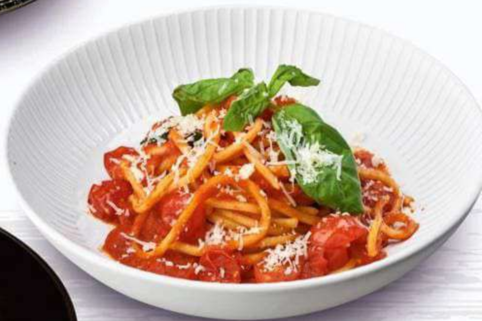
• ПАСТА АЛЬ ПОМОДОРО