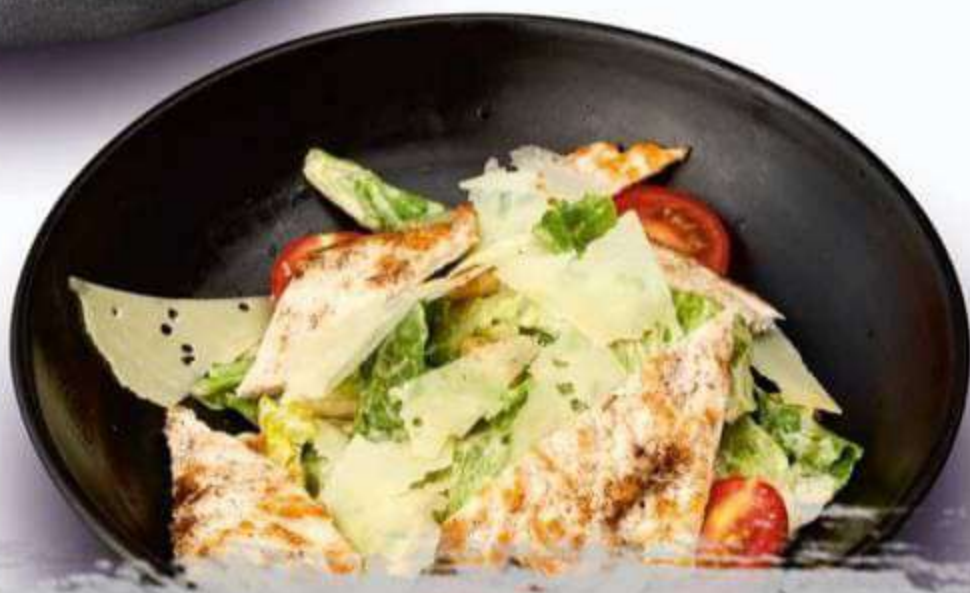
• ЦЕЗАРЬ С КУРИЦЕЙ 180 г / 420 Р