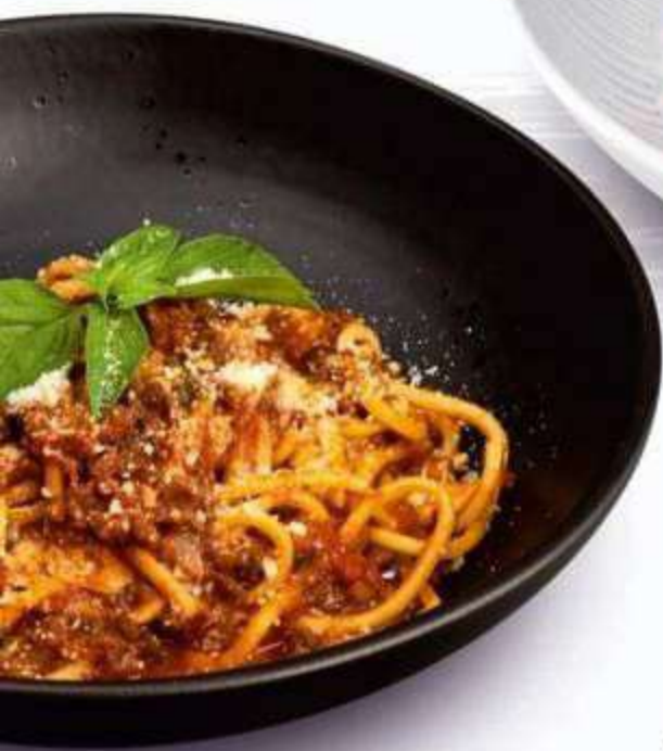
• СПАГЕТТИ БОЛОНЬЕЗЕ 350 г / 580 ₺