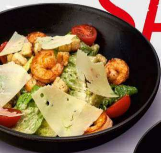
• ЦЕЗАРЬ С КРЕВЕТКАМИ 180 г / 480 Р