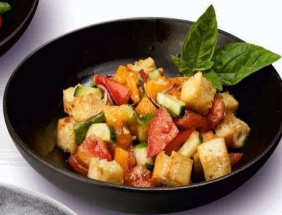
• ПАНЦАНЕЛЛА 320 г / 450 Р