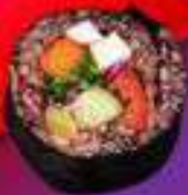
Кимпаб "ЧЕРНЫЙ РИС"

Кимпаб с черным рисом, крабовой палочкой, огурцом, помидором, авокадо, майонезом, кунжутными семечками.