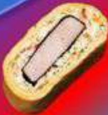
Яичный кимпаб с ветчиной

Яичный кимпаб с ветчиной, огурцом, помидором, авокадо, майонезом, кунжутными семечками.