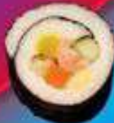
Кимпаб с семгой

Кимпаб с семгой, огурцом, помидором, авокадо, майонезом, кунжутными семечками.