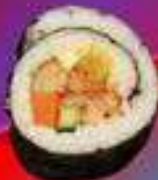
Кимпаб с овощами и кимчи

Кимпаб с говядиной пулякоги, огурцом, помидором, авокадо, майонезом, кунжутными семечками.