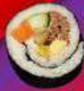
Кимпаб с говядиной пулякоги

Кимпаб с говядиной пулякоги, огурцом, помидором, авокадо, майонезом, кунжутными семечками.