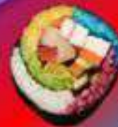
Радужный кимпаб с шиитаке

Кимпаб с говядиной пулякоги, огурцом, помидором, авокадо, майонезом, кунжутными семечками.