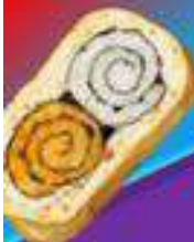
Яичный кимпаб "ДВА РИСА"

Яичный кимпаб с рисом, крабовой палочкой, огурцом, помидором, авокадо, майонезом, кунжутными семечками.