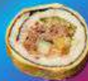
Яичный кимпаб с говядиной пулякоги

Яичный кимпаб с говядиной пулякоги, огурцом, помидором, авокадо, майонезом, кунжутными семечками.