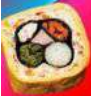
Яичный кимпаб с крабовой палочкой

Яичный кимпаб с крабовой палочкой, огурцом, помидором, авокадо, майонезом, кунжутными семечками.