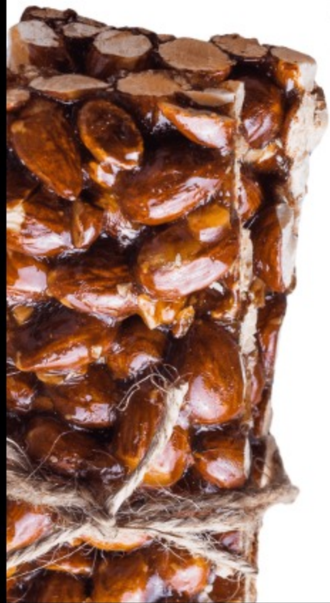
ГРИЛЬЯЖ ФРАНЦУЗСКИЙ, 100 гр

французский десерт из жареных орехов с сахаром, происходит от восточной халвы грубого помола