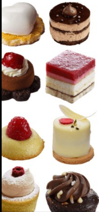
ПТИФУР, 100 гр

птифуры - это французские мини-пирожные из бисквита с различными видами начинок и посыпок, десерты рассчитаны буквально на один укус и прекрасно подойдут ароматному кофе