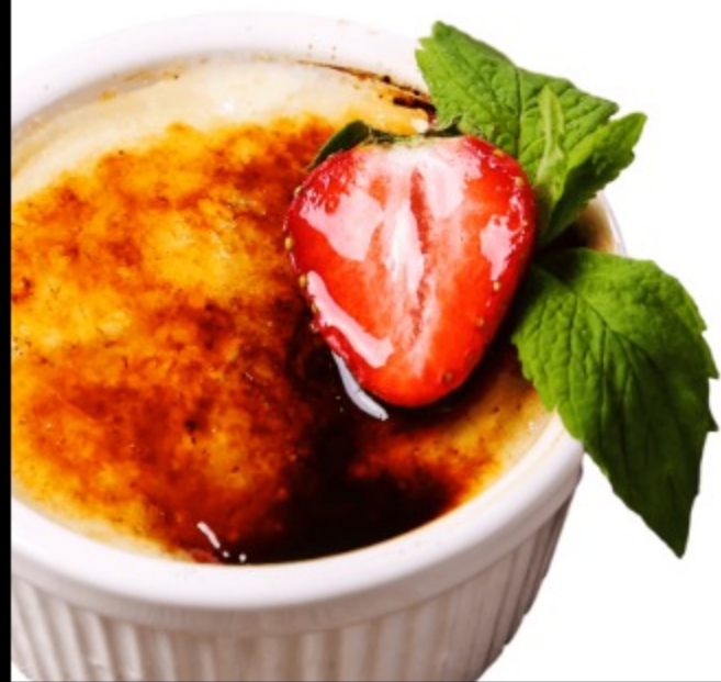
КРЕМ-БРЮЛЕ, 100 гр

помадная начинка с насыщенными нотками карамели во вкусе, бархатистую по вкусу помадку, кремового цвета, покрывает шоколадная глазурь