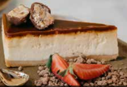
КАРАМЕЛЬНЫЙ ЧИЗКЕЙК Cheesecake with caramel sauce