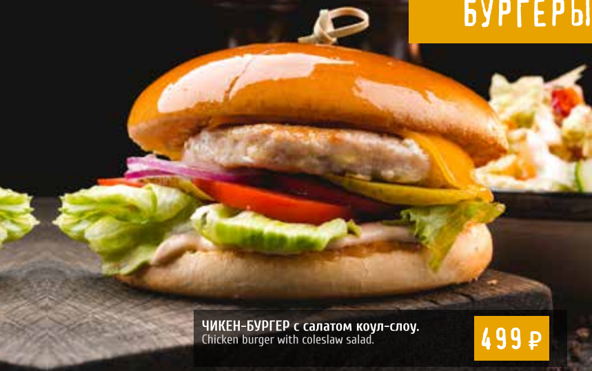
ЧИКЕН-БУРГЕР с салатом коул-слоу. Chicken burger with coleslaw salad.