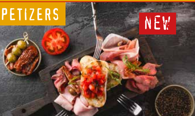
АНТИПАСТА Парма, ростбиф, ветчина, вяленые томаты, тосты. ANTIPASTI Parma, roast beef, ham, sun-dried tomatoes, toasts slices.