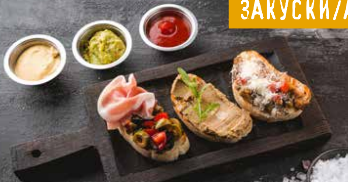
ТРИО БРУСКЕТТ с куриным паштетом, баклажанами, Пармской ветчиной. Trio of bruschetta with chicken pâté, eggplant and Parma ham.