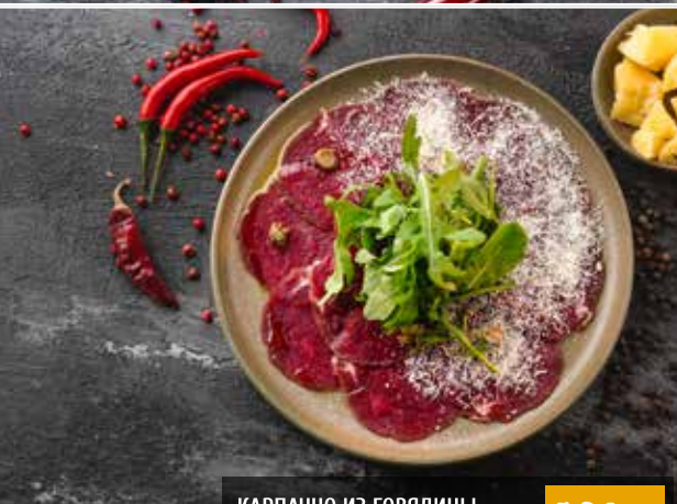
КАРПАЧО ИЗ ГОВЯДИНЫ. Beef carpaccio.