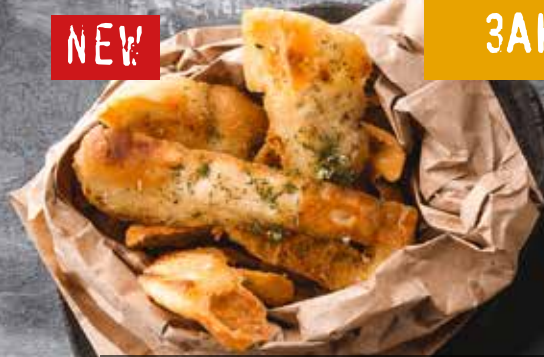
ФОКАЧЧО ФРИТО с чесночным маслом. Focaccia frito with garlic butter.