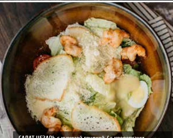
САЛАТ ЦЕЗАРЬ с куриной грудкой / с креветками. Cesar salad with marinated grilled chicken breast / with shrimps.