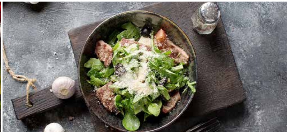
САЛАТ «ИТАЛЬЯНСКИЙ» с нежной говяжьей вырезкой. «Italiano» salad with delicate beef tenderloin.