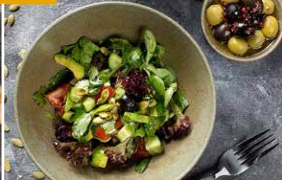
ЗЕЛЕНЬЙ САЛАТ микс салатов, с добавлением огурца, помидоров и авокадо. Green salad made of salad mix, cucumber, tomatoes, and avocado.