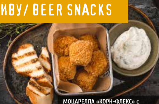
МОЦАРЕЛЛА «КОРН-ФЛЕКС» с чесночно-укропным соусом. Mozzarella cheese with garlic and dill sauce.