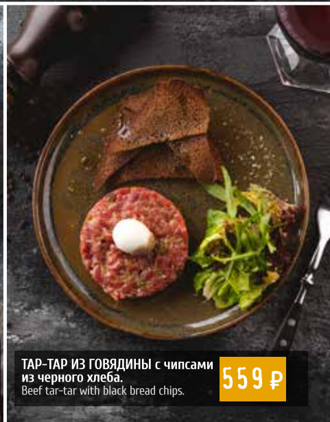
ТАР-ТАР ИЗ ГОВЯДИНЫ с чипсами из черного хлеба. Beef tar-tar with black bread chips.