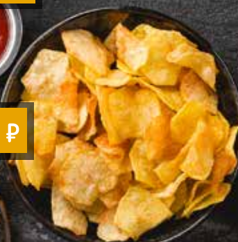
ДОМАШНИЕ ЧИПСЫ ИЗ КАРТОФЕЛЯ. Homemade chips of potato.