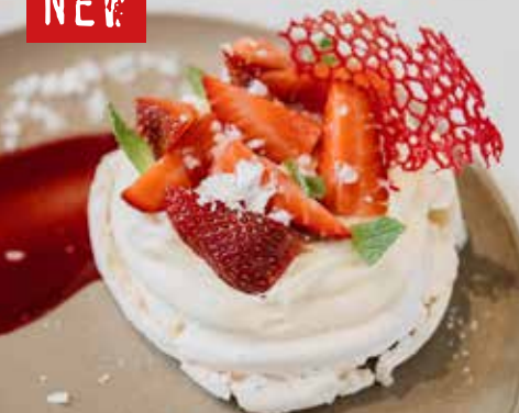
ДЕСЕРТ ПАВЛОВА Pavlov's Dessert