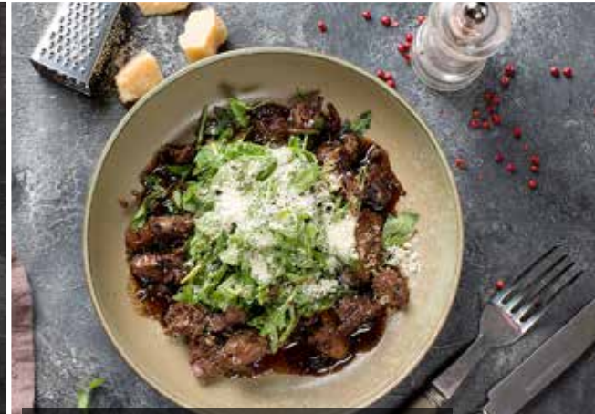
ТЕПЛЫЙ САЛАТ с куриной печенью. Warm mix-salad with chicken liver.