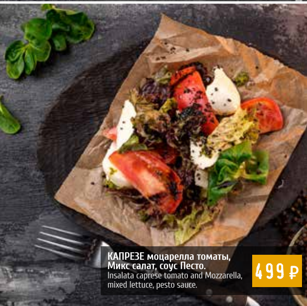
КАПРЕЗЕ моцарелла томаты, Микс салат, соус Песто. Insalata caprese tomato and Mozzarella, mixed lettuce, pesto sauce.