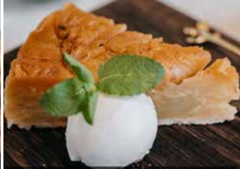
ТАРТ-ТАТЕН ЯБЛОЧНЫЙ с шариком ванильного мороженого