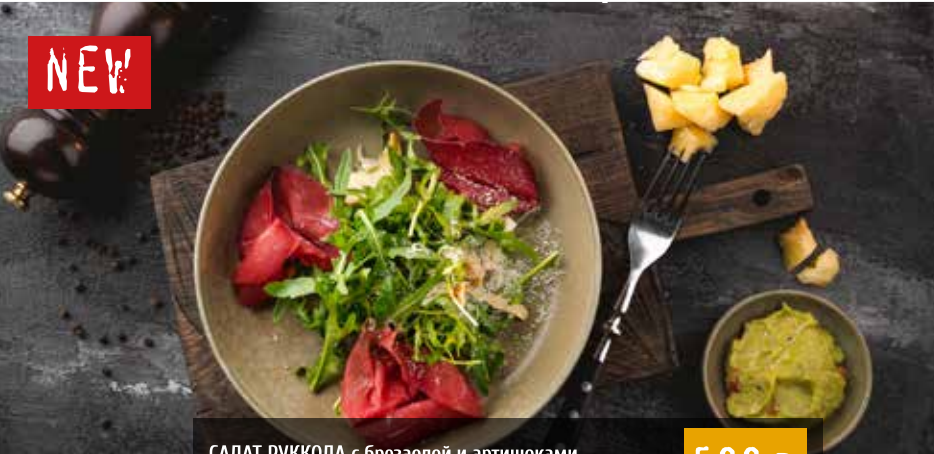
САЛАТ РУККОЛА с брезаолой и артишоками. Arugula salad with bresaola and artichokes.