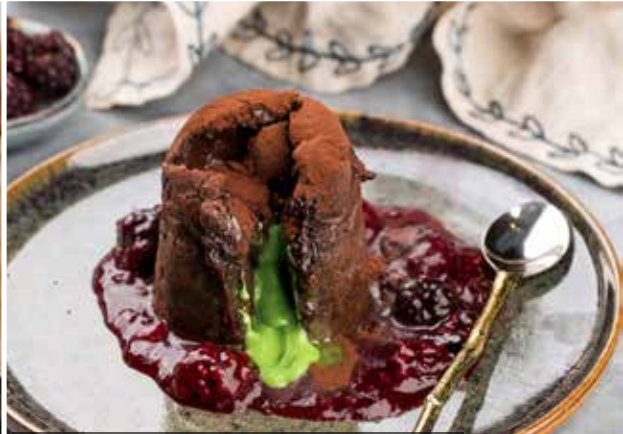
ШОКОЛАДНО-ФИСТАШКОВЫЙ ФОНДАН с ягодным соусом. Chocolate and pistachio fondant with berry sauce.