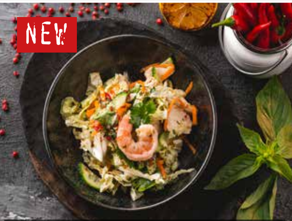
САЛАТ КОУЛ-СЛОУ с куриным филе и креветкой. Coleslaw salad with chicken fillet and shrimp.