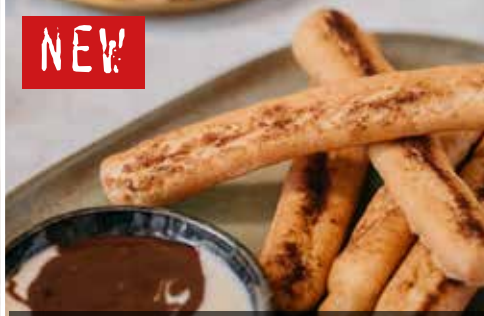
«LADY FINGER» мини-эклеры