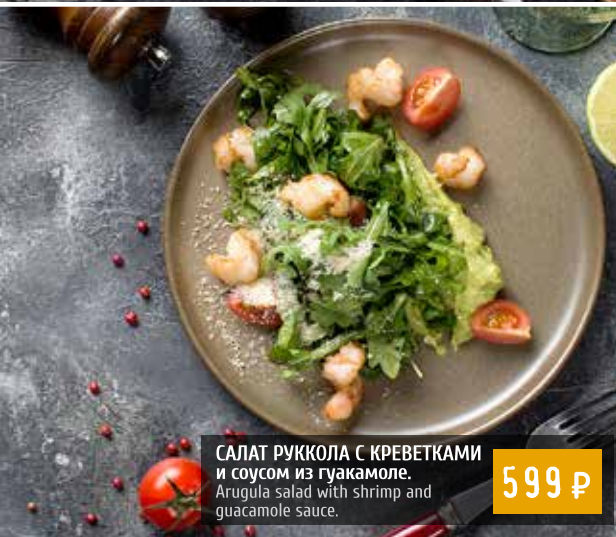
САЛАТ РУККОЛА С КРЕВЕТКАМИ и соусом из гуакамоле. Arugula salad with shrimp and guacamole sauce.