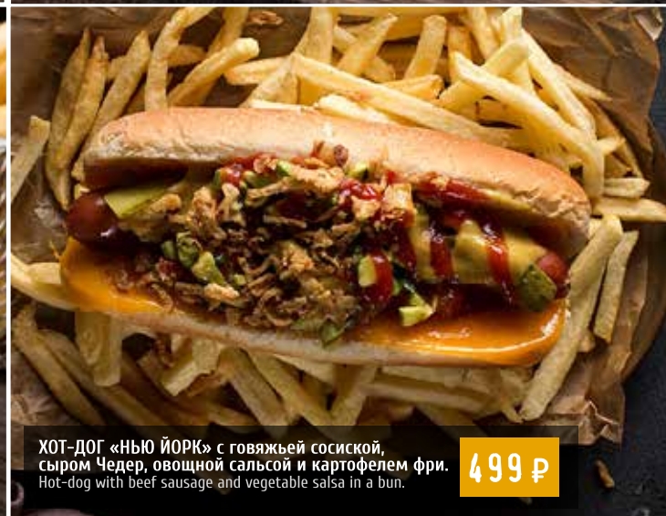
ХОТ-ДОГ «НЬЮ ЙОРК» с говяжьей сосиской, сыром Чедер, овощной сальсой и картофелем фри. Hot-dog with beef sausage and vegetable salsa in a bun.