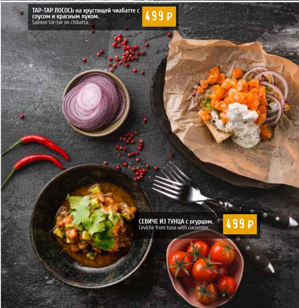
СЕВИЧЕ ИЗ ТУНЦА с огурцом. Ceviche from tuna with cucumber.