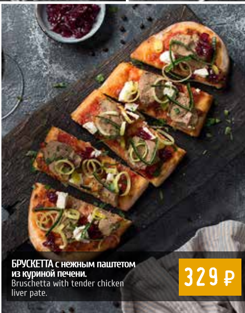
БРУСКЕТТА с нежным паштетом из куриной печени. Bruschetta with tender chicken liver pate.