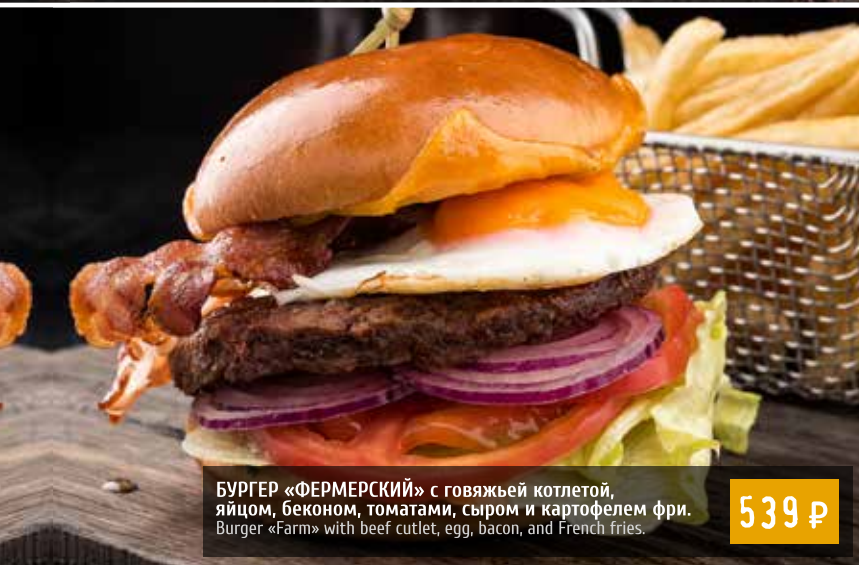
БУРГЕР «ФЕРМЕРСКИЙ» с говяжьей котлетой, яйцом, беконом, томатами, сыром и картофелем фри. Burger «Farm» with beef cutlet, egg, bacon, and French fries.