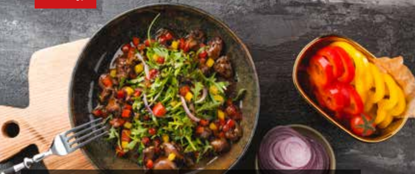
ТЕПЛЫЙ САЛАТ с куриными потрошками и печеным болгарским перцем. Warm salad with chicken liver, pluck and roasted peppers.