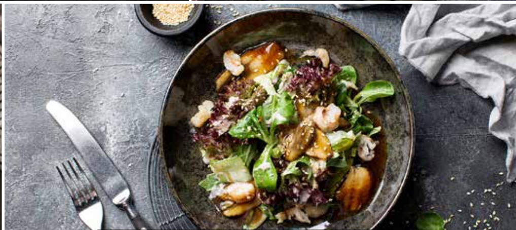
САЛАТ С КОПЧЕНЫМ УГРЕМ , креветками и сочными листьями салата в йогуртовом соусе. Salad with smoked eel, mix-salad and a light yogurt sauce.