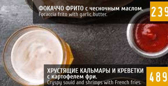
ХРУСТЯЩИЕ КАЛЬМАРЫ И КРЕВЕТКИ с картофелем фри. Crispy squid and shrimps with French fries.