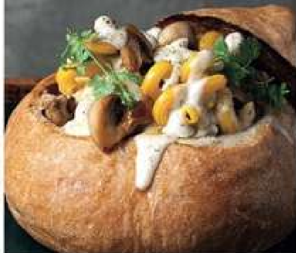
Паста с грибами