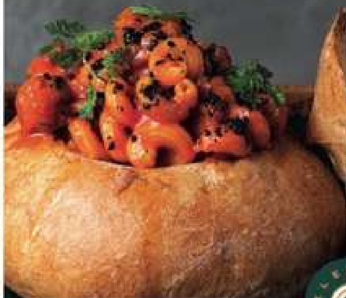
Паста с креветками и водкой