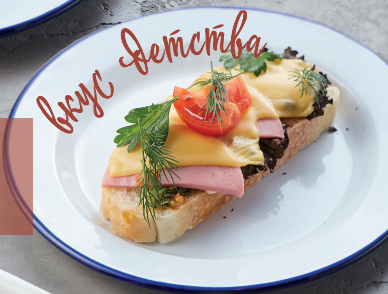
БУТЕРБРОД С КОЛБАСОЙ И СЫРОМ HAM SANDWICH AND CHEESE 140 руб.