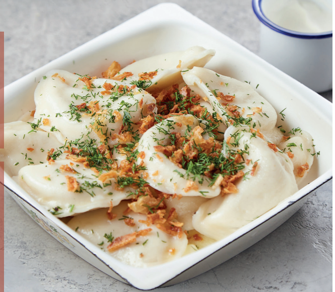
ВАРЕНИКИ С ТВОРОГОМ И ЕЖЕВИЧНЫМ ВАРЕНЬЕМ DUMPLINGS WITH COTTAGE CHEESE AND JAM 350 руб