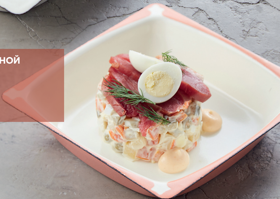
ОЛИВЬЕ С КОПЧЕНОЙ УТКОЙ OLIVIER WITH SMOKED DUCK 190 руб.