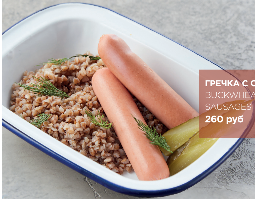
ГРЕЧКА С СОСИСКАМИ BUCKWHEAT WITH SAUSAGES 260 руб