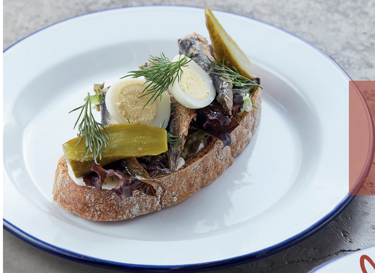
БУТЕРБРОД СО ШПРОТАМИ НА ЗУБОК SANDWICH WITH SPRATS 130 руб.