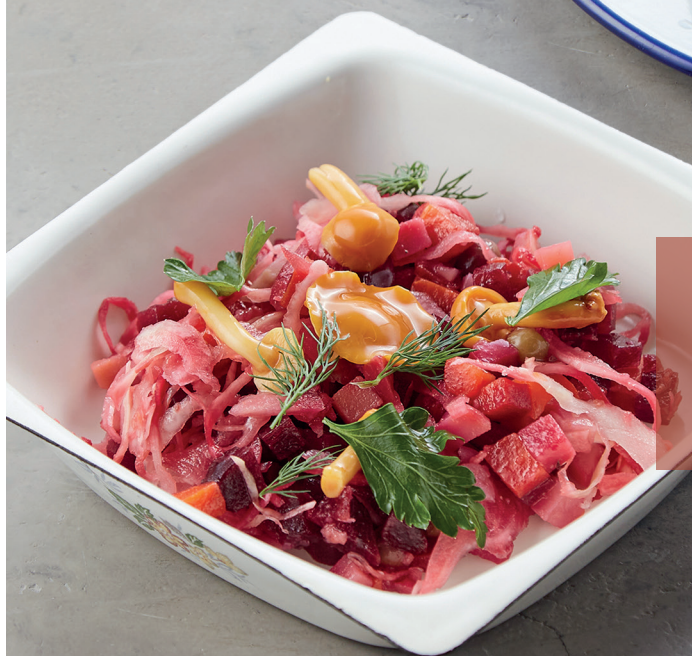
ВИНЕГРЕТ С ОПЯТАМИ VINAIGRETTE WITH EXPERIMENTS 150 руб.