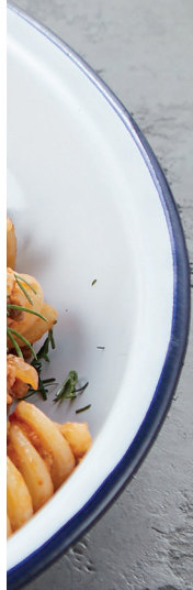
ЖАРКОЕ СО СВИНИНОЙ ROAST WITH PORK 190 руб