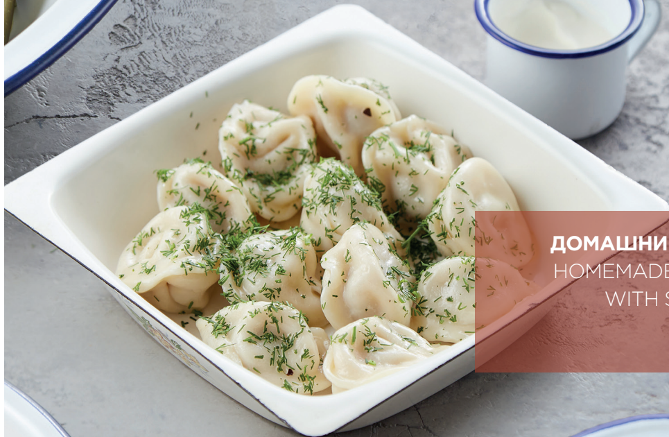
ДОМАШНИЕ ПЕЛЬМЕНИ HOMEMADE DUMPLINGS WITH SOUR CREAM 260 руб