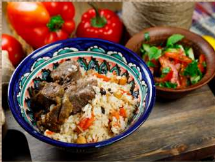
Плов по-Узбекски Uzbek pilaf 350/50гр. 350 P