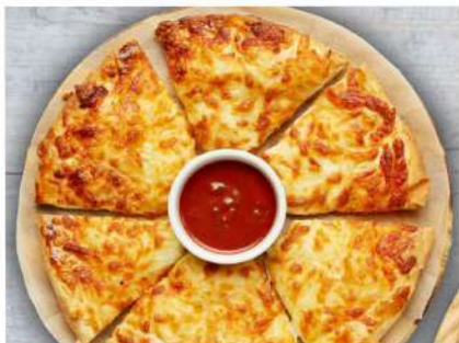
Хачапури по-Мегрельски традиционный круглый пирог с начинкой и запечённым до золотистой корочки сыром Сулугуни сверху 500гр. 380 P 300гр. 250 P Megrelian Khachapoori