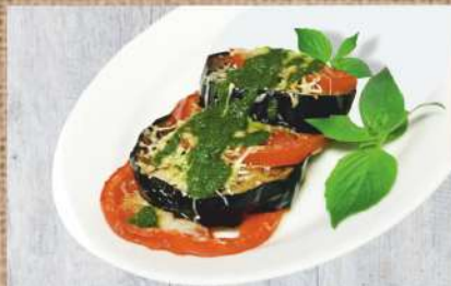
Баклажаны на гриле с сыром Сулугуни и соусом Песто 330 P Grilled eggplants with 200ер. Suluguni cheese & Pesto sauce