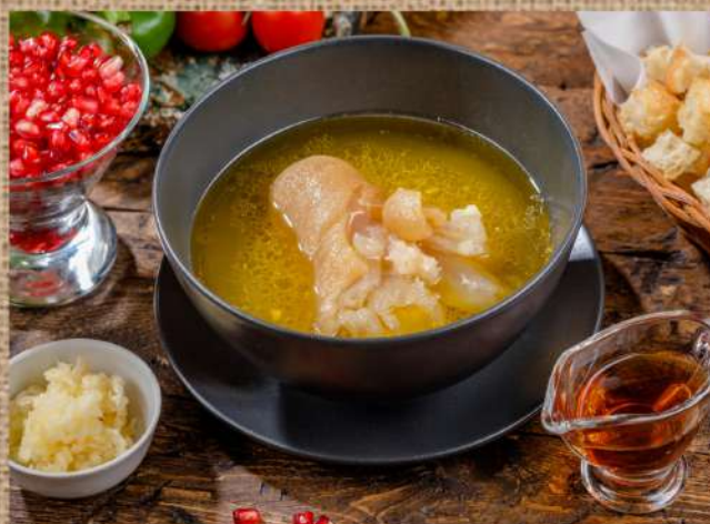
Хаш Говяжьи ножки, рубец, подаётся с чесноком и виноградным уксусом