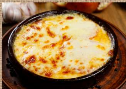
Запечённый сыр Сулугуни 290 P с помидорами 250ер. Baked Suluguni