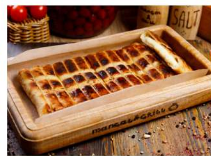
Хачапури на мангале Grilled Khachapoori 400гр. 360 P