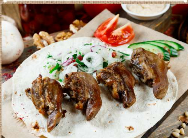
Язык ягнёнка на мангале