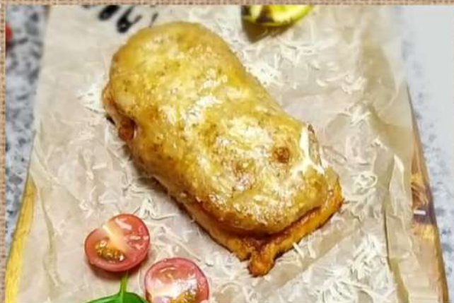
Лосось запечённый с сыром Dorado with grilled vegetables