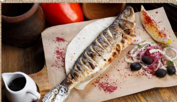
Сибас на мангале Grilled seabass