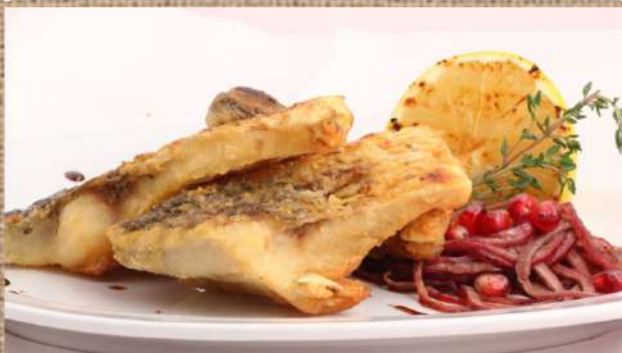
Карп на мангале по-Грузински Carp on the grill in Georgian