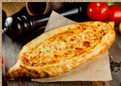
Пицца с мясом ягнёнка в томатном соусе с сыром 470 P National cake 500ер.