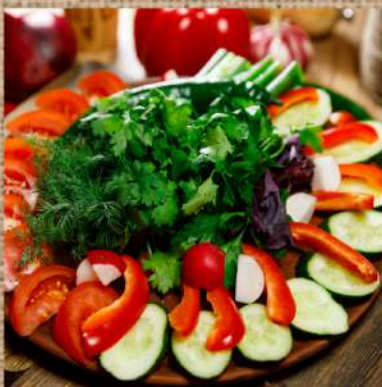
Свежие овощи с зеленью 370 P свежие помидоры, огурцы, ассорти зелени, редис 350гр. Fresh vegetables with greens