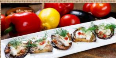
Баклажаны с чесночным соусом по-грузински 280 P Eggplant with garlic sauce in Georgian 200гр.