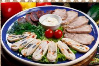
Мясное ассорти 470 P телячий язык, бастурма, куриный рулет 250/30гр.