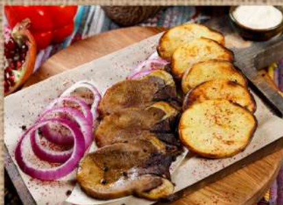
Говяжий язык на мангале с картофелем на углях 390 P Beef tongue on the grill 160/150/30 with potatoes on the coals