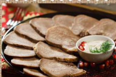
Телячий отварной язык 340 P Boiled veal tongue 160/30гр.