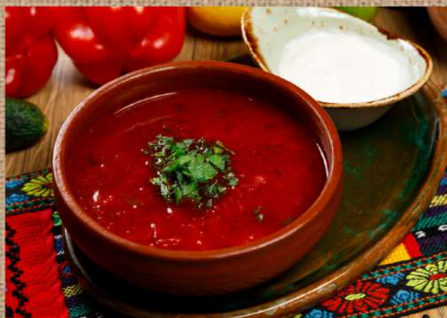
Борщ домашний подаётся со сметаной Home made Borsch (Russian beetroot soup)