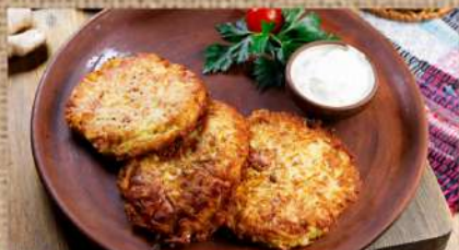
Драники картофельные 200 P Draniki (potato cakes) 250ер. Драники картофельные с беконом и соусом Тар-тар 290 P Draniki (potato cakes) 250ер. with bacon and Tar-Tar sauce