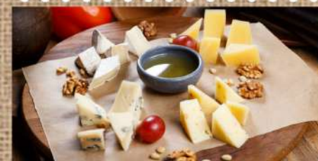
Европейские сыры с мёдом и кедровым орехом 450 P Assorted European Cheeses 180/50гр.