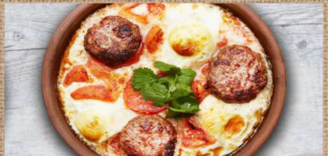
Тава кебаб с сыром 390 P 400гр. Tava kebab with suluguni cheese Тава кебаб с яйцом 340 P 400гр. Tava kebab with egg