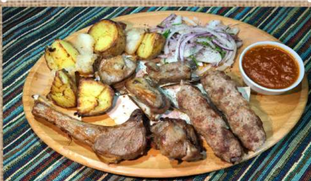
Ассорти из ягнёнка на 1 персону каре ягнёнка 1 шт., мякоть 1 шт., люля кебаб 1 шт., рёбрышки 3 шт., картофель с курдюком 200 гр. Assorted lamb for 1 person 590 P