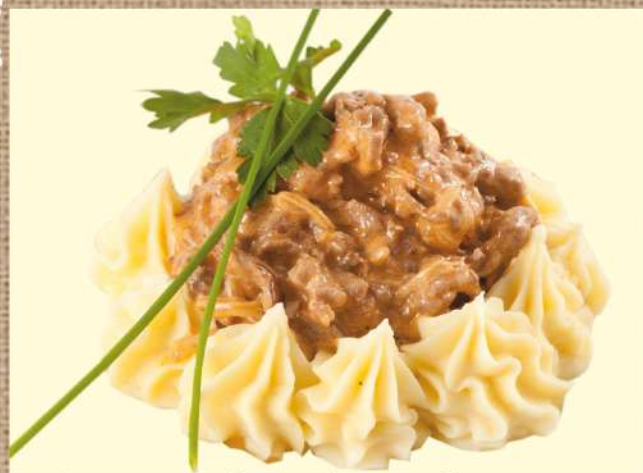
Бефстроганов из говяжьей вырезки с грибами и картофельным пюре Beef stroganoff from beef tenderloin with mushrooms and mashed potatoes