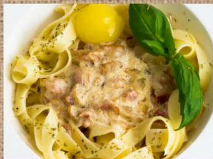
Феттучини карбонара Fettuccine carbonara 300гр. 340 P