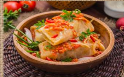
Голубцы с мясом Golubtsy (stuffer cabbage rolls) with meat 320гр. 360 P