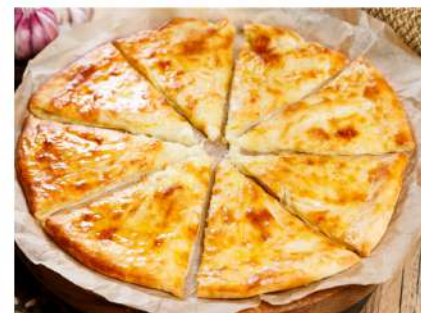
Хачапури по-Имеретински круглый закрытый пирог с начинкой из сыра Сулугуни и Имеретинского сыра 400гр. 310 P Imeretinsky khachapuri