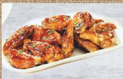
Куриные крылышки в соусе терияки 290 P Chicken wings 200ер. in teriyaki sauce