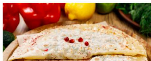
Кутаб Qutab Готовится на саже без масла 1шт. 130 P с сыром cheese 180 P с ягнёнком lamb 130 P с картофелем potatoes 130 P с зеленью greens