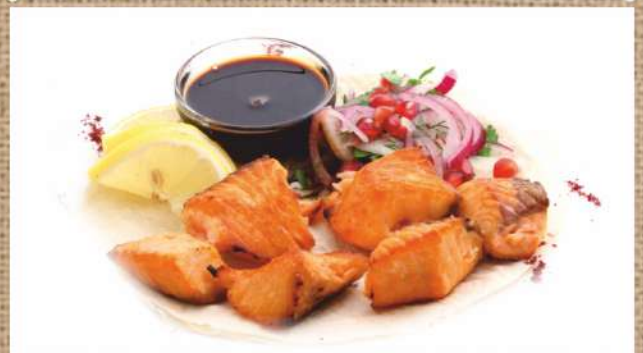
Шашлык из лосося Salmon Shashlik