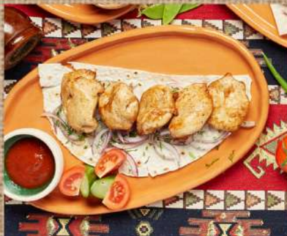
Шашлык из филе индейки