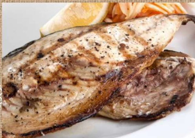
Скумбрия на гриле Grilled mackerel