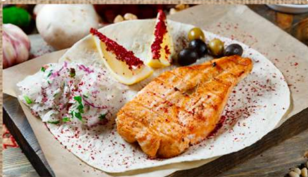
Стейк лосося Salmon steak