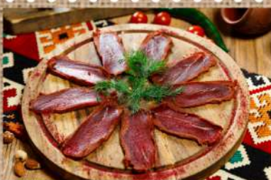
Говяжья бастурма 250 P Veal Basturma 100гр.