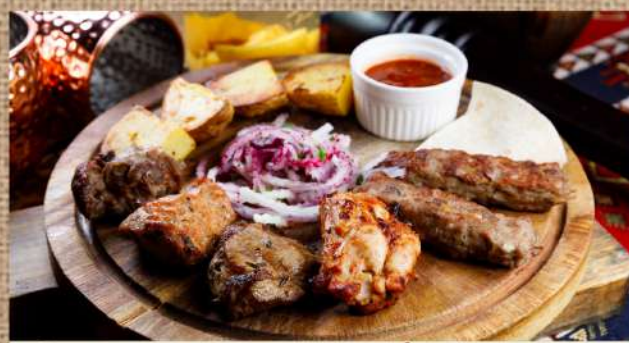
Ассорти из 5 шашлыков на 1 персону выдержанный в особом маринаде по одному кусочку: свинья шея, мякоть ягнёнка, телячья мякоть, курица, люля-кебаб ягнёнка 2 шт, подаётся с соусом шашлычным на тонком лаваше с картофелем Assorted 5 shashlik for 1 person 590 P