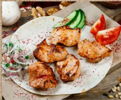
Шашлык из куриного филе