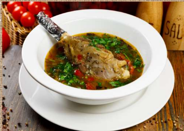
Буглама с овощами голень ягнёнка с овощами Buglama with vegetables