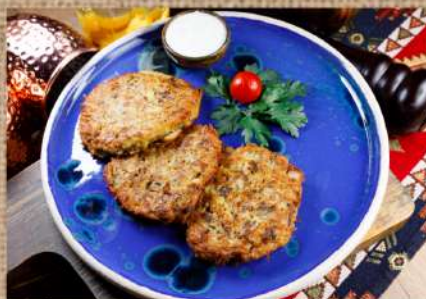
Драники картофельные с грибами и соусом Тар-тар 250 P Draniki (potato cakes) 200ер. with mushrooms and Tar-Tar sauce