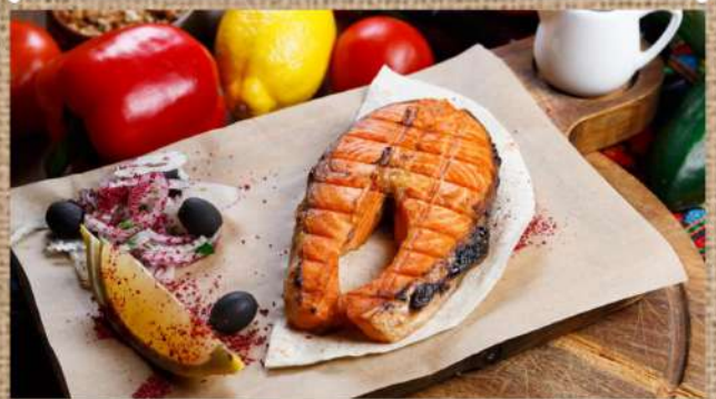
Шашлык из форели Trout Shashlik