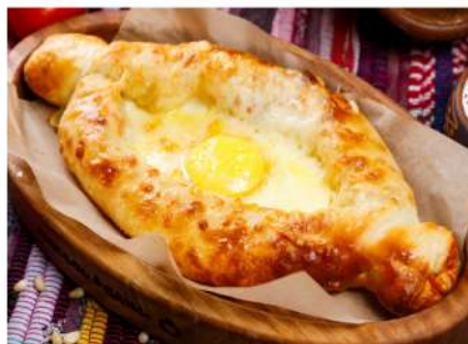
Хачапури по-Аджарски открытый пирог с начинкой из сыра Сулугуни, слегка запечённым куриным яйцом и маслом 400гр. 350 P Adjarian Khachapoori