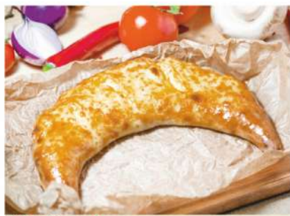
Хачапури по-Гурийски Закрытый пирог в форме полумесяца с отварным яйцом и сыром 450гр. 360 P Gurian Khachapoori