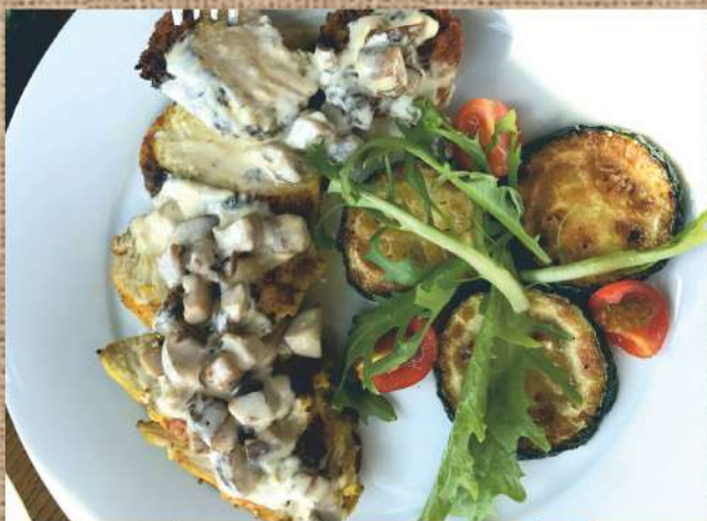
Куриное филе с жюльеном из грибов в сливочном соусе и жареным цукини Chicken fillet with mushroom julienne in a creamy sauce with roasted zucchini