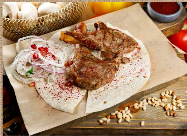
Телятина (антрекот) Veal (entrecote) 550 P 200/30/30гр.