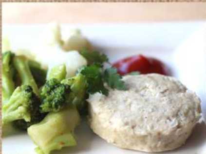
Куриные котлеты на пару с овощами Steamed Chicken Cutlets 180/100гр. 350 P