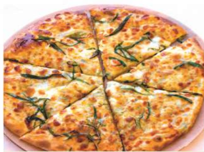
Хачапури с тархуном Khachapuri with tarragon 450гр. 400 P