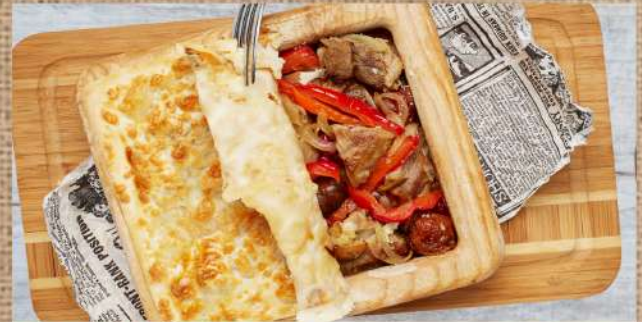
Тахта говурма с авторской подачей Author's Govurma баранина 550 P 400гр. телятина 490 P 400гр. курица 390 P 400гр.