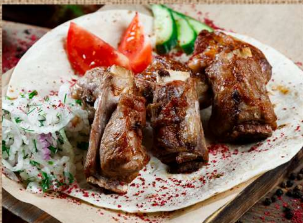
Шашлык «телячьи рёбрышки» Shashlik "veal ribs» 380 P 200/30/30гр.