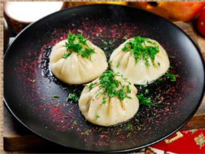
Манты из баранины Lamb manti 3шт/50гр. 290 P