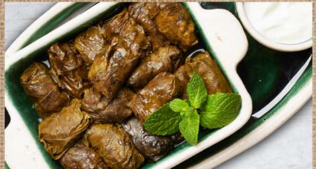
Долма в виноградных листьях 350 P 220гр. Dolma (stuffed grape leaves rolls with minced meat and rice)