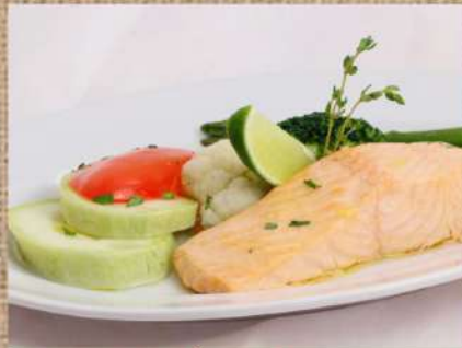
Лосось с овощами на пару Steamed salmon with vegetables 200/150гр. 550 P