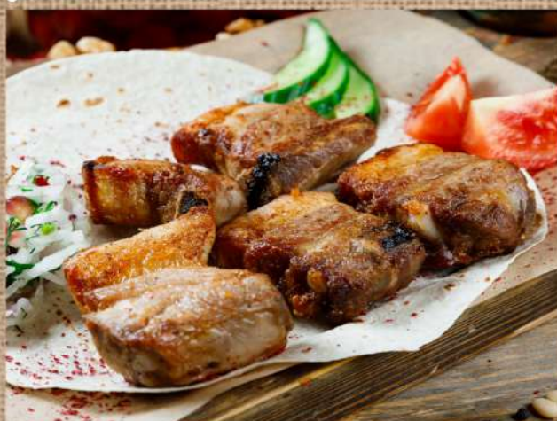
Свинина на ребре