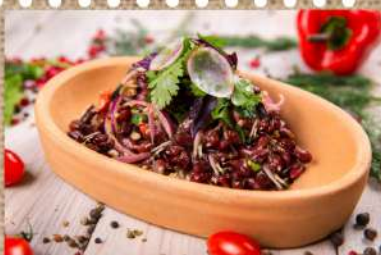
Лобьо с грецким орехом 250 P Lobio with walnut 200гр.