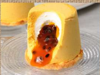
Манго-Маракуйя Mango - Passion fruit