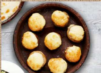
Шампиньоны, запечённые с сыром 340 P Baked shampignons 200ер. with suluguni cheese