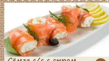
Сёмга с/с с сыром Филадельфия 490 P Light salted salmon with Philadelphia cheese 150гр.