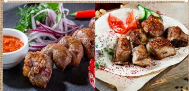
Шашлык из бараньих почек