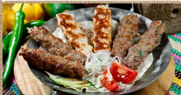
Ассорти из 3 люля-кебаб на 1 персону 3 вида традиционных кебабов из ягнёнка, телятины, курицы подаётся с шашлычным соусом, репчатый луком на тонком лаваше Assorted 3 lula-kebabs for 1 person 680 P