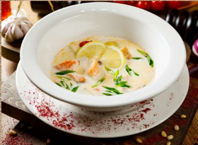
Уха по-Фински на сливках Fish soup in Finnish with cream