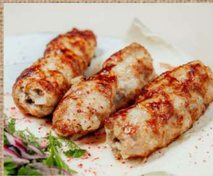
Люля-кебаб из курицы