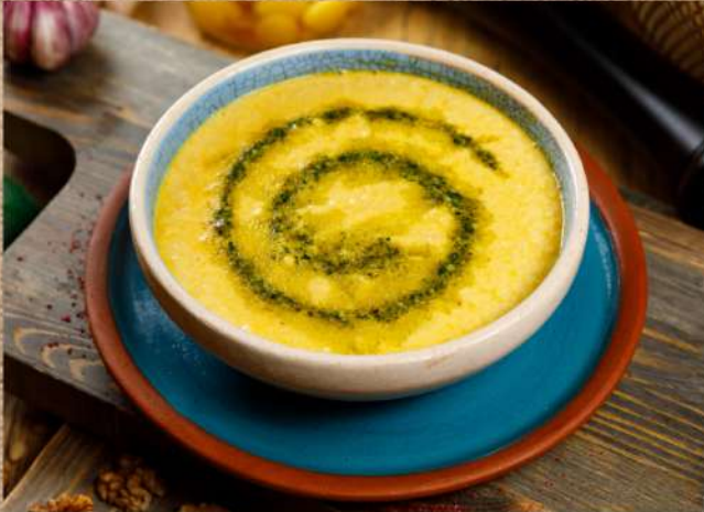
Крем-суп из лосося с соусом Песто Salmon cream soup with Pesto sauce