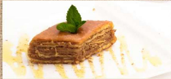
Пахлава с грецким орехом и карамельным соусом Pakhlava