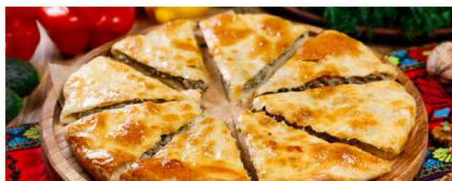
Кубдари Сочный домашний пирог с мясом на выбор и ароматными специями, лук репчатый, Сулугуни 500гр. 410 P свинина pork 480 P ягнёнок lamb 460 P телятина veal