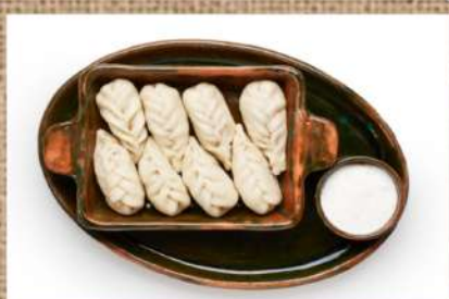
Гюрза из баранины (домашние пельмени) 340 P Lamb Gyurza 200ер. (homemade dumplings)