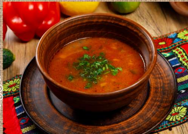
Харчо из телятины Caucasian soup Kharcho with veal