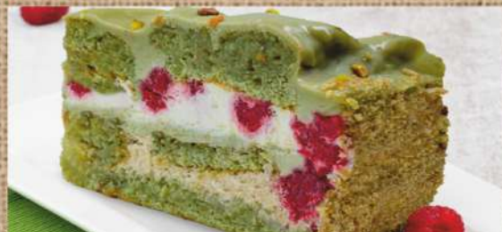
Фисташковый торт Pistachio cake