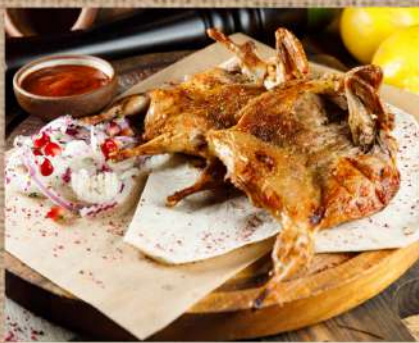
Перепелка на мангале