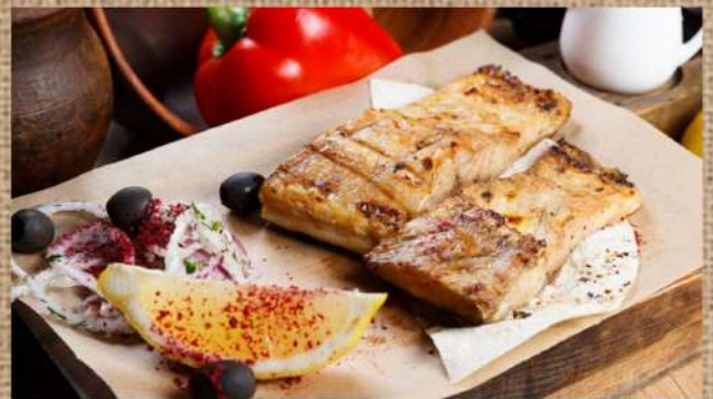
Шашлык из филе судака Zander fillet Shashlik