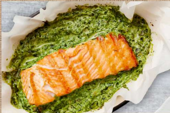
Лосось со шпинатом в фольге Salmon with spinach in foil