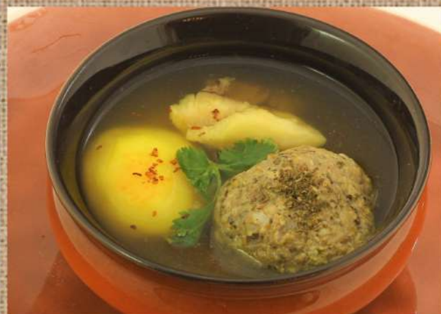
Кюфта Бозбаш Kyufta Bosbash (Caucasian soup with meat rissole)