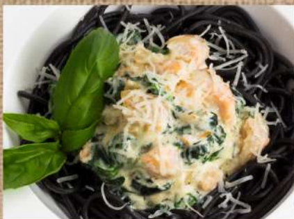
Чёрные спагетти с лососем и шпинатом Black Spaghetti with Salmon with Spinach 300гр. 390 P