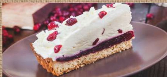
Брусничный пирог с белым шоколадом Lingonberry cake