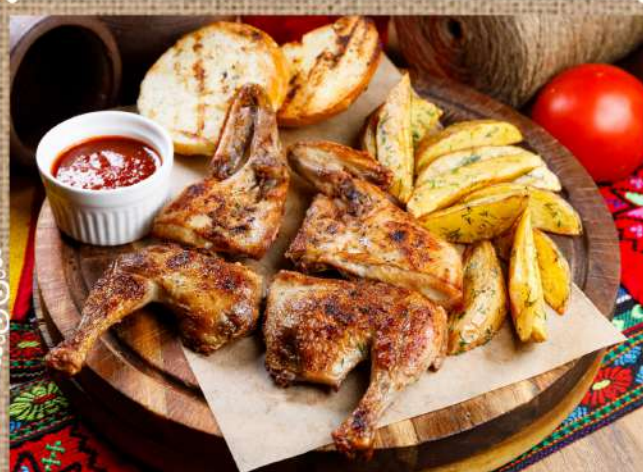
Цыплёнок по-Гальски подаётся с картофелем по-деревенски, чесночной лепёшкой на мангале и соусом Ткемали Baked chicken with potatoes