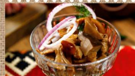
Ассорти из маринованных грибов 240 P Assorted Pickled Mushrooms 180гр.