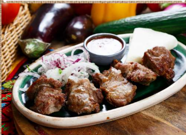
Шашлык из мякоти ягнёнка