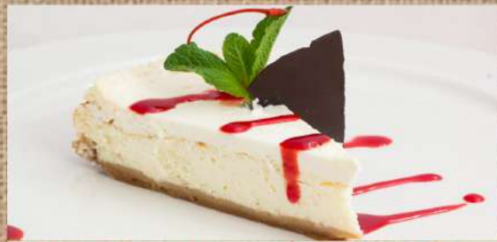
Чизкейк «New York» Cheesecake «New York»