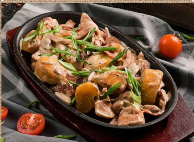
Телятина с грибами и сливочным соусом Veal with mushrooms and cream sauce