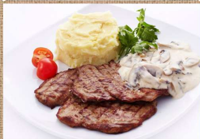
Лангет из говядины подаётся с картофельным пюре и сливочным соусом с грибами Beef Langet