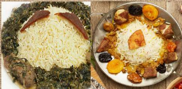
Плов со шпинатом и телятиной 420 P 350гр. Sabzi pilaf with veal (pilaf with green stuff and veal) Плов с бараниной сухофруктами 390 P 350гр. Pilaf with lamb dried fruits