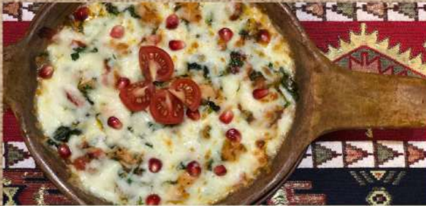
Чыгуртма из куриного филе с сыром 390 P 400гр. Chygurtma from chicken fillet with Suluguni cheese Чыгуртма из куриного филе с яйцом 330 P 400гр. Chygurtma chicken fillet with egg