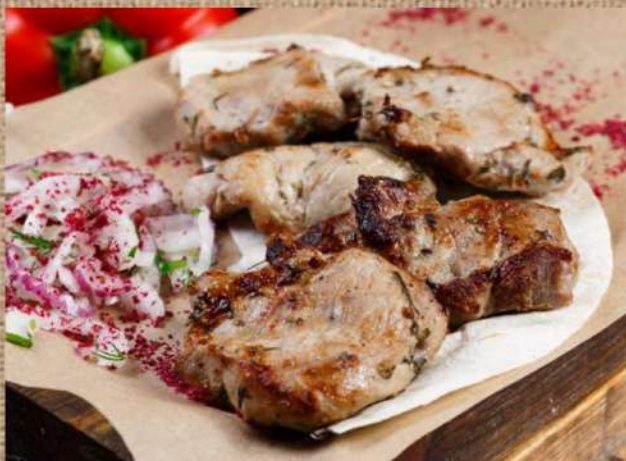
Шашлык из мякоти телятины Veal shashlik 460 P 200/30/30гр.