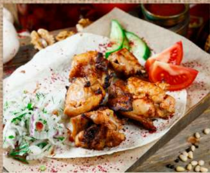
Шашлык из курицы