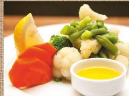
Овощи на пару Steamed vegetables 300/30гр. 290 P