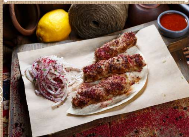
Люля-кебаб из ягнёнка