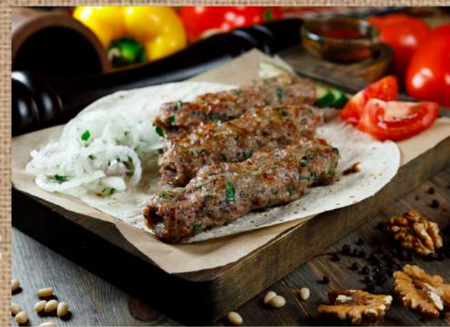
Люля-кебаб из телятины Veal lulya-kebab (minced meat) 360 P 200/30/30гр.