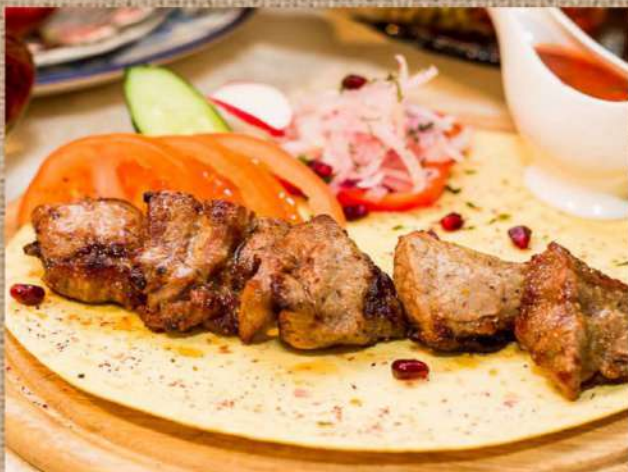
Шашлык из свиной шейки