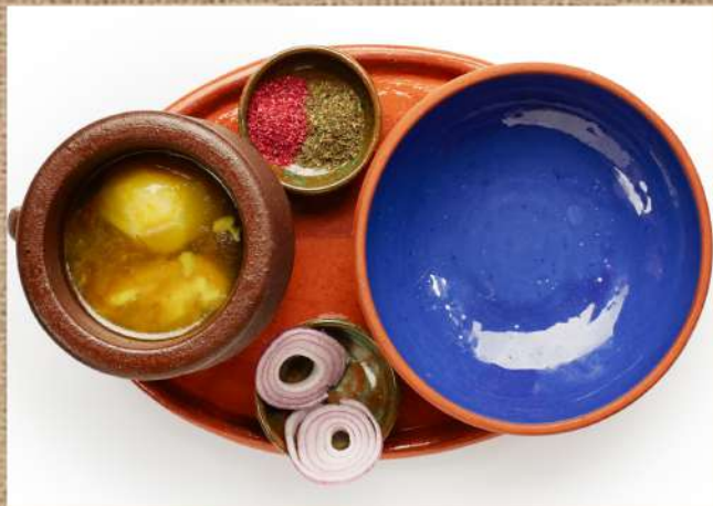
Пити из баранины суп из ягнёнка, нута и картофеля Piti with mutton