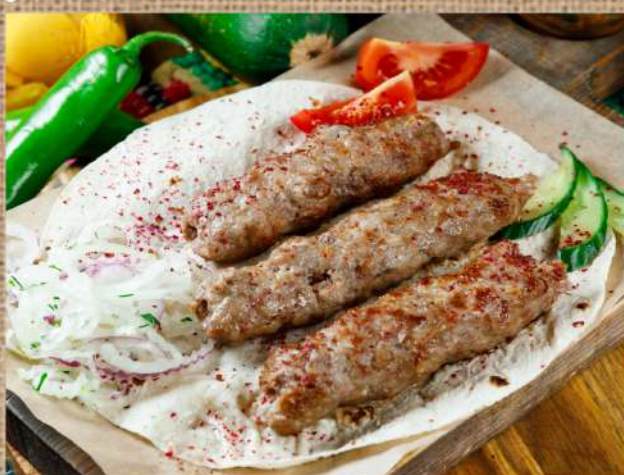
Люля-кебаб из свинины