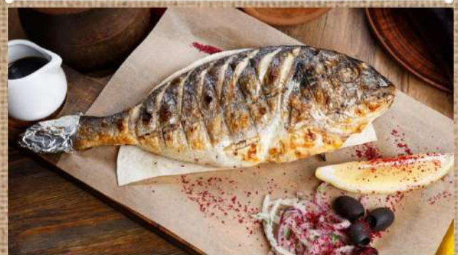
Дорадо на мангале Dorado on the grill