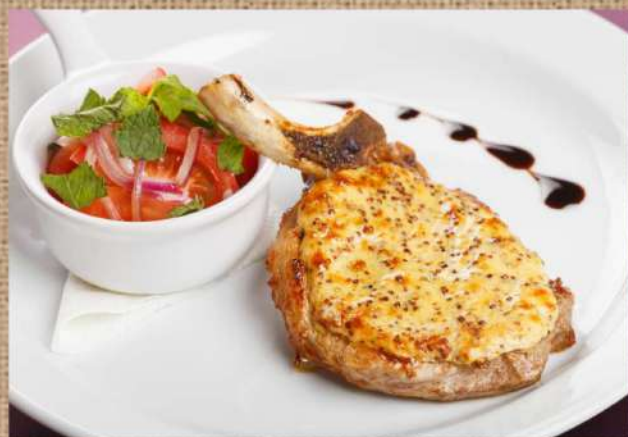
Свиная корейка под грибным соусом