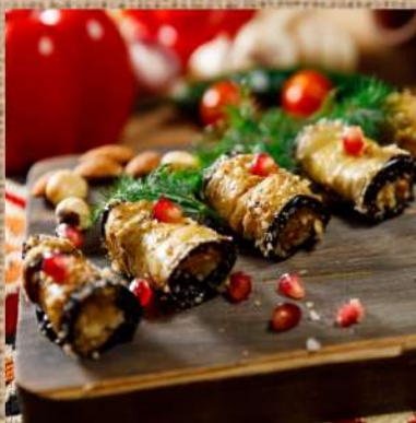
Баклажаны по-Хански 340 P рулеты из обжаренных баклажанов с сырной начинкой и грецким орехом 5шт. Stuffed eggplant rolls