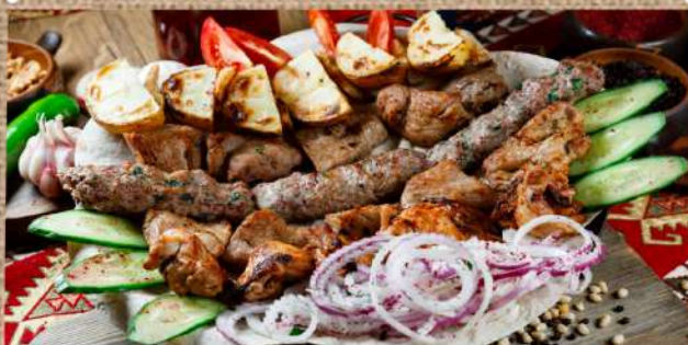
Ассорти из шашлыков на 3 персоны свинья шея, курица, телячья мякоть, люля ягнёнка, картофель с курдюком с соусом шашлычным, Тар-Тар на тонком лаваше Assorted shashlik for 3 persons 1650 P