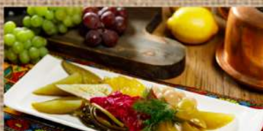
Домашние соленья 250 P Homemade pickles 250гр.