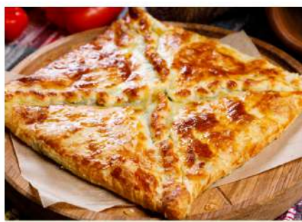
Хачапури слоёный с сыром Сулугуни Puff khachapoori with Suluguni cheese 450гр. 330 P