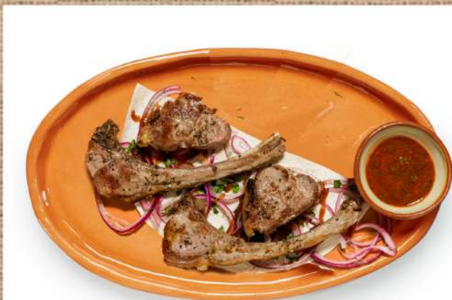
Шашлык по-азербайджански (каре ягнёнка)