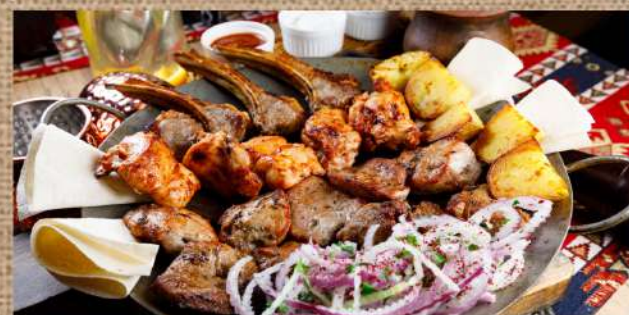
«Хочу Шашлык» мясной свинья шея, курица, телячья мякоть, каре ягнёнка, картофель на мангале, соус томатный, Ткемали, Тар-Тар, лаваш тонкий, лук репчатый «I want a shashlik" meat 1890 P