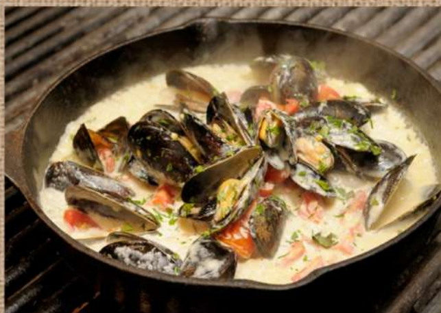
Мидии в створках в сливочном соусе Mussels in the valves in creamy sauce