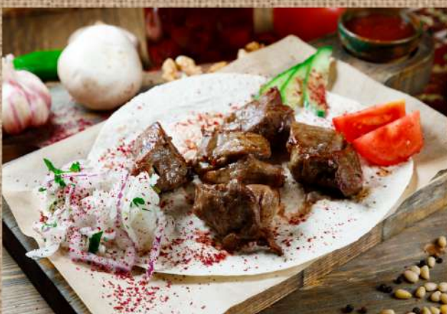
Шашлык говяжья вырезка 490 P 200гр. Shish kebab beef tenderloin