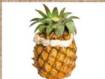
Мороженое в ананасе Ice Cream in Pineapple