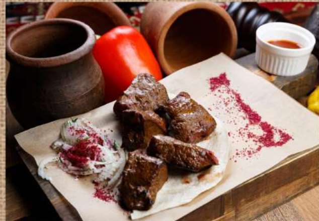
Печень говяжья 290 P 200гр. Beef liver shashlik