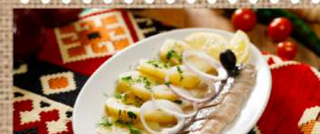
Филе сельди с картофелем 250 P Herring fillet 300гр.