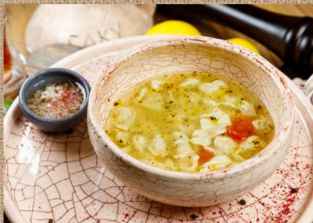
Дюшбара восточный суп с пельменями Dushbara (soup with small dumplings)