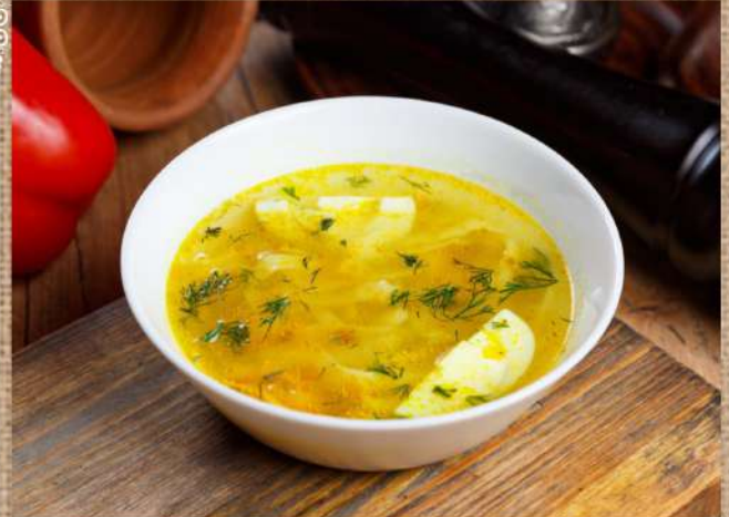
Куриный суп с домашней лапшой Chicken soup with home made noodles