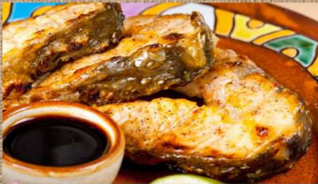
Осетрина на мангале Grilled sturgeon