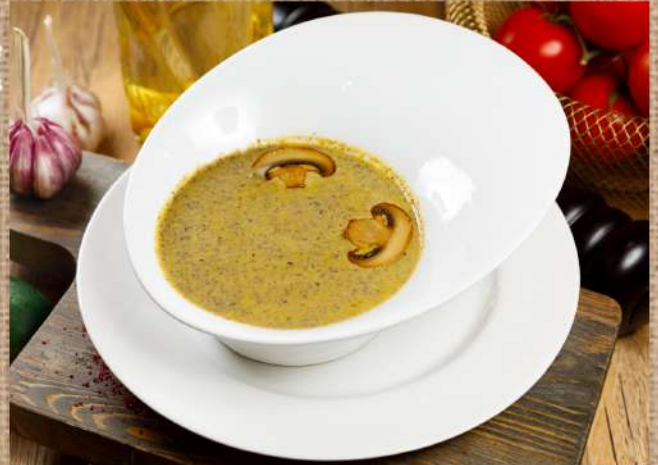
Крем-суп грибной Mushroom Cream-Soup