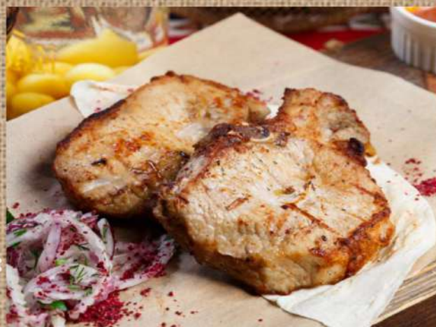
Шашлык из свиной корейки