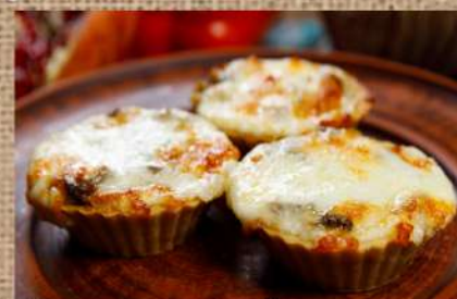
Жюльен куриный 260 P запечённый в тарталетках 3 шт. Chicken julien Жюльен грибной 260 P запечённый в тарталетках 3 шт. Mushroom julien