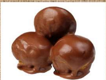
Профитроли в шоколадном соусе Profiteroles