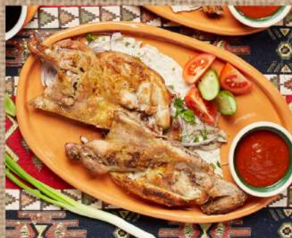
Шашлык из цыплёнка