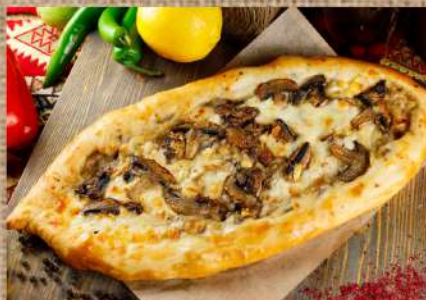
Пицца с шампиньонами, овощами и сыром 390 P Pizza with champignons 500ер. and vegetables