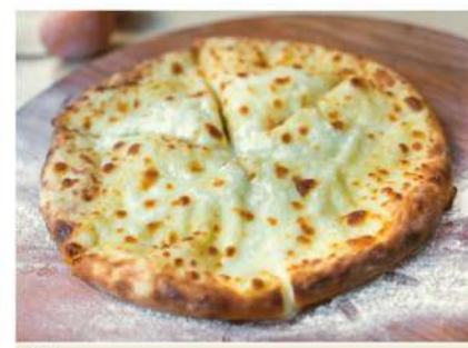
Хачапури тёти Нины Круглый открытый пирог с сыром Сулугуни, взбитыми яйцами и сливками 500гр. 350 P Khachapoori of aunt Nino