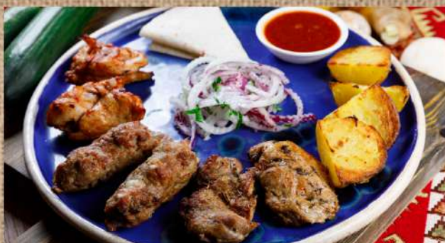
Ассорти из 3 шашлыков на 1 персону по два кусочка: шашлык свинья шея, люля ягнёнка, курица, подаётся с соусом шашлычным на тонком лаваше с картофелем Assorted 3 shashlik for 1 person 540 P