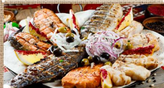
«Хочу Шашлык» рыбный дорадо, судак, лосось, судак, карп, форель, овощи на мангале, соус тар-та подаётся с гранатовым соусом, репчатый луком на тонком лаваше «I want a shashlik" fish 3490 P