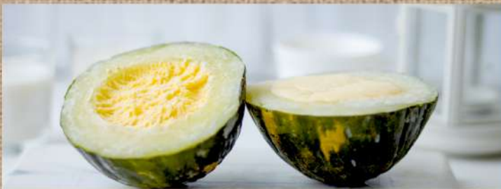
Мороженое в дыне Ice Cream in melon