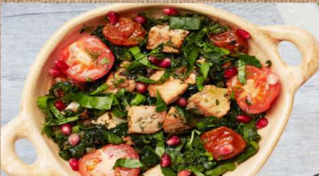
Сырдак из судака 490 P 300гр. Syrdak (zander in oriental style)