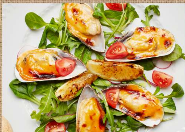
Мидии запечённые Чилийские Baked mussels