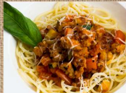
Спагетти болоньезе Spaghetti bolognese 300гр. 320 P