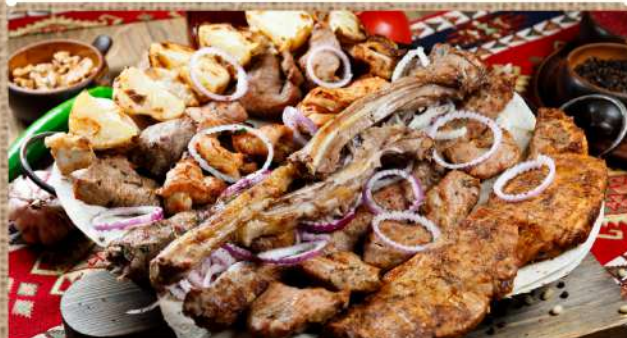
Ассорти из шашлыков на 5 персон каре ягнёнка, свиные рёбра, свинья корейка, люля телятина, люля ягнёнка, куриный шашлык, свиная шея подаётся с соусом шашлычным, Тар-тар, Наршараб на тонком лаваше Assorted shashlik for 5 persons 2690 P