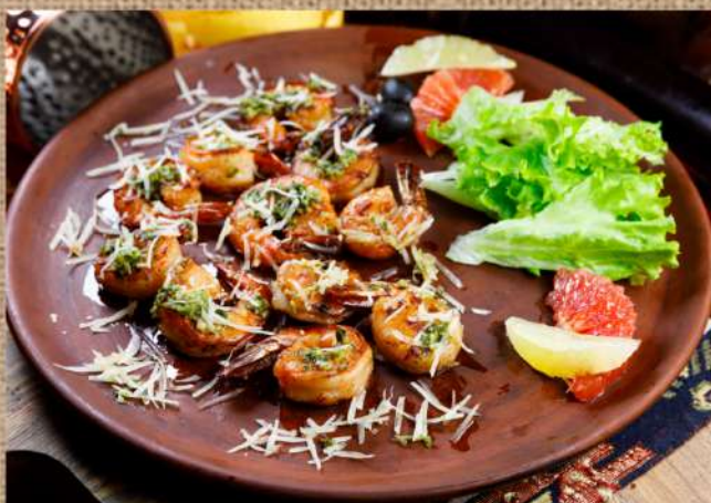
Креветки на гриле с соусом Песто и Пармезаном Grilled prawns with Pesto sauce and Parmesan