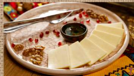
Сыр Сулугуни с мёдом 280 P Suluguni cheese with honey 150/50гр.