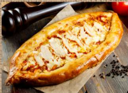
Пицца с куриным филе, сыром и овощами 420 P Pizza with chicken fillet 500ер. and vegetables