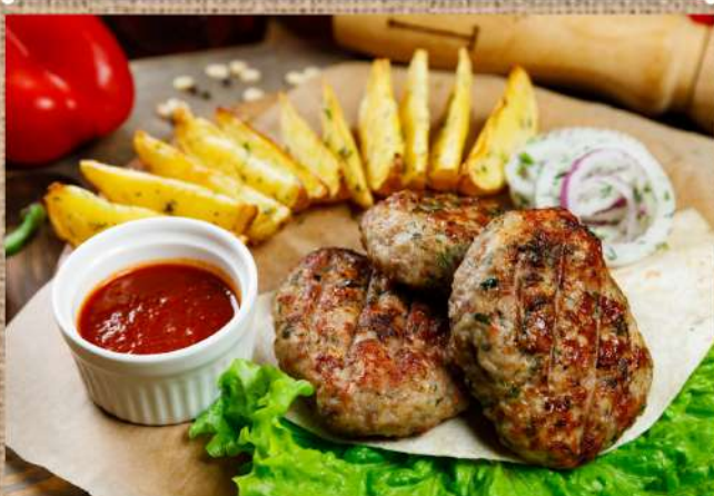
Котлеты микс с картофелем по-деревенски Mixed rissoles with country-style potatoes