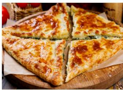
Хачапури слоёный со шпинатом и сыром Сулугуни Khachapoori with spinach and Suluguni cheese 450гр. 390 P