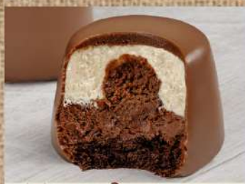
«Шоколадная бомба» Cake «Chocolate bomb»