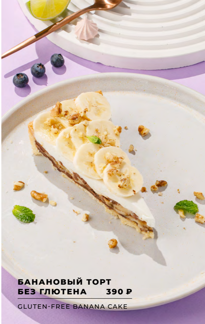
БАНАНОВЫЙ ТОРТ БЕЗ ГЛЮТЕНА 390 Р GLUTEN-FREE BANANA CAKE