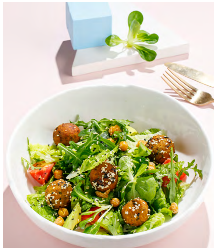
САЛАТ С ФАЛАФЕЛЕМ 550 Р FALAFEL SALAD