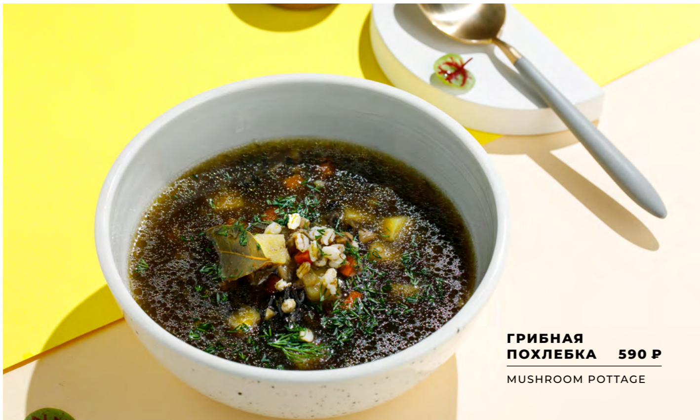
ГРИБНАЯ ПОХЛЕБКА 590 Р MUSHROOM POTTAGE