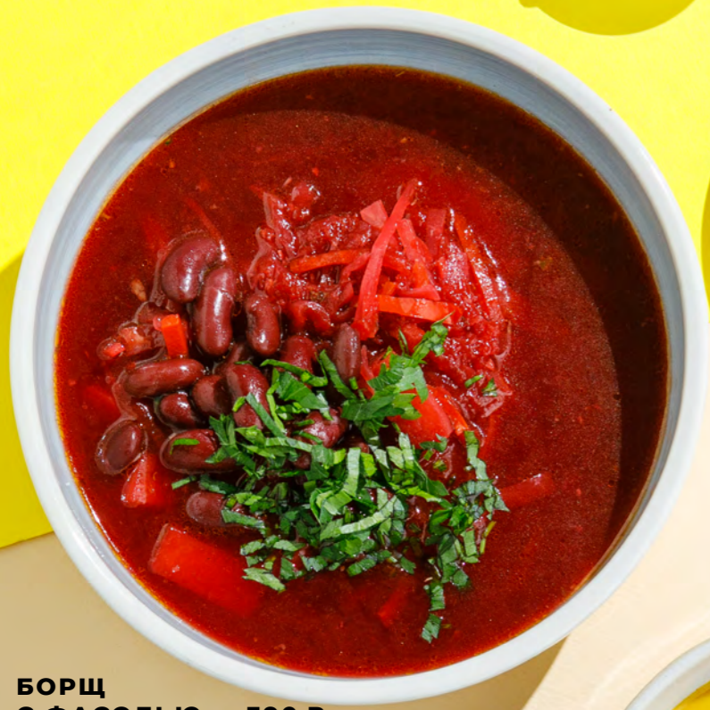
БОРЩ С ФАСОЛЬЮ 390 Р BORSCH WITH BEANS