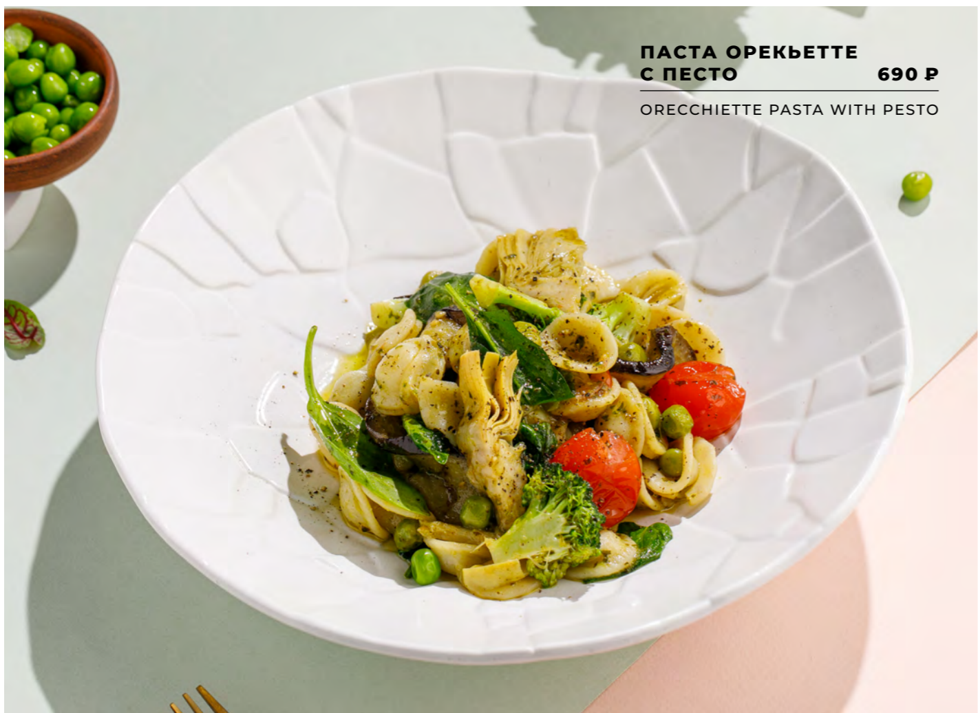
ПАСТА ОРЕКЬЕТТЕ С ПЕСТО 690 Р ORECCHIETTE PASTA WITH PESTO