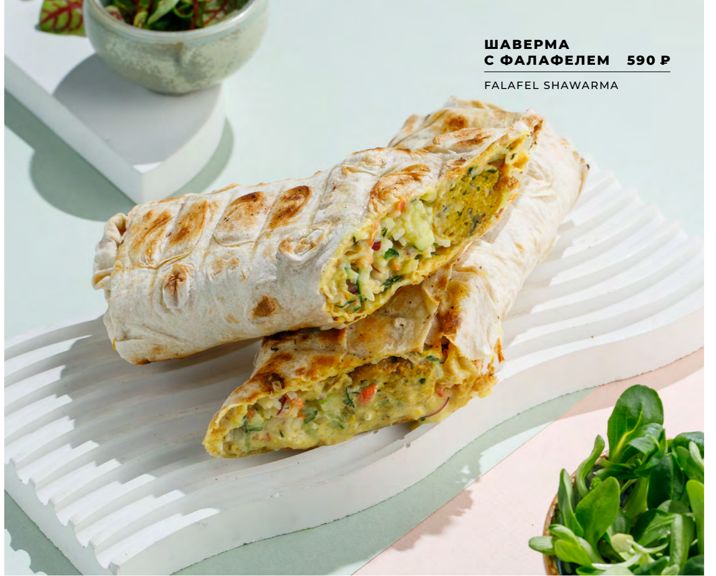
ШАВЕРМА С ФАЛАФЕЛЕМ 590 Р FALAFEL SHAWARMA