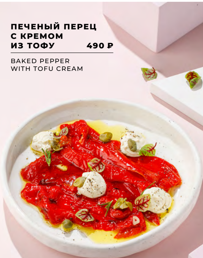
ПЕЧЕНЬ ПЕРЕЦ С КРЕМОМ ИЗ ТОФУ 490 Р BAKED PEPPER WITH TOFU CREAM