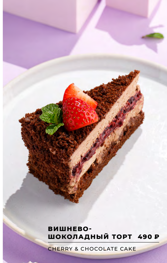
ВИШНЕВО- ШОКОЛАДНЫЙ ТОРТ 490 Р CHERRY & CHOCOLATE CAKE