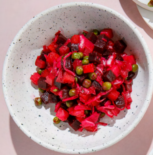
ВИНЕГРЕТ 390 Р VINEGRET