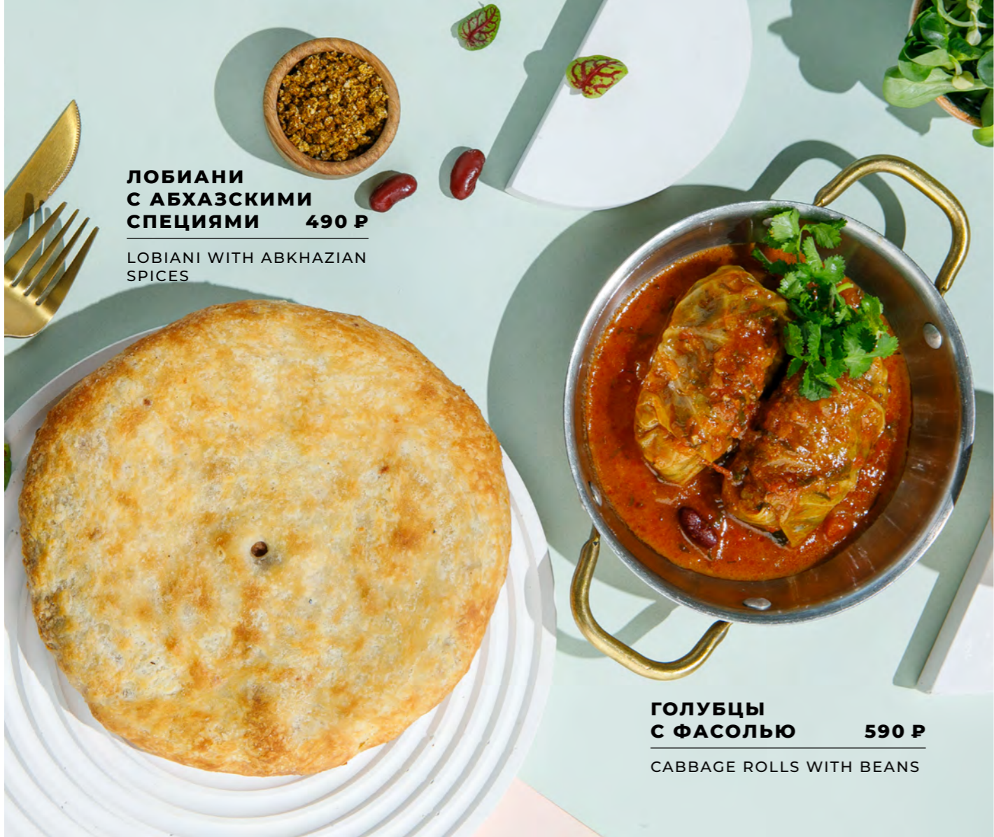
ЛОБИАНИ С АБХАЗСКИМИ СПЕЦИЯМИ 490 Р LOBIANI WITH ABKHAZIAN SPICES