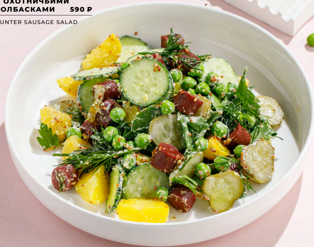
САЛАТ С ОХОТНИЧЬИМИ КОЛБАСКАМИ 590 Р HUNTER SAUSAGE SALAD