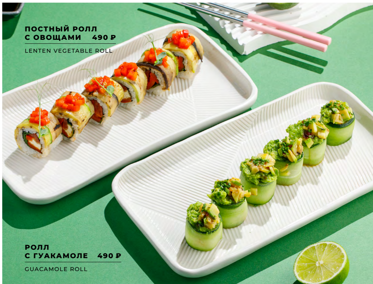
ПОСТНЫЙ РОЛЛ С ОВОЩАМИ 490 Р LENTEN VEGETABLE ROLL