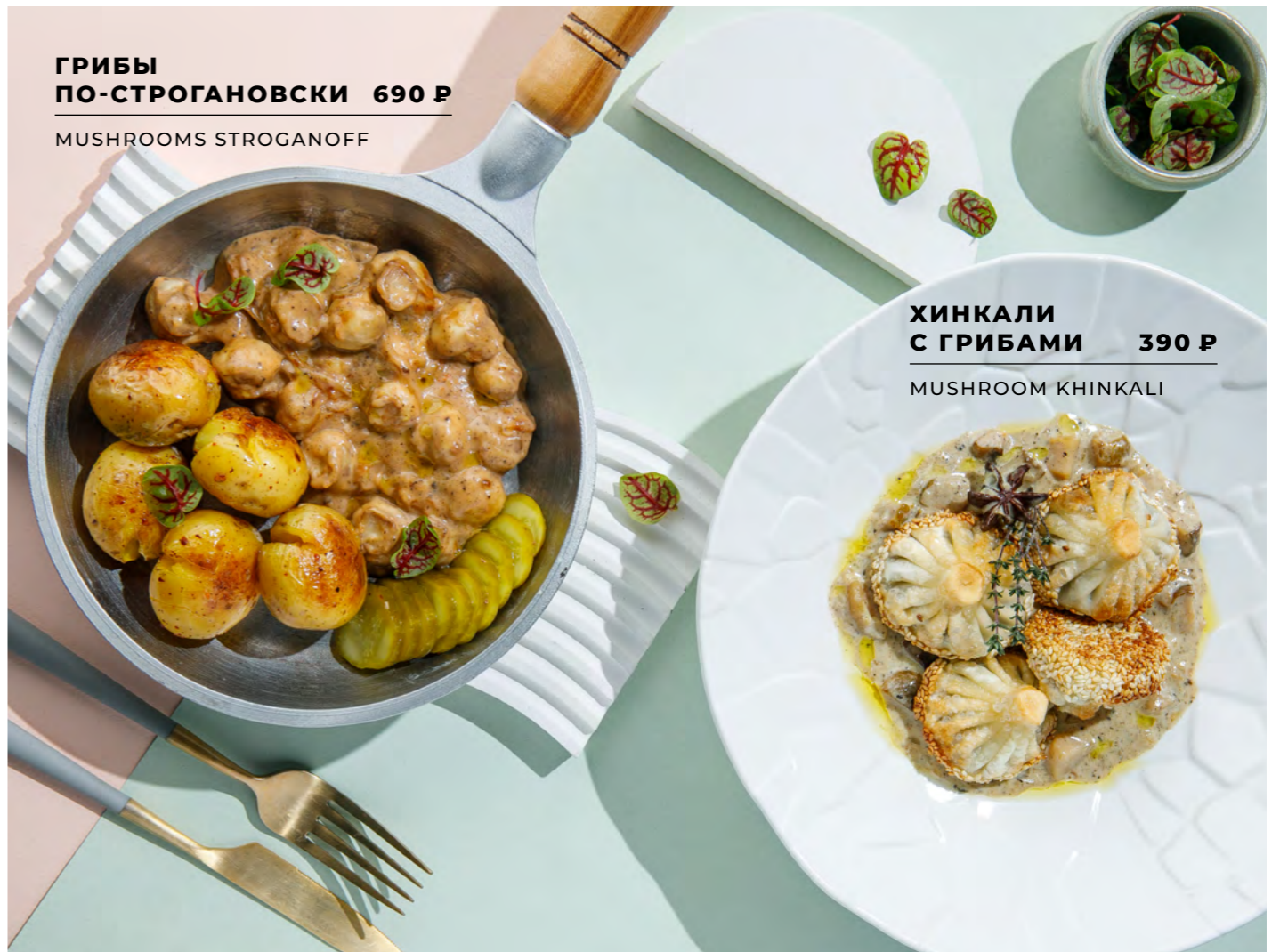
ГРИБЫ ПО-СТРОГАНОВСКИ 690 Р MUSHROOMS STROGANOFF