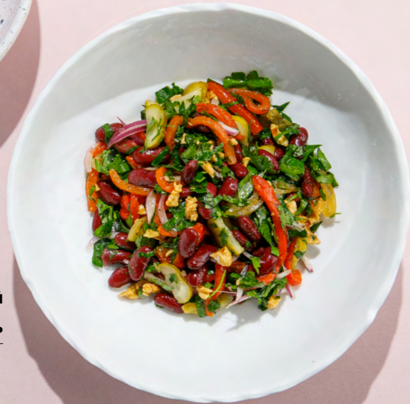
САЛАТ С ПАПРИКОЙ И КРАСНОЙ ФАСОЛЬЮ 490 Р PAPRIKA & RED BEANS SALAD