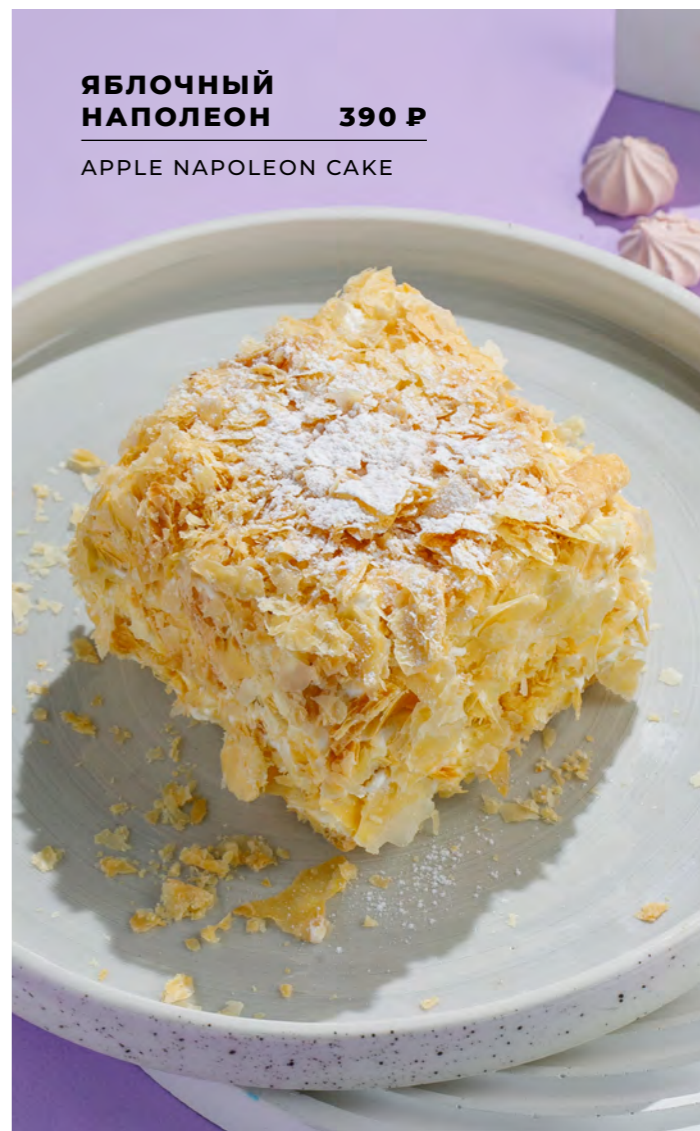
ЯБЛОЧНЫЙ НАПОЛЕОН 390 Р APPLE NAPOLEON CAKE