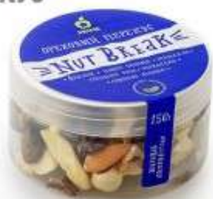
NUTBREAK ОРЕХОВЫЙ ПЕРЕКУС