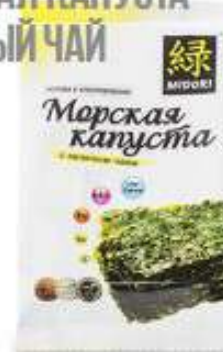
МОРСКАЯ КАПУСТА ЗЕЛЕНый ЧАЙ