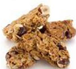
ОРЕХИ И МЕД