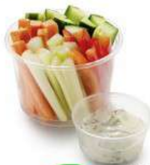
САЛАТ ОВОЩИ MIX