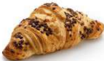
КРУАССАН С ШОКОЛАДОМ