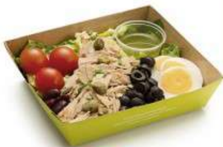
САЛАТ С ТУНЦОМ