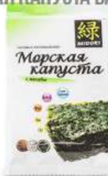
МОРСКАЯ КАПУСТА ВАСАБИ