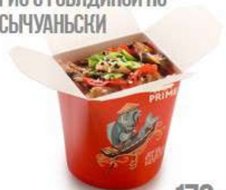
РИС С ГОВЯДИНОЙ ПО- СЫЧУАНЬСКИ