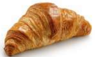
КЛАССИЧЕСКИЙ ФРАНЦУЗСКИЙ КРУАССАН