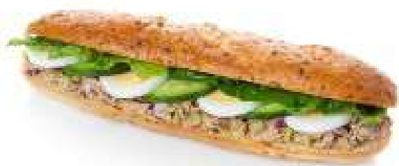
БАГЕТ С ТУНЦОМ