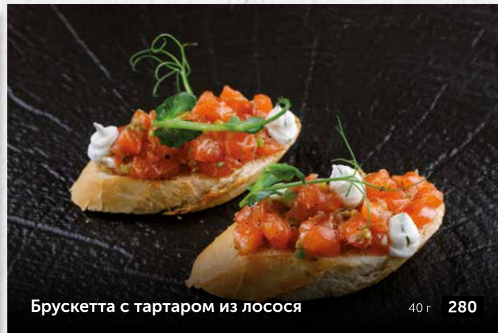
Брускетта с тартаром из лосося