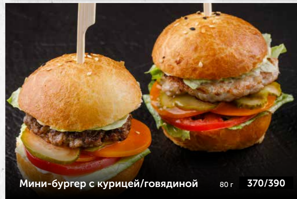
Мини-бургер с курицей/говядиной 80 г 370/390