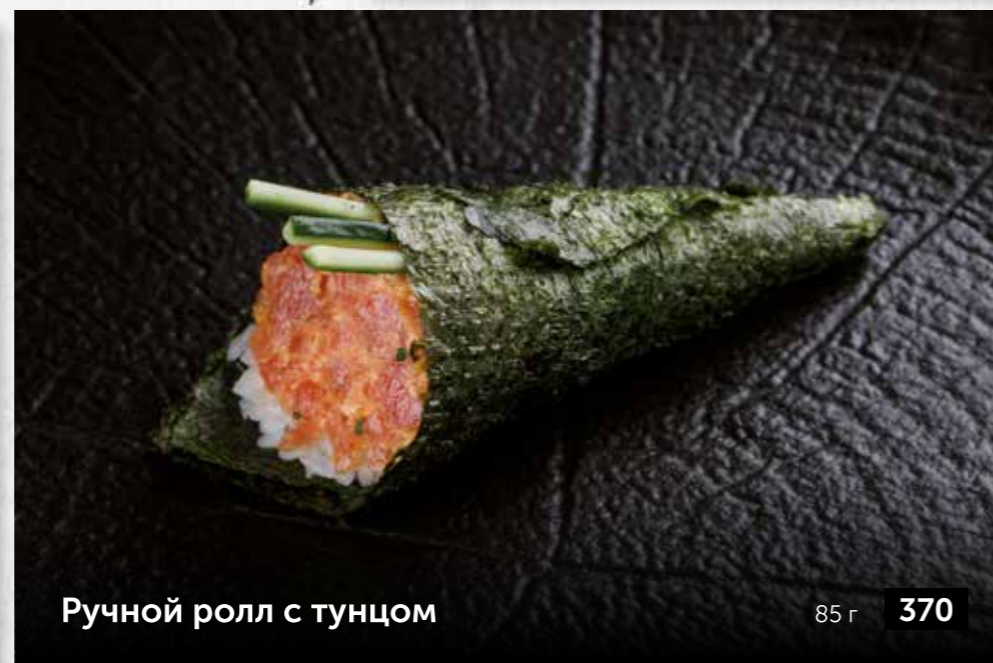
Ручной ролл с тунцом