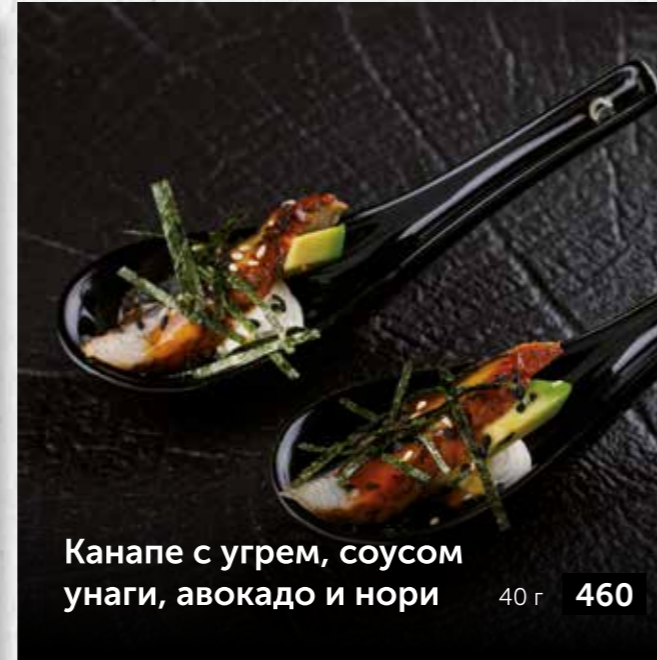
Канapé с угрем, соусом унаги, авокадо и нори 40 г 460