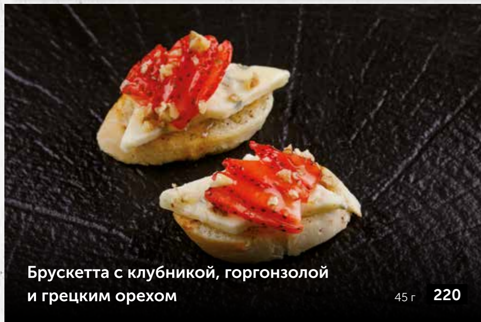
Брускетта с клубникой, горгонзолы и грецким орехом