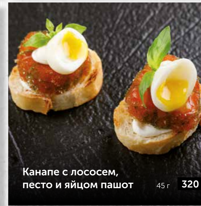
Канapé с лососем, песто и яйцом пашот 45 г 320