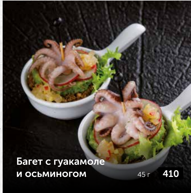
Багет с гуакамоле и осьминогом 45 г 410