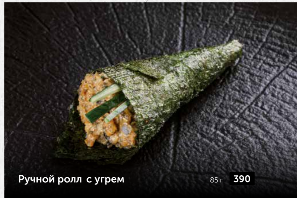
Ручной ролл с угрем