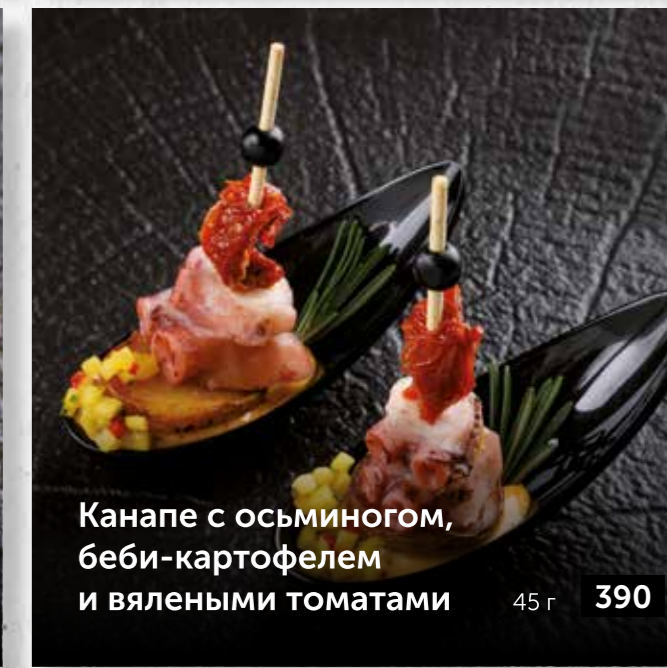
Канapé с осьминогом, беби-картофелем и вялеными томатами 45 г 390