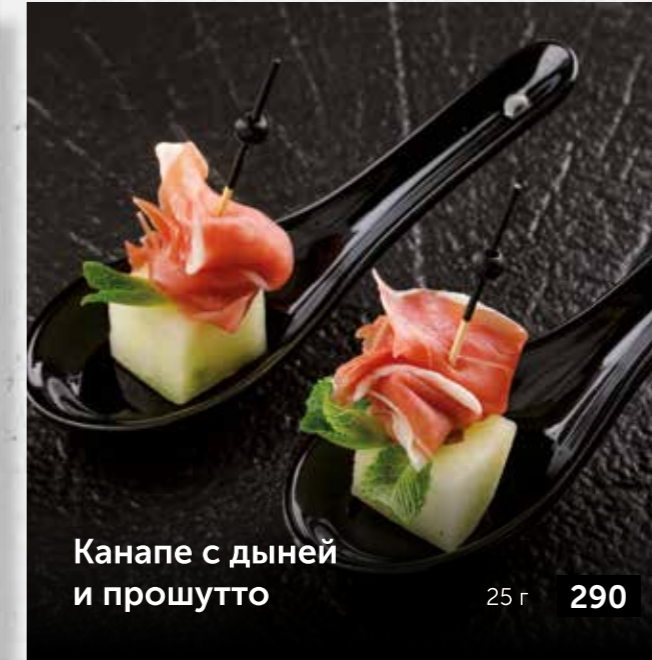
Канapé с дыней и прошутто 25 г 290