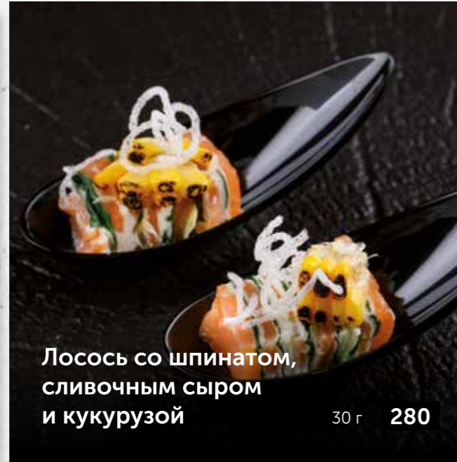
Лосось со шпинатом, сливочным сыром и кукурузой 30 г 280