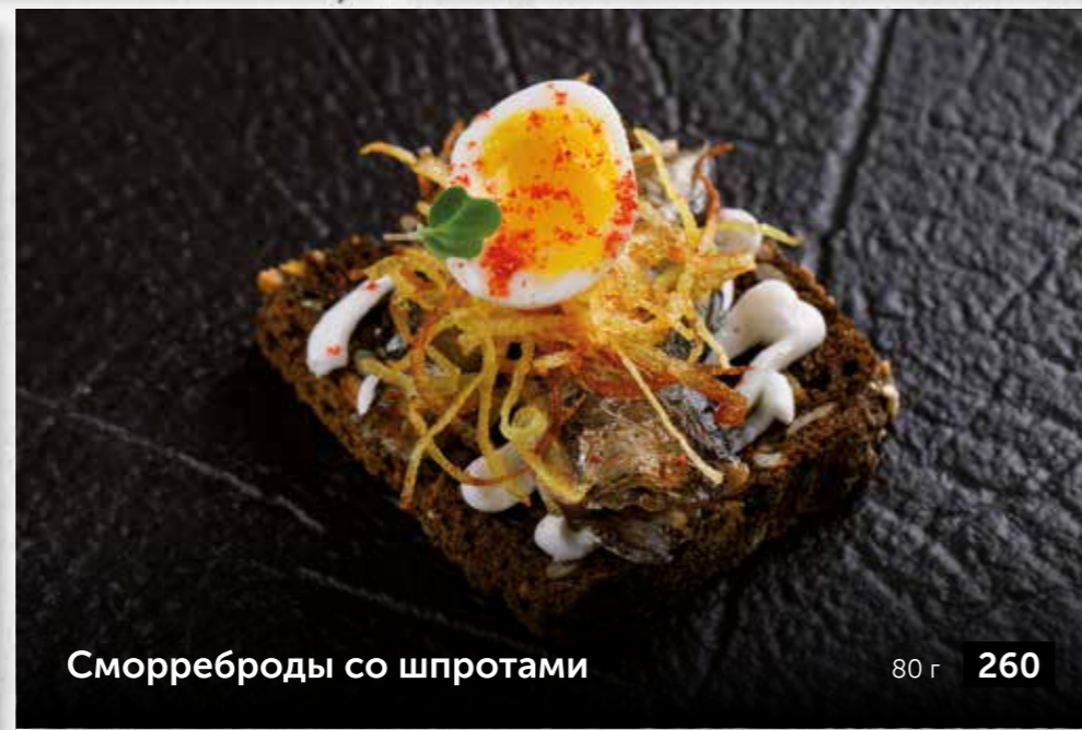
Сморреброды со шпротами 80 г 260