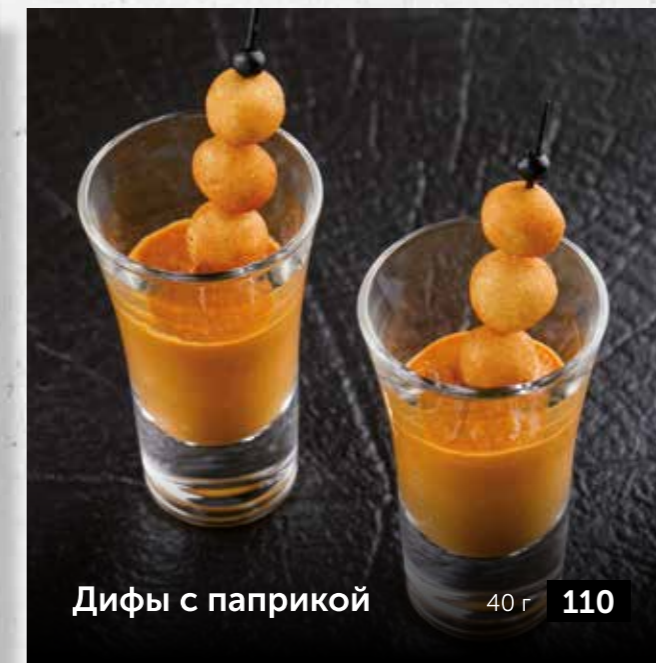
Дифы с паприкой