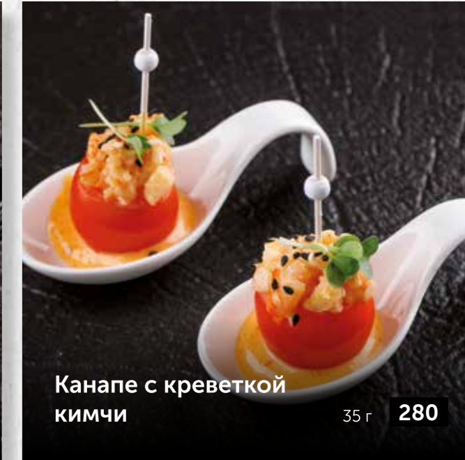
Канapé с креветкой кимчи 35 г 280