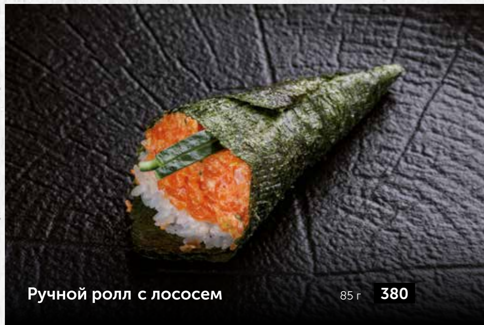
Ручной ролл с лососем