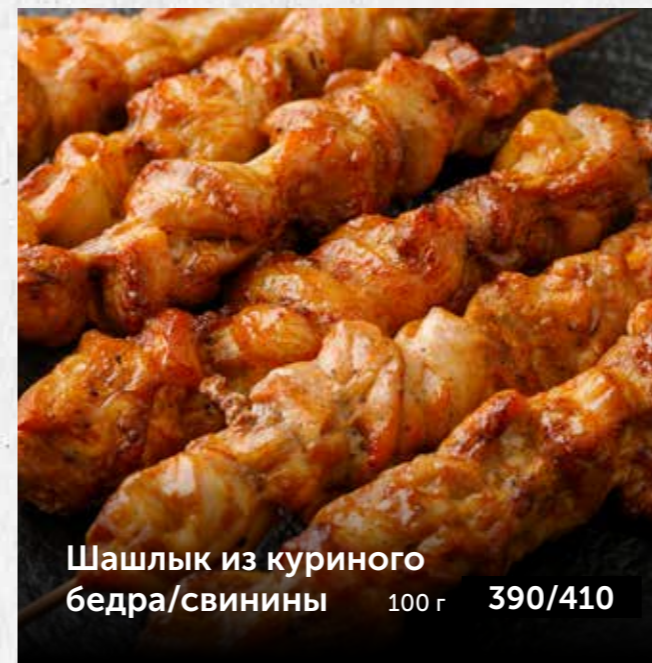
Шашлык из куриного бедр/свинины 100 г 390/410