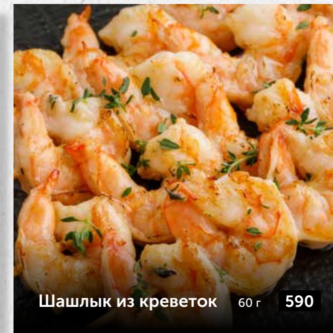
Шашлык из креветок 60 г 590