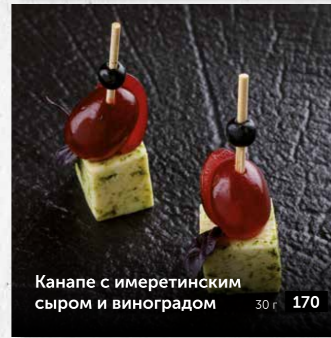
Канapé с имеретинским сыром и виноградом 30 г 170