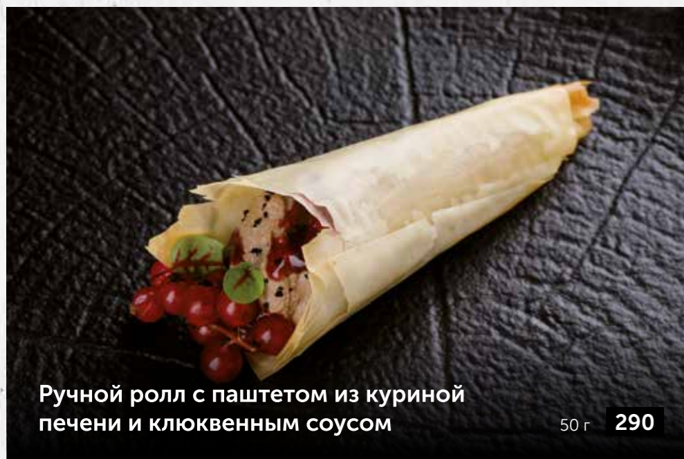
Ручной ролл с паштетом из куриной печени и клюквенным соусом