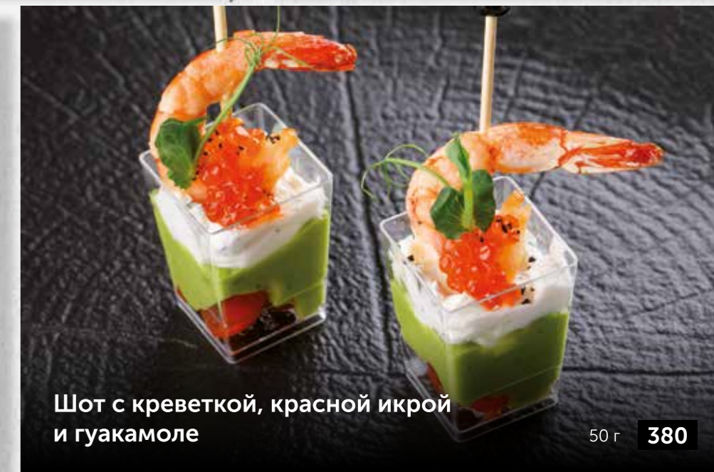
Шот с креветкой, красной икрой и гуакамоле