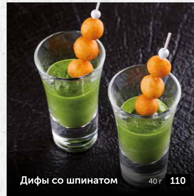
Дифы со шпинатом