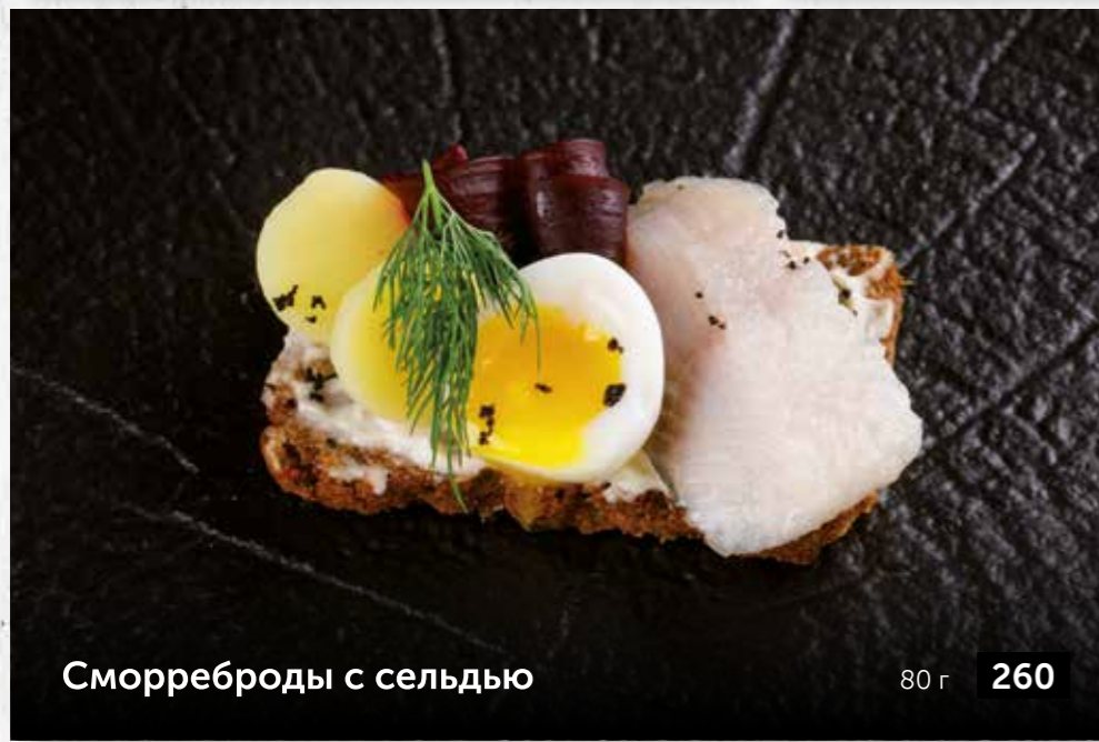
Сморреброды с сельдью 80 г 260