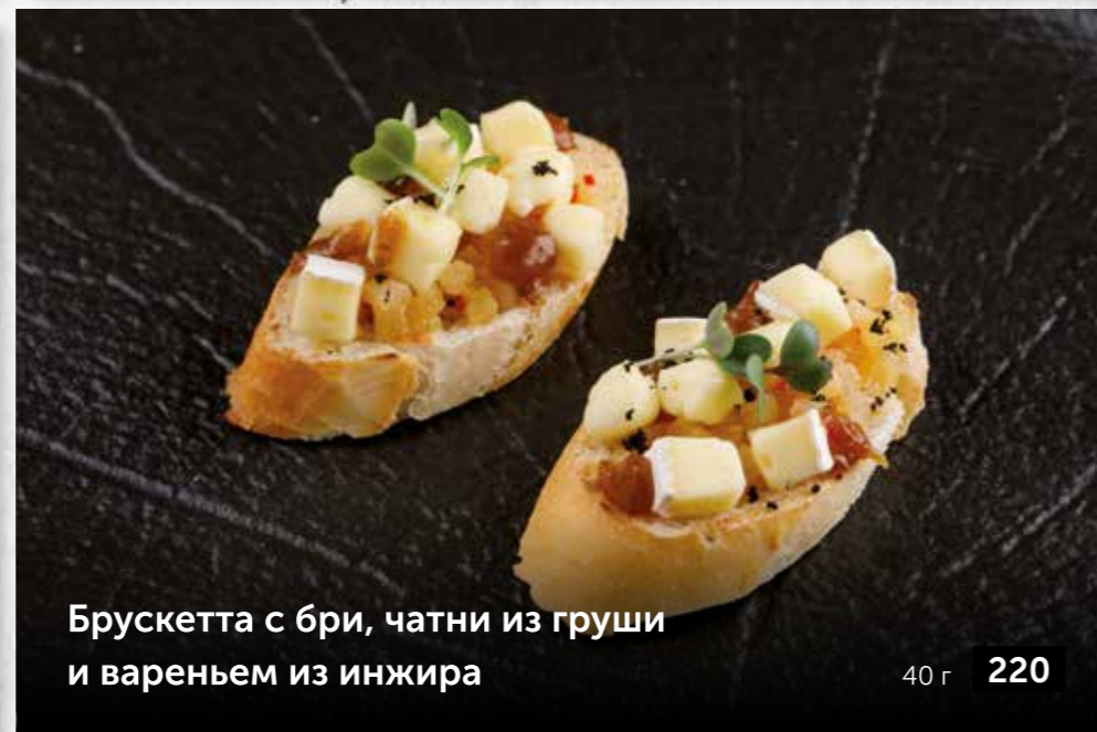
Брускетта с бри, чатни из груши и вареньем из инжира