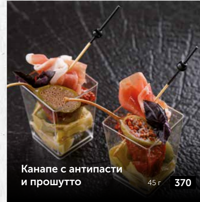
Канapé с антипасты и прошутто 45 г 370