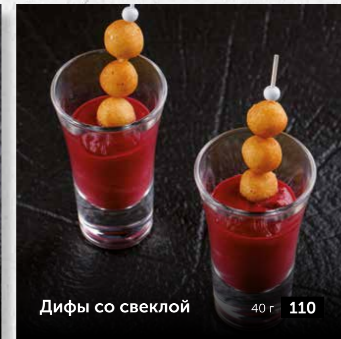
Дифы со свеклой