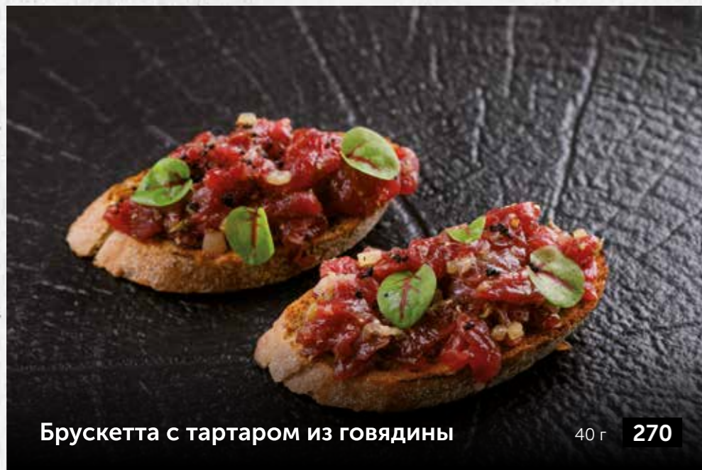
Брускетта с тартаром из говядины