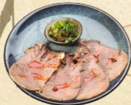
Язык Шакароб 75 г. ~ 250 р.