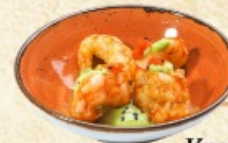
Креветки Васаби 115 г. ~ 320 р.