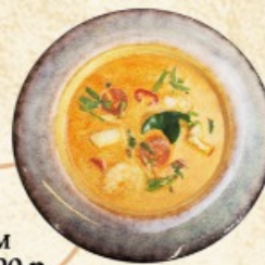
Том-Ям 330 г. ~ 290 р.