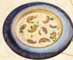
Сливочно-грибной суп в азиатском стиле 280 г. ~ 210 р.