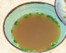
Нарын 600 г. ~ 390 р.