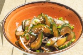
Битые огурцы 100 г. ~ 120 р.