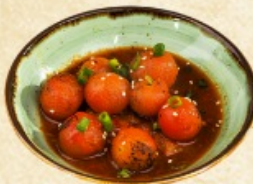
Опалённые помидоры 100 г. ~ 140 р.

Салат из курицы с арахисом 120 г. ~ 210 р.