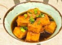
Агедаши тофу 160 г. ~ 150 р.