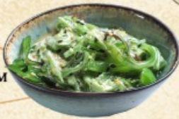
Чука салат с ореховым соусом 100 г. ~ 140 р.