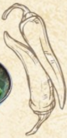
Ламянь с говядиной 800 г. ~ 370 р.