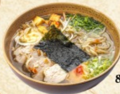
Рамен с курицей 800 г. ~ 350 р.