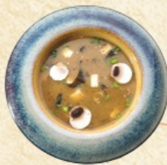
Мисоширу 280 г. ~ 140 р.