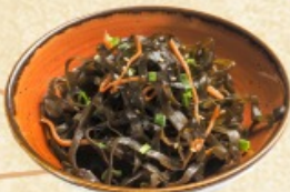
Салат из морской капусты 100 г. ~ 110 р.