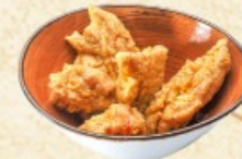
Карааге (треска) 110 / 30 г. ~ 190 р.

Нэмы жареные (овощи / курица / баранина) 120 / 30 г. ~ 180 / 200 / 220 р.