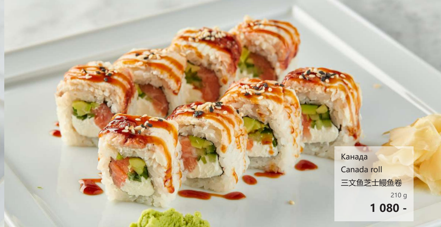
Канада Canada roll 三文鱼芝士鳗鱼卷 210 g 1 080 -