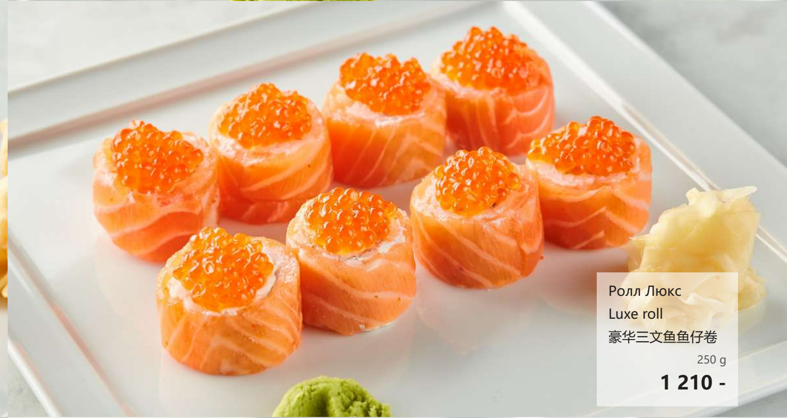
Ролл Люкс Luxe roll 豪华三文鱼鱼仔卷 250 g 1 210 -