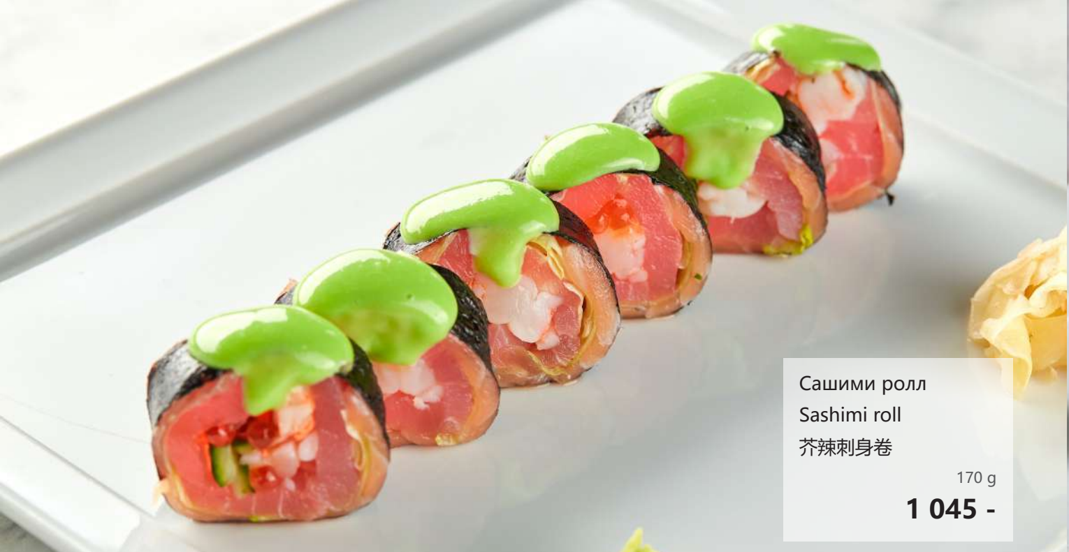
Сашими ролл Sashimi roll 芥辣刺身卷