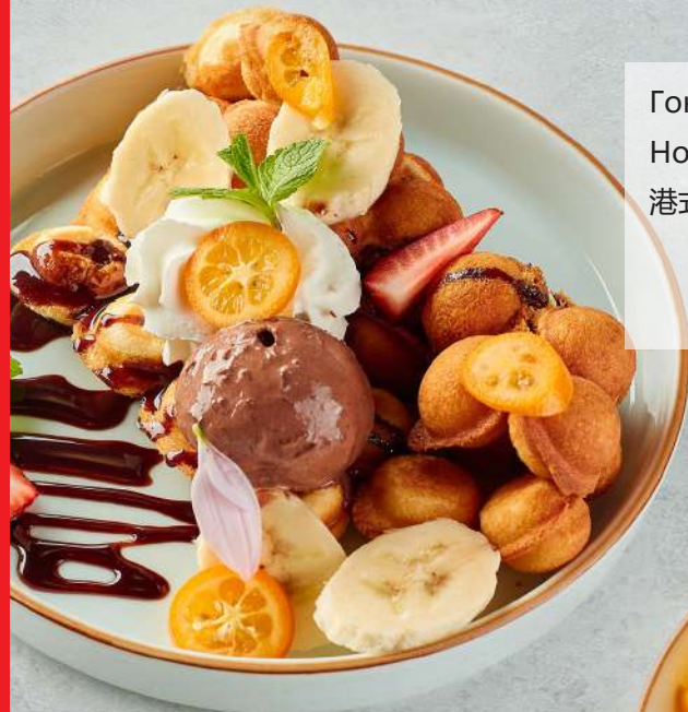
Гонконгские вафли Hong Kong waffles 港式蛋仔配冰淇淋