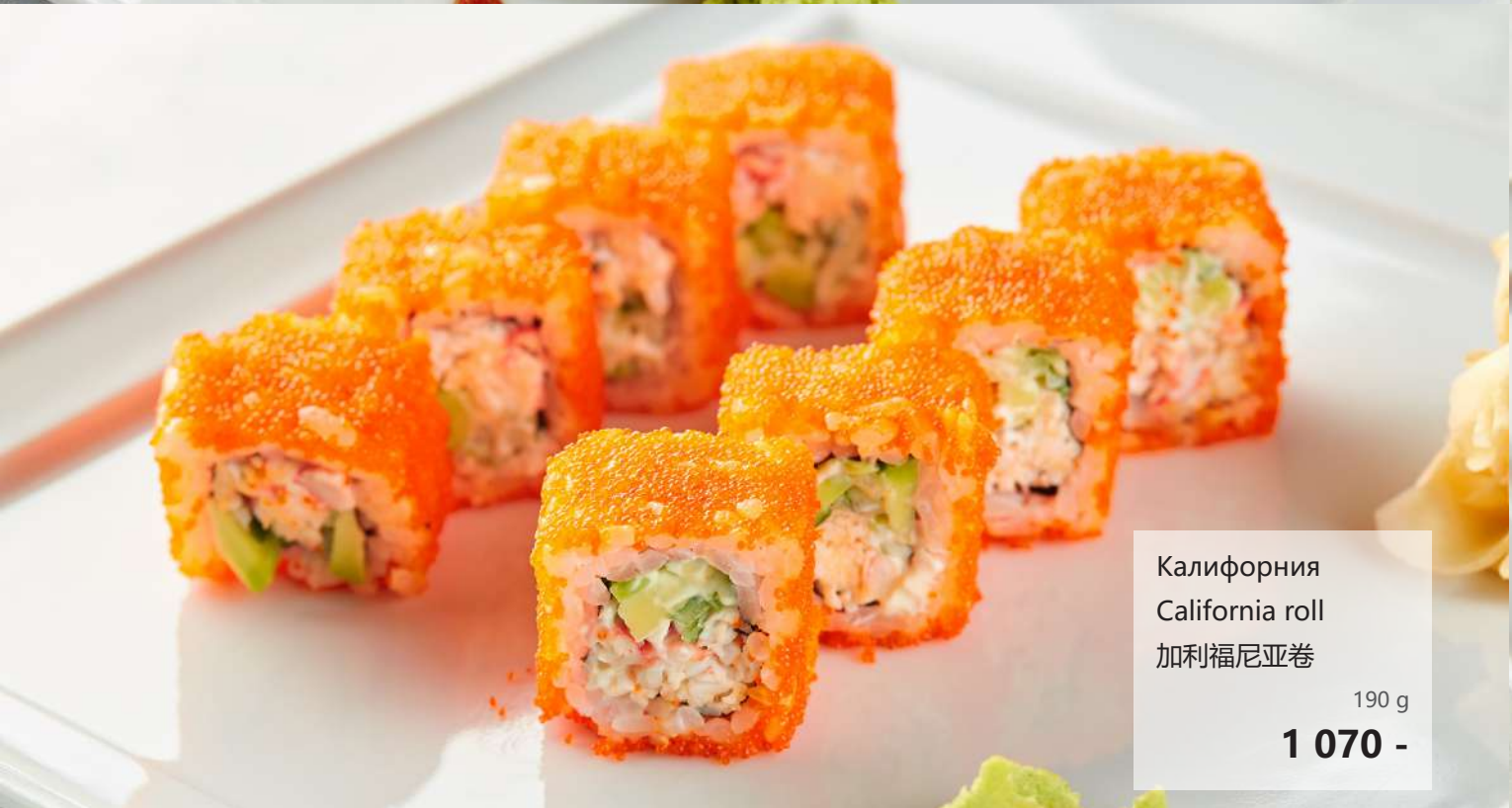
Калифорния California roll 加利福尼亚卷