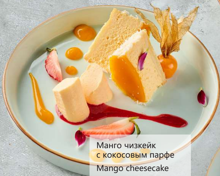
Манго чизкейк с кокосовым парфе Mango cheesecake 芒果芝士蛋糕配椰味奶冻