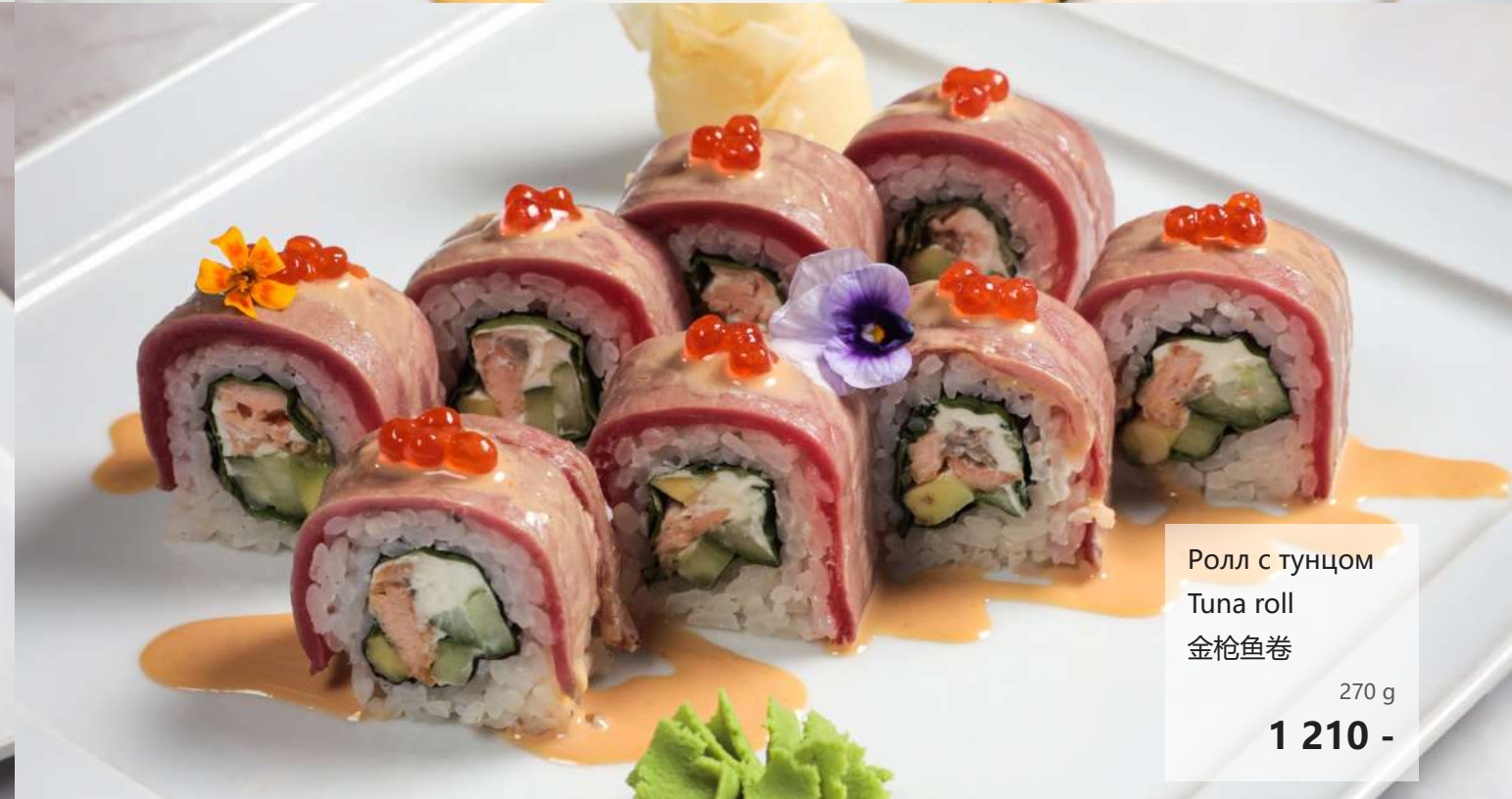
Ролл с тунцом Tuna roll 金枪鱼卷 270 g 1 210 -