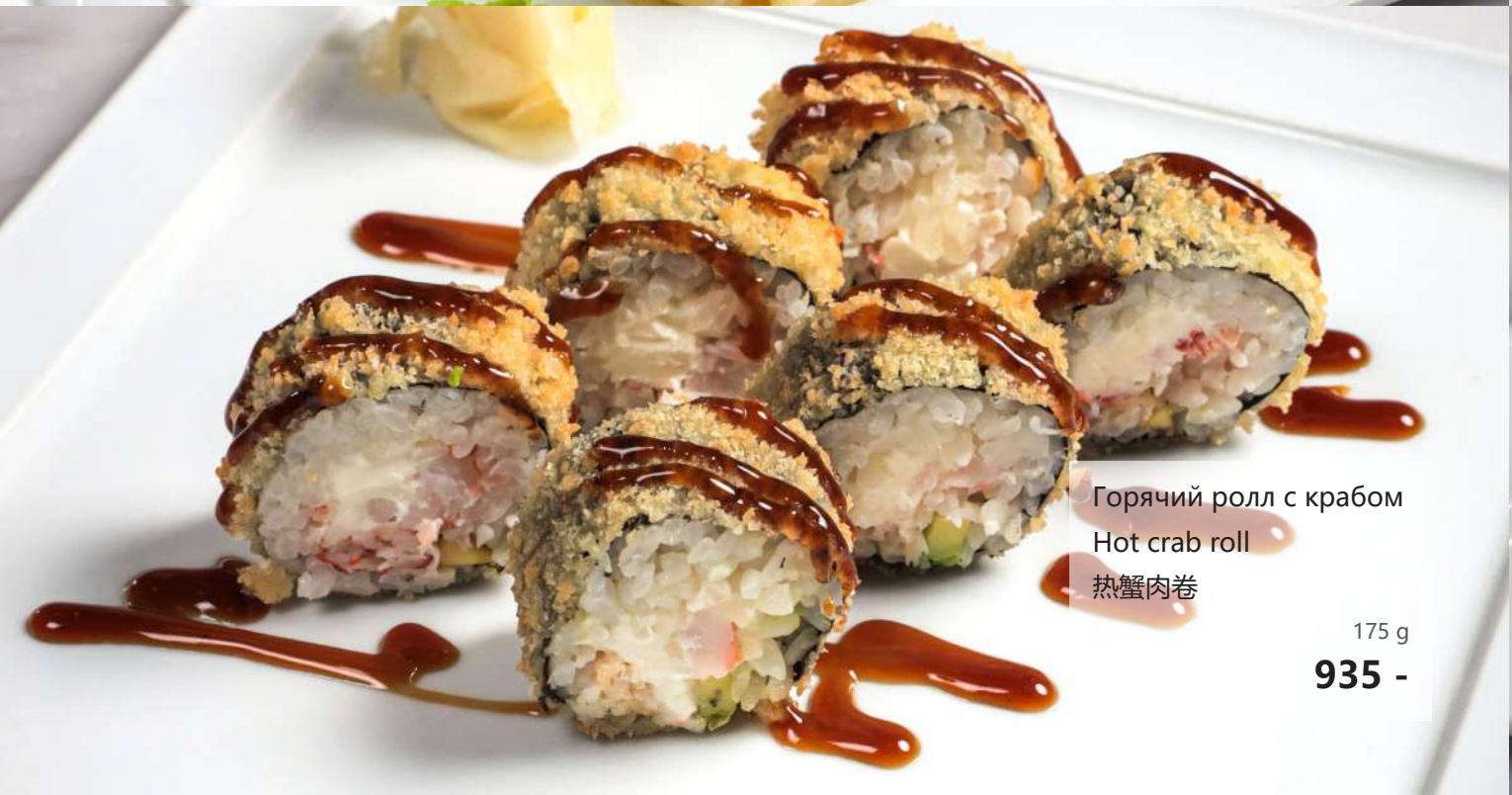
Горячий ролл с крабом Hot crab roll 热蟹肉卷