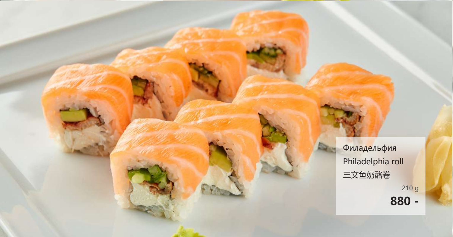
Филадельфия Philadelphia roll 三文鱼奶酪卷