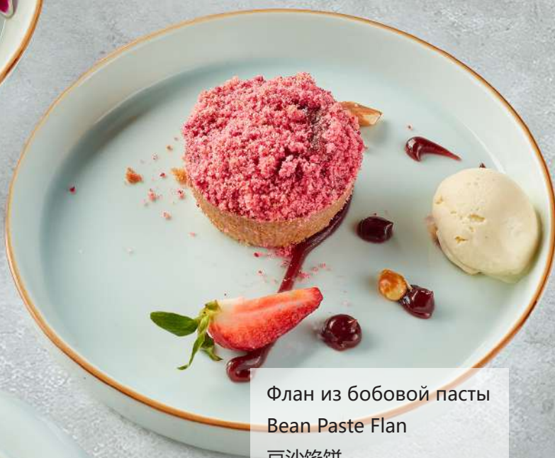
Флан из бобовой пасты Bean Paste Flan 豆沙馅饼