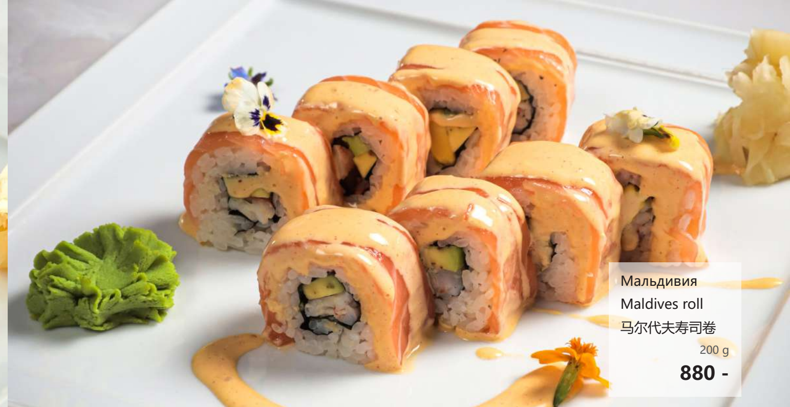
Мальдивия Maldives roll 马尔代夫寿司卷 200 g 880 -