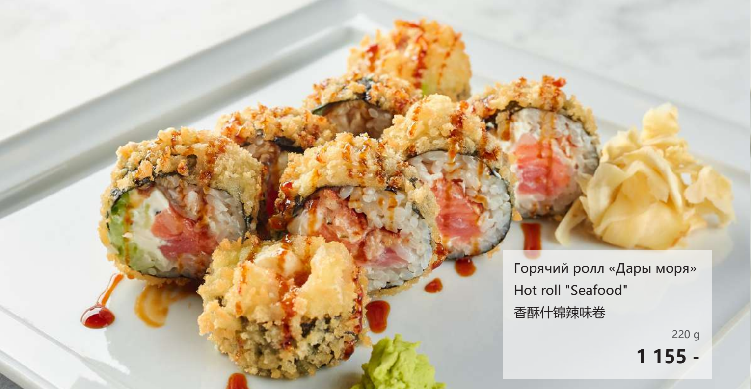
Горячий ролл «Дары моря» Hot roll "Seafood" 香酥什锦辣味卷