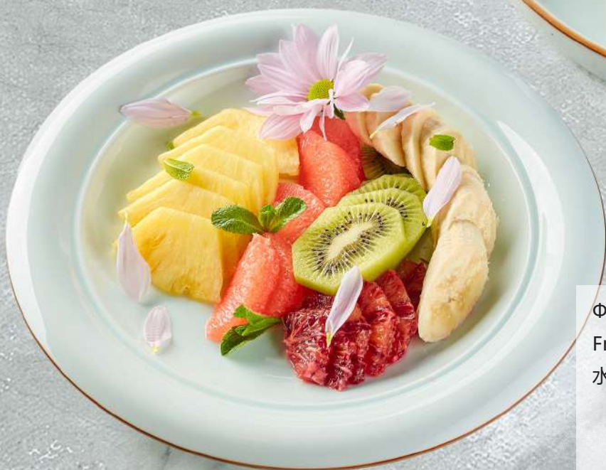
Фруктовое ассорти Fruit assorted 水果什锦