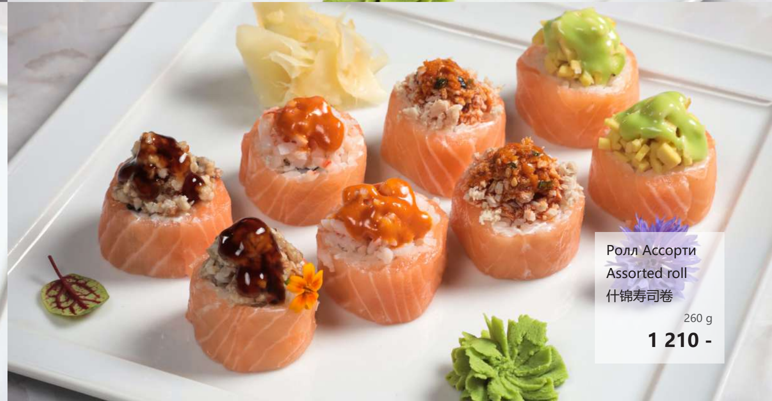
Ролл Ассорти Assorted roll 什锦寿司卷 260 g 1 210 -