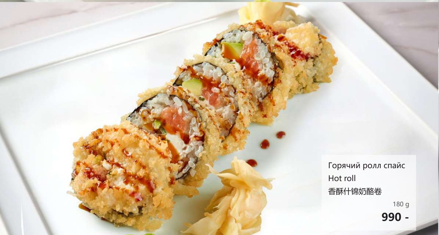
Горячий ролл спайс Hot roll 香酥什锦奶酪卷