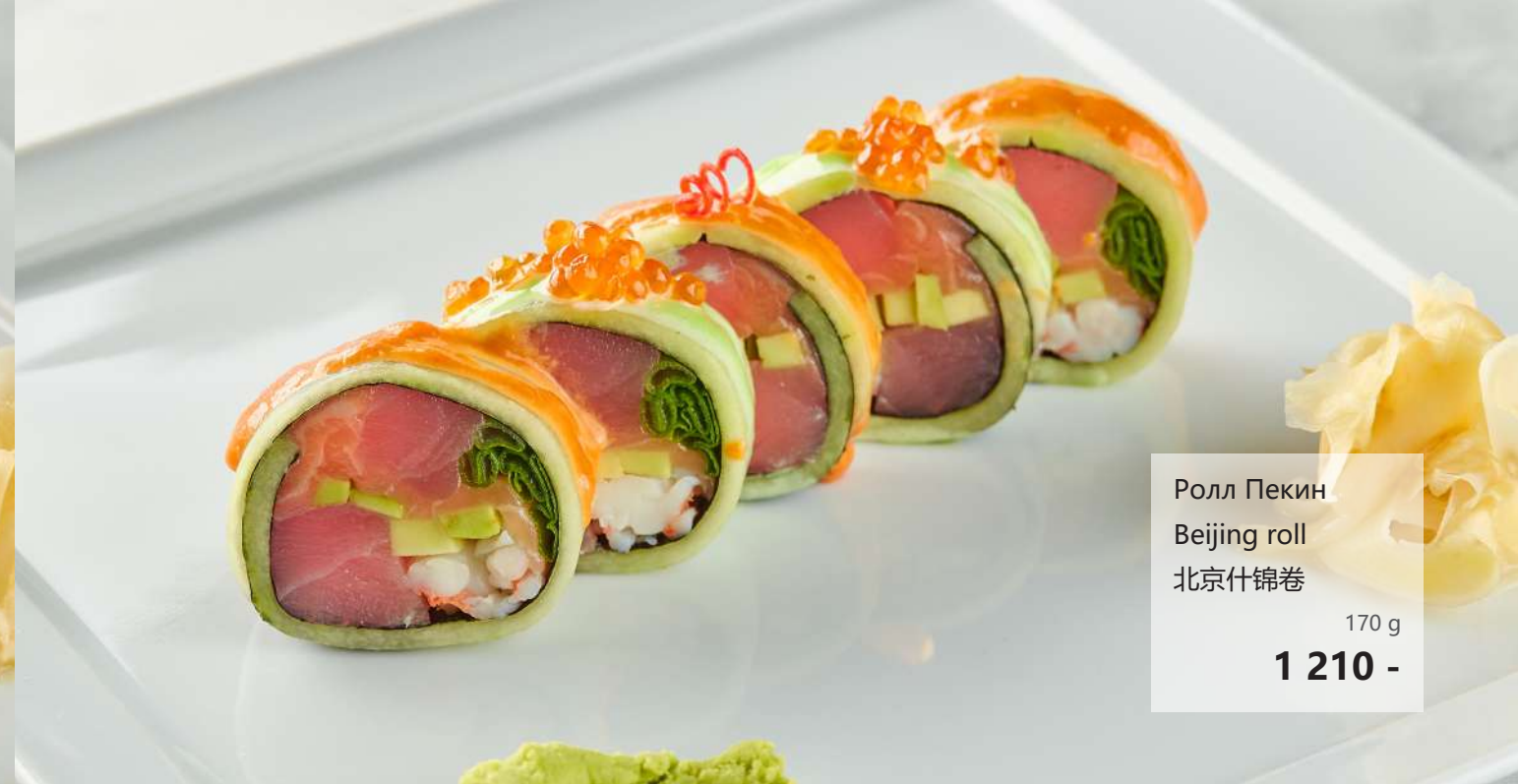
Ролл Пекин Beijing roll 北京什锦卷 170 g 1 210 -