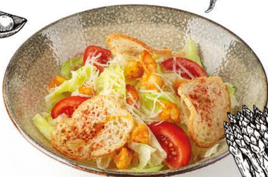
Цезарь с креветками 145 г, 338 ккал 250.-