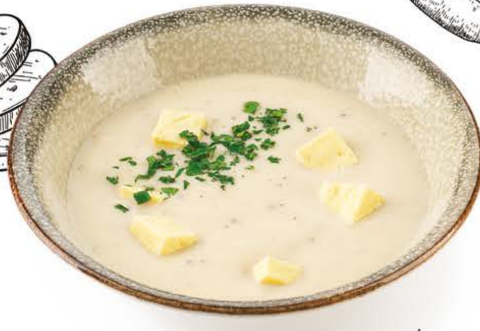
Крем-суп из цветной капусты NEW с куриным суфле и трюфелем 300/30 г, 438 ккал 270.-