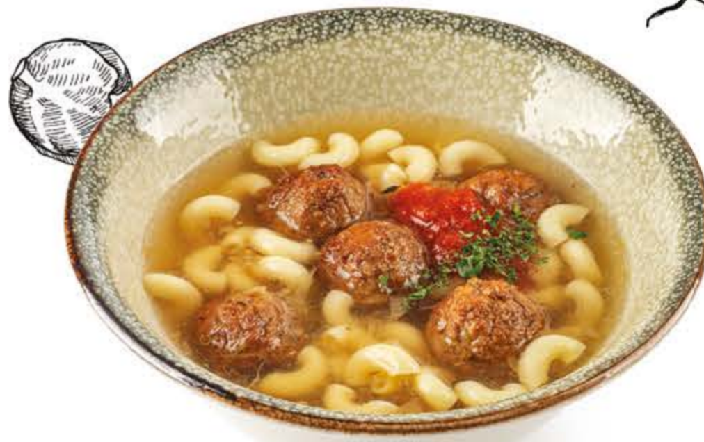
Суп с фрикадельками 365 г, 294 ккал 230.-