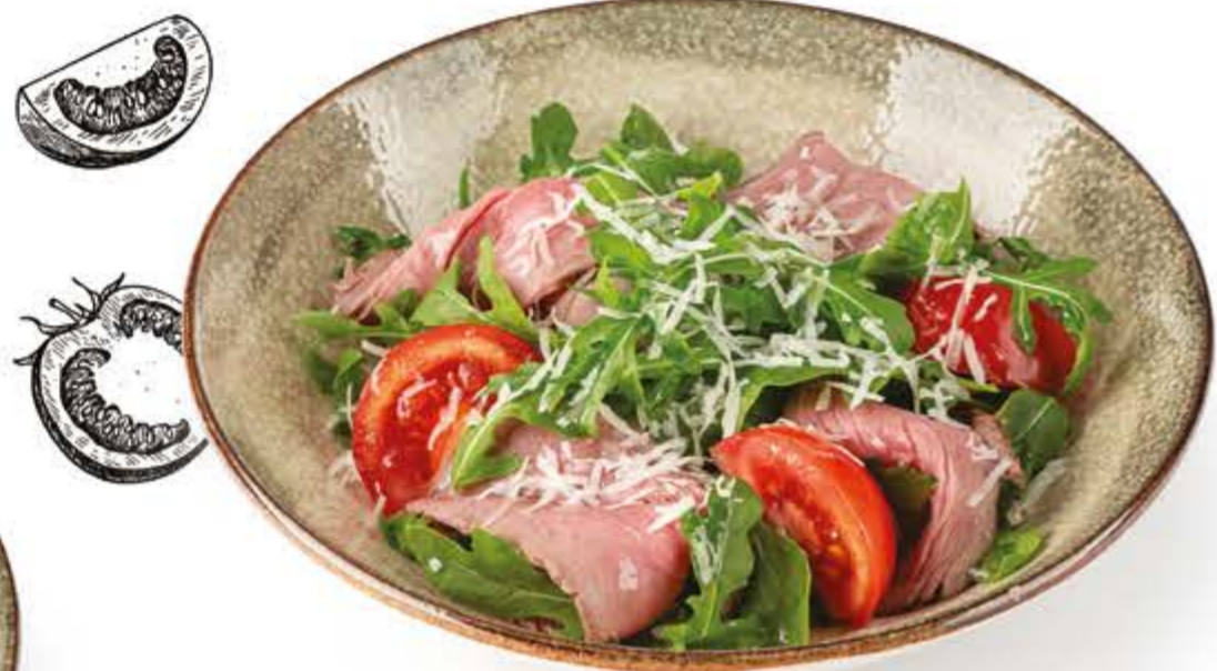
▮ попробуйте с настойкой С ростбифом, томатами и рукколой 100 г, 229 ккал 270.-