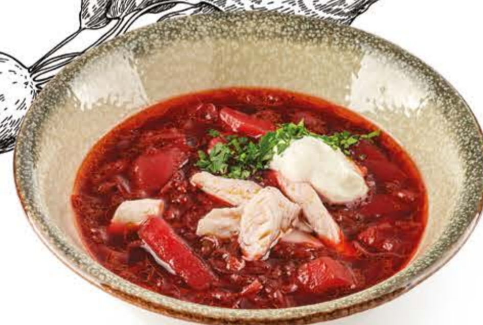
▮ попробуйте с настойкой Борщ с отварным куриным филе и сметаной 300 г, 226 ккал 230.-