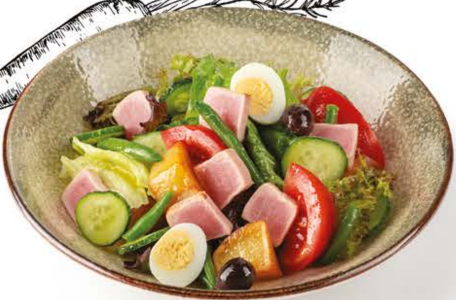
▮ попробуйте с настойкой Нисуаз с тунцом и перепелиным яйцом 175 г, 183 ккал 270.-