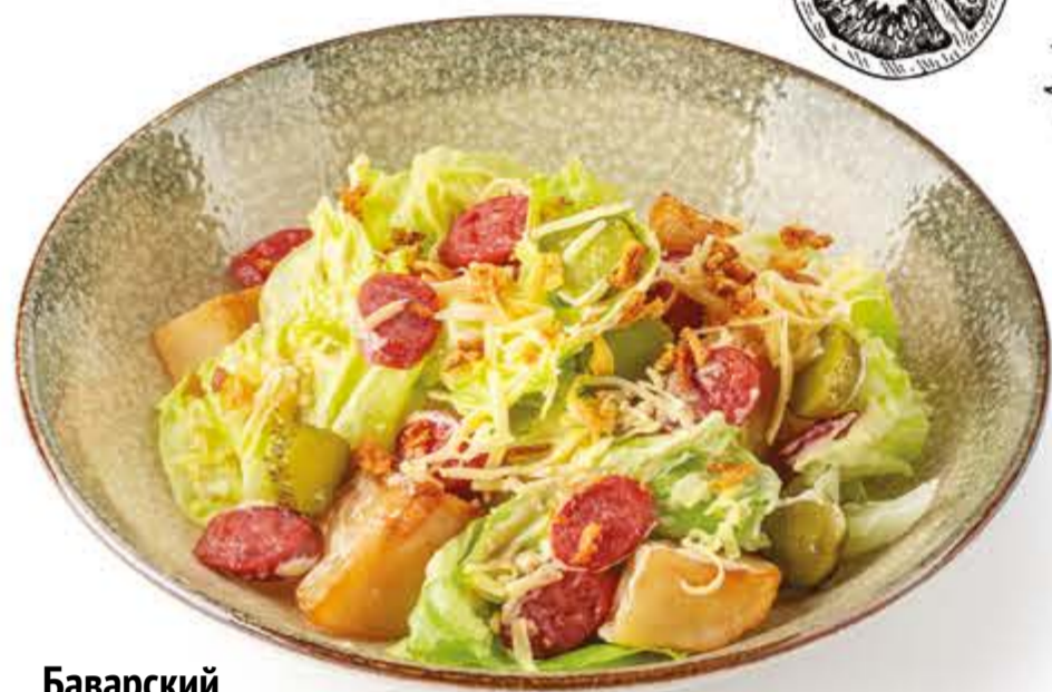
Баварский 205 г, 409 ккал 250.-