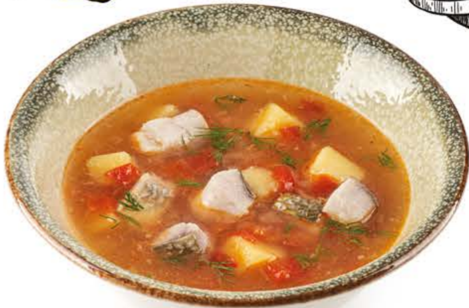
Уха с черноморской кефалью 340 г, 128 ккал 250.-