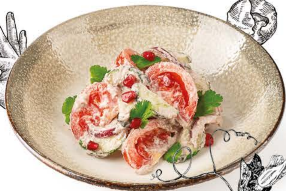
Овощной салат NEW с соусом из грецких орехов 160 г, 173 ккал 270.-