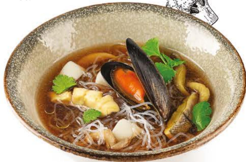
Пряный суп с морепродуктами, NEW вешенками и стеклянной лапшой 415 г, 241 ккал 270.-