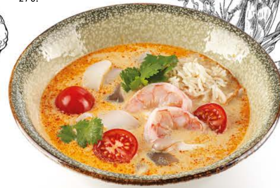
▮ попробуйте с настойкой Том Ям, подается с паровым рисом 340 г, 292 ккал 270.-