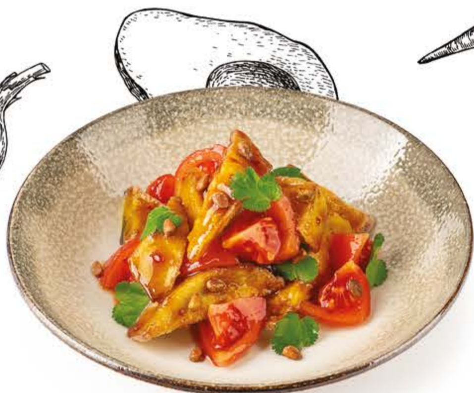
Жареные баклажаны NEW с кинзой и томатами 160 г, 231 ккал 270.-