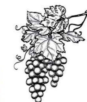
Рислинг, Шлосс Зоммеру белое полусладкое (Германия)