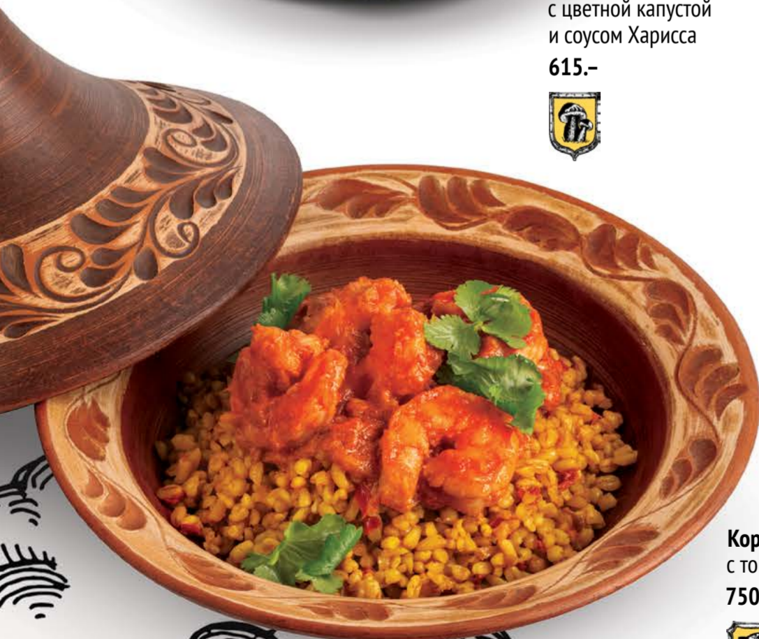
Королевские креветки с томленным булгуром