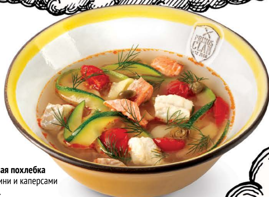
Рыбная похлебка с цукини и каперсами