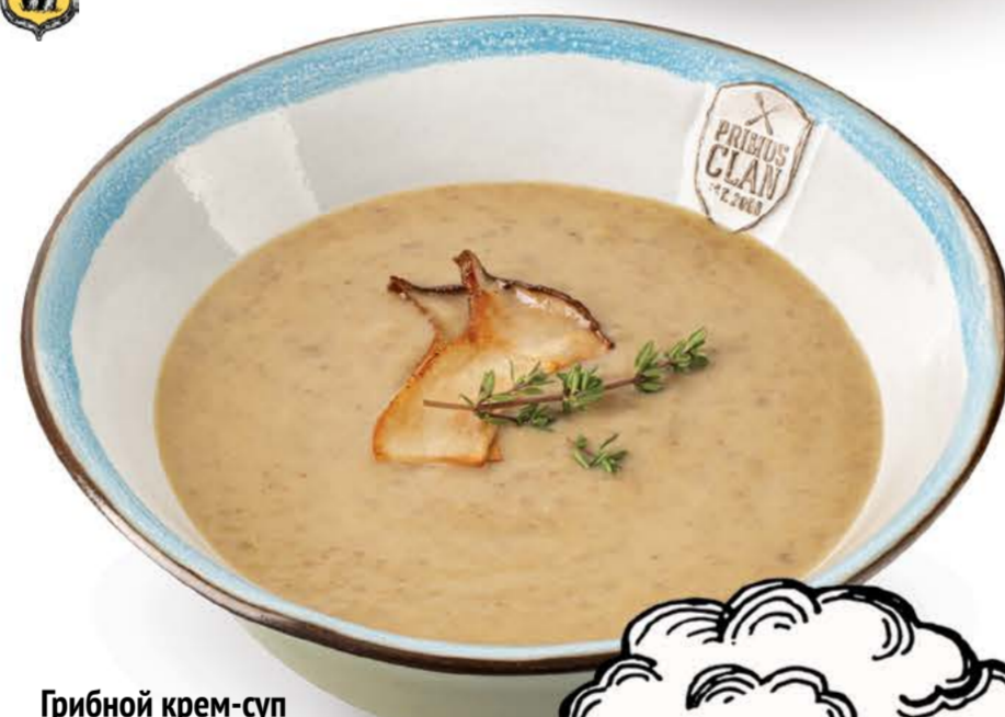
Грибной крем-суп с жареными ерингами и трюфелем