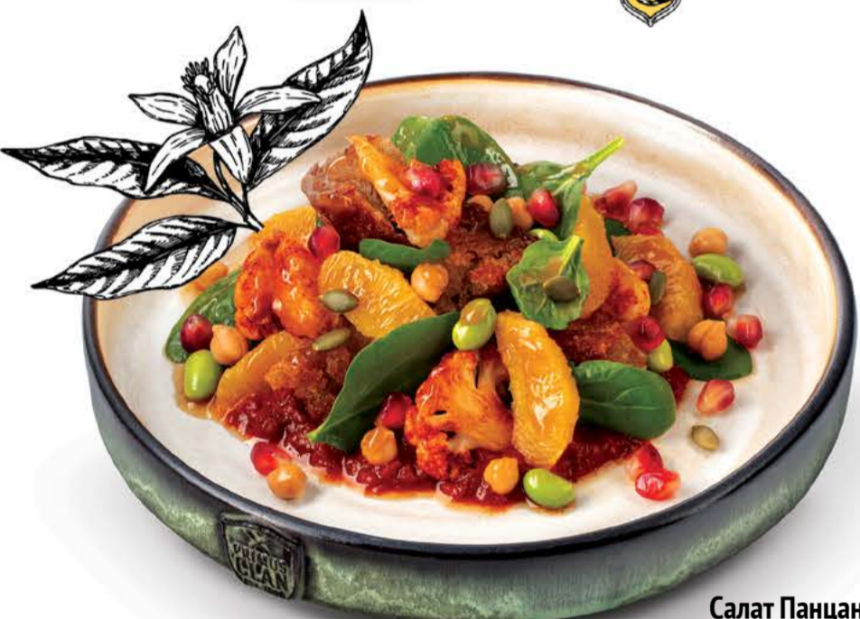
Салат Панцанелла с цветной капустой и соусом Харисса