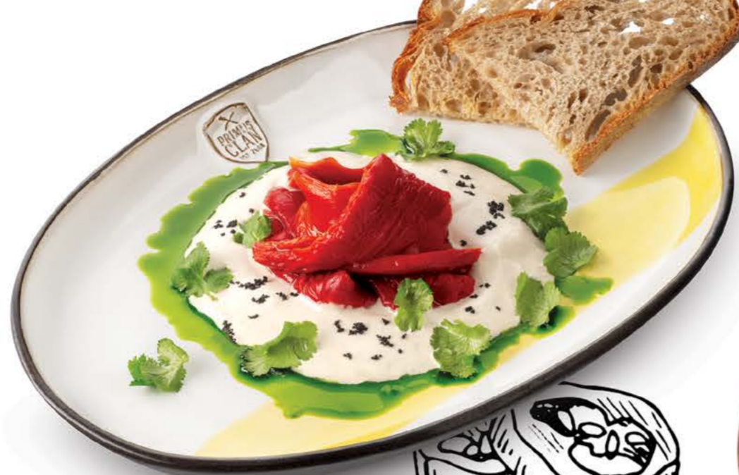
Печеный перец Рамиро с кремом из тунца