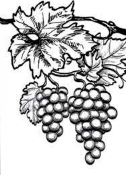
Каберне, Шлосс Зоммеру красное полусладкое (Германия)