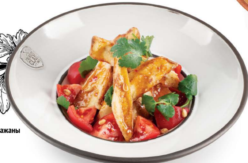
Печеные баклажаны с томатами