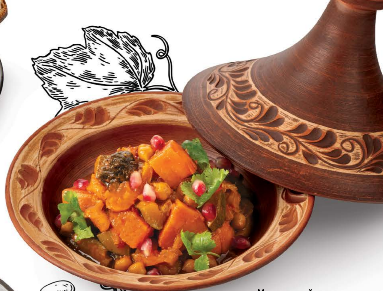
Марокканский тажин с нутом и бататом