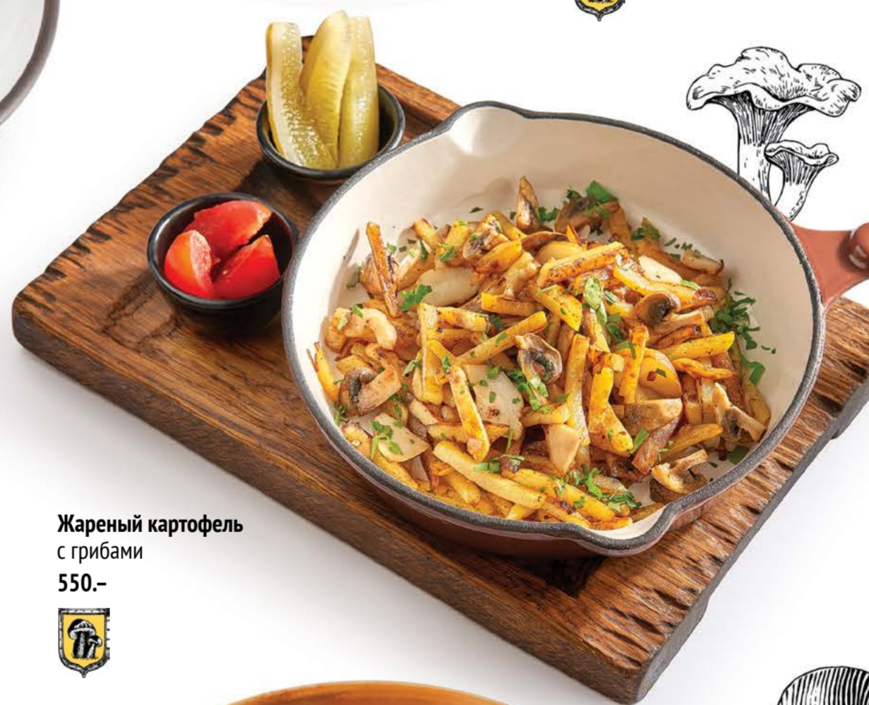
Жареный картофель с грибами