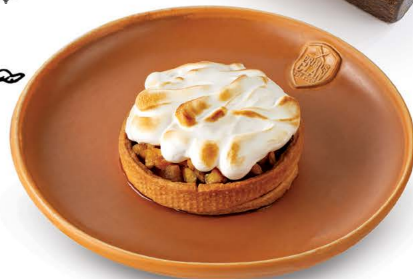
Pâte Sablée с яблоками, трюфелем и соленой карамелью