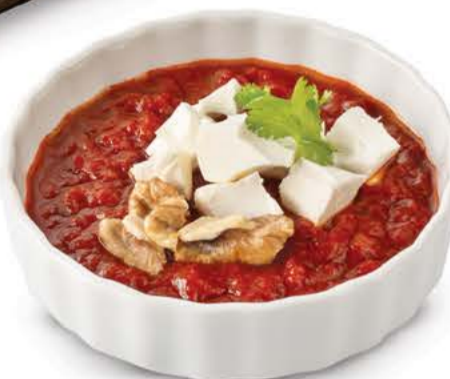
Постные дип-соусы Харисса, Хумус и Бабагануш Подаются с лепешками Роти