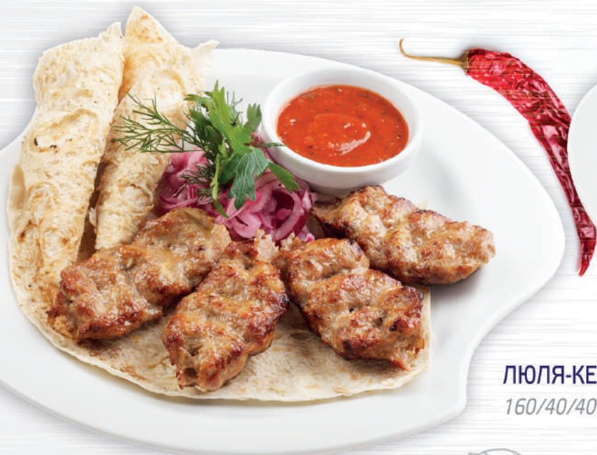
ЛЮЛЯ-КЕБАБ ИЗ КУРИЦЫ 160/40/40 гр 240 Р