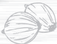
ШАШЛЫК ИЗ ОВОЩЕЙ Перец болгарский, баклажан, томат, цукини, шампиньоны, лук репчатый, зелень 300гр 280 Р