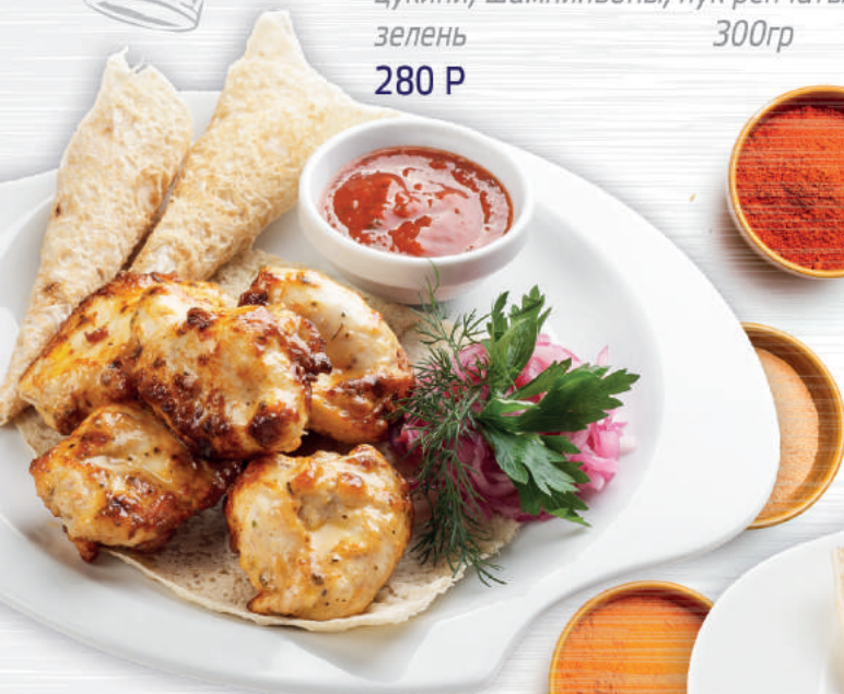
ШАШЛЫК ИЗ КУРИЦЫ 180/40/40 гр 280 Р