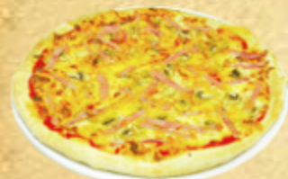
ГРИБЫ И ВЕТЧИНА

Консервированные шампиньоны, сыр "моцарелла", специи.