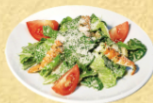
САЛАТ ЦЕЗАРЬ С КРЕВЕТКАМИ

Салат «романо», соус «цезарь», куриная грудка обжаренная на гриле, помидоры, гренки, сыр пармезан.