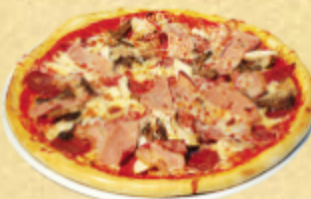
ДЕ ЛЮКС МЯСНАЯ

Консервированные шампиньоны, ветчина, сыры: "моцарелла" и "чеддер"; орегано.