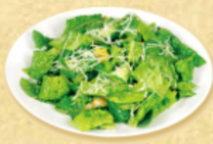
САЛАТ ЗЕЛЁНЫЙ С КРЕВЕТКОЙ

Салат "романо", свежие помидоры и огурцы, болгарский перец, сыр "фета", маслины, красный лук, оливковое масло с бальзамическим уксусом.