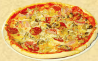
ВАС ИС ДАС

Ветчина, ананасы, сыр "моцарелла", специи.