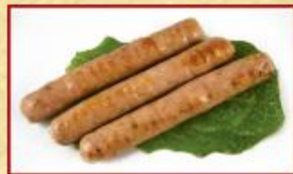
КОЛБАСКИ СВИНЫЕ С СЫРОМ

Свинина, шпиг, специи. Рекомендуем заказать гарнир.