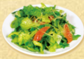
САЛАТ ЗЕЛЁНЫЙ С ЛОСОСЕМ С/С

Салат "романно", свежий огурец, авокадо, масло оливковое, тигровые креветки, соус песто, лимонный сок, сыр пармезан.