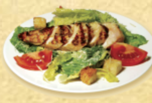
САЛАТ ЦЕЗАРЬ С ГОРЯЧЕЙ КУРИЦЕЙ

Куриное филе, свежие огурцы, помидоры "черри", салат "романо", болгарский перец, гренки, имбирь, сыр "пармезан", лук, кунжут, острая заправка, майонез.