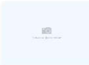
Удон с курицей карри

200 г / 260 ккал 5,6 г | 18,75 г | 1,2 г