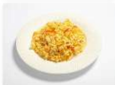
Рис с овощами и зеленым маслом