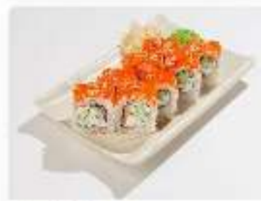
Ролл Калифорния с лососем