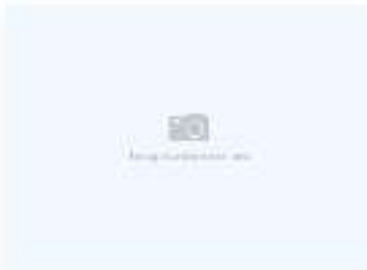
Удон с курицей с черным перцем

200 г / 230 ккал 5,6 г | 18,75 г | 1,2 г