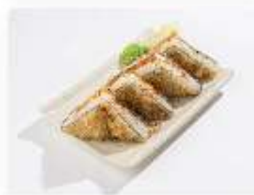
Теплый сэндвич Калифорния