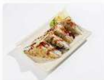
Теплый сэндвич Филадельфия