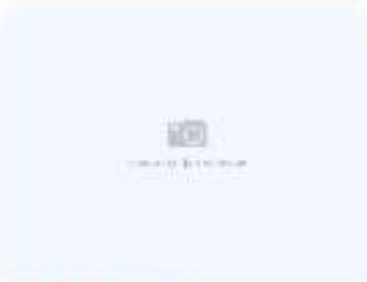
Горький ролл Сяко