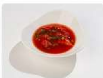
Соус томатный с травами