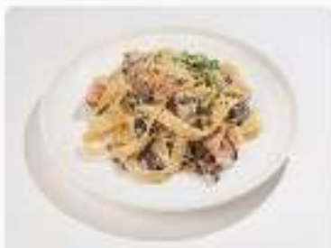
Тальятелле с грибами и беконом

200 г / 270 ккал 5,7 г | 18,75 г | 1,2 г