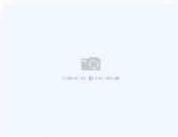
Ролл с обожженным лососем