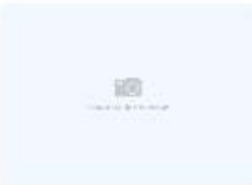
Удон с говядиной с черным перцем

200 г / 280 ккал 5,6 г | 18,75 г | 1,2 г