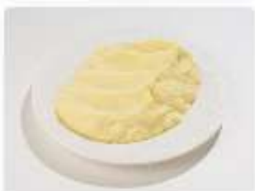
Двойное пюре картофельное