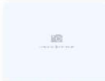
Теплый сэндвич Канадский