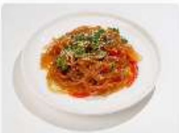
Вок Лапша рисовая с овощами (острая)

200 г / 280 ккал 5,2 г | 18,75 г | 1,2 г