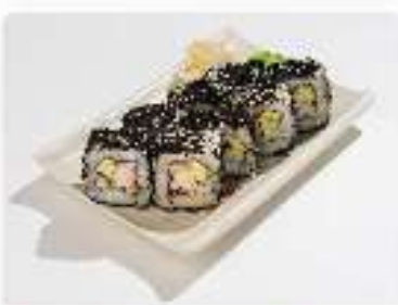
Ролл с креветкой слайс