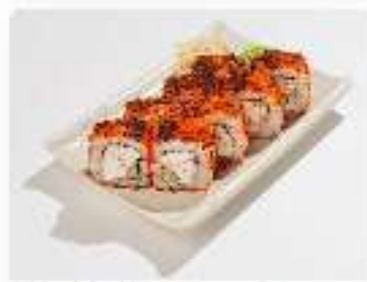
Ролл Калифорния с крабом