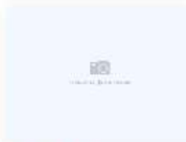
Хот ролл Ниппон