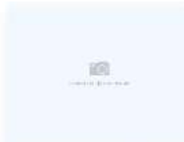
Ролл с креветкой и сыром