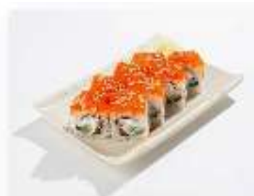
Ролл Сливочный лосось