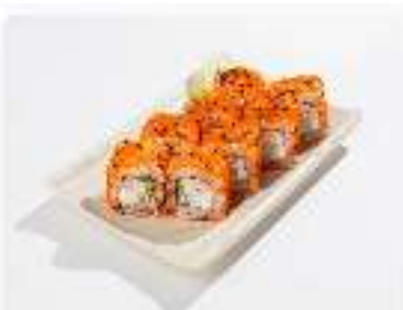
Ролл с крабовым мясом и сыром