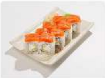
Ролл Филадельфия люкс