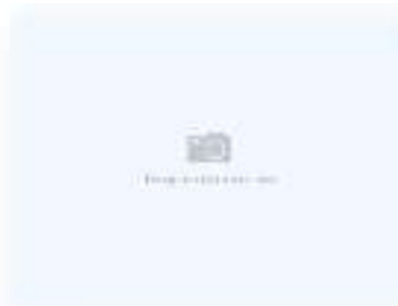
Ролл с угрем слайс