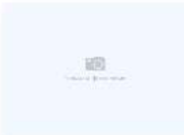
Рис с курицей карри

200 г / 270 ккал 5,7 г | 18,75 г | 1,2 г