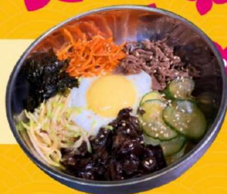
Рис с маринованными овощами, говядиной и жареными грибами, украшенные яйцом и белым кунжутом. Подается с острым соусом и горячим бульоном