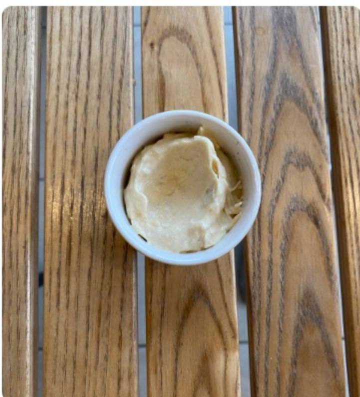
СОУС ЦЕЗАРЬ / 35 г. Майонез, печеный чеснок, халапеньо, оливковое масло, ворчестер, горчица, лимонный сок, пармезан 100 р.