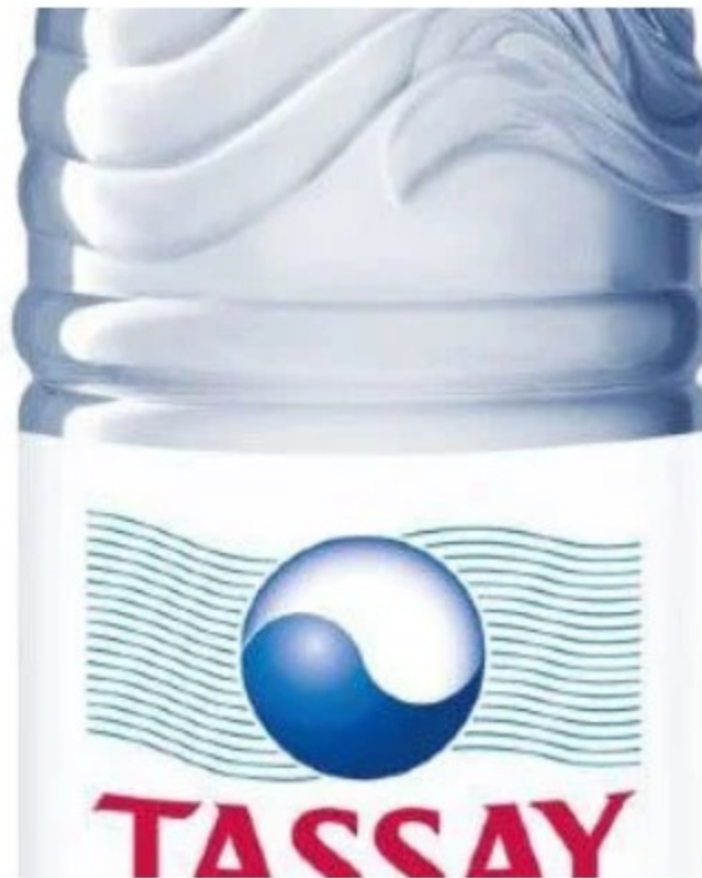
Вода негазированная Tassay / 500 ml 150 р.