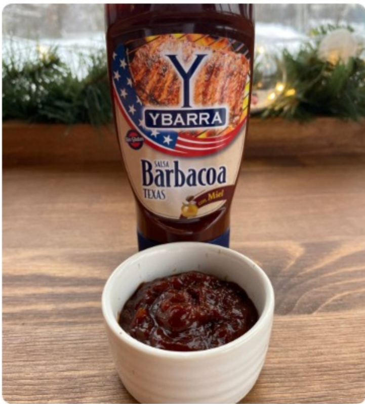
СОУС BBQ / 35 г. 150 р.