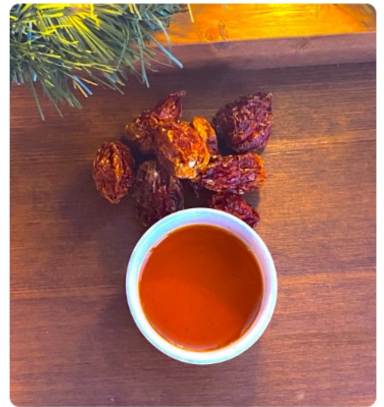
МАСЛО ИЗ ПЕРЦА ХАБАНЬЕРО / 20 г. Оливковое масло, подсолнечное масло, перец Хабаньеро, перец тiх, лавровый лист, корица, гвоздика, чеснок 150 р.