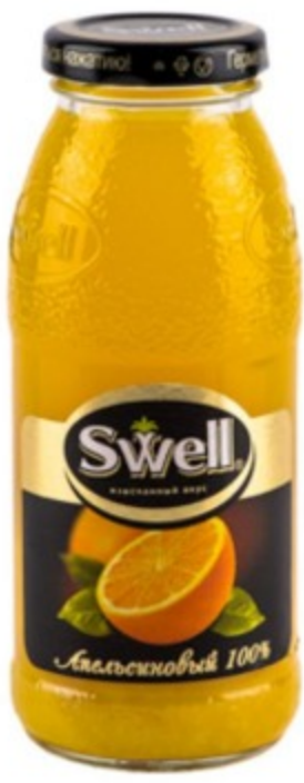
Сок апельсиновый / 250ml 200 р.