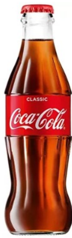
Соса-Сол / 330 ml Грузия 200 р.