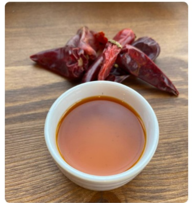
МАСЛО ЧИЛИ / 20 г. Оливковое масло, подсолнечное масло, чили перец, перец тiх, лавровый лист, корица, гвоздика, чеснок 100 р.