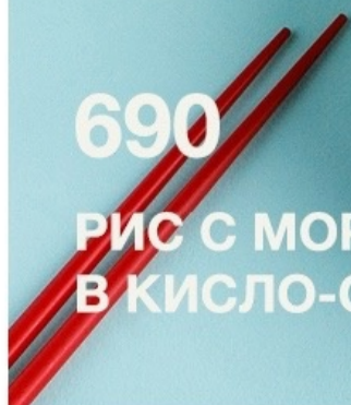
РИС С МОРЕПРОДУКТАМИ В КИСЛО-СЛАДКОМ СОУСЕ