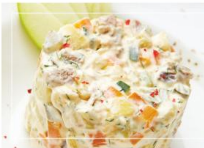
Оливье с уткой и яблоком