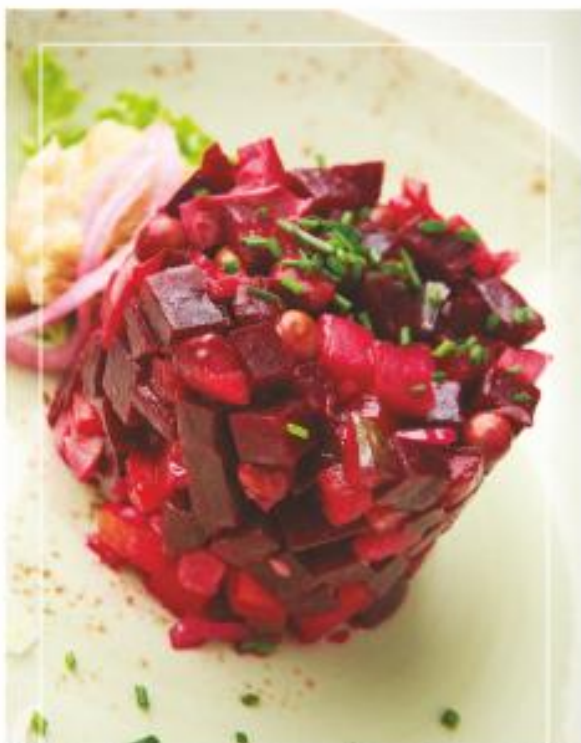
Винегрет с солеными груздями