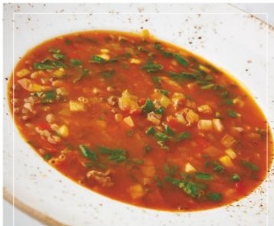
Чечевичный суп с телятиной и шпинатом