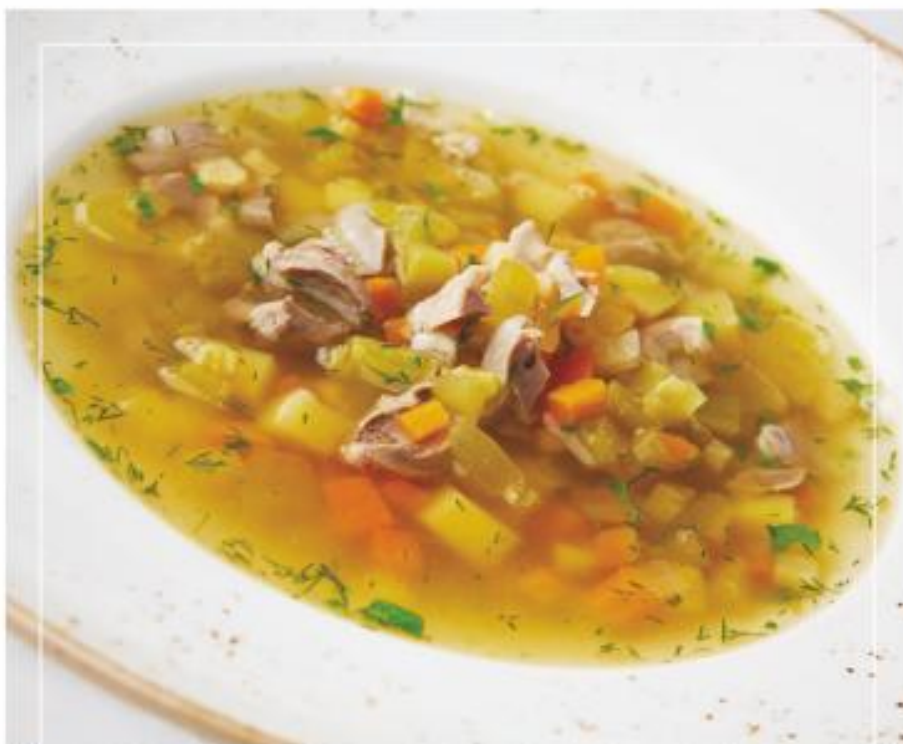
Рассольник с куриными потрошками